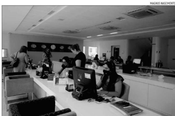
Agências afirmam que alta é reflexo da demanda reprimida de viagens durante a pandemia

« PASSAGEM » Mercado de viagens segue aquecido e em recuperação após quase dois anos de baixas por causa da pandemia. Agências de turismo em Natal registram bom movimento vendas no início deste ano