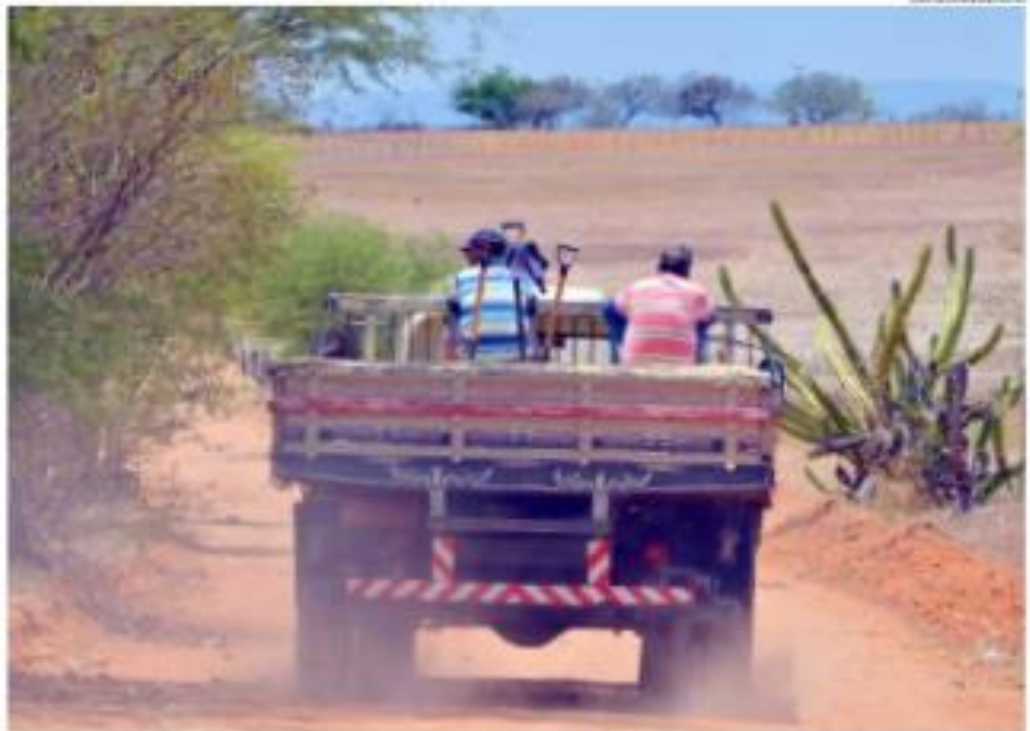
Ministério da Economia avalia que a medida pode diminuir custos no setor e elevar a competitividade no país

devida dos profissionais de transporte. Pelo plano, caberá ao Conselho Nacional de Trânsito definir procedimentos simplificados para a baixa definitiva de veículos classificados como sucata.