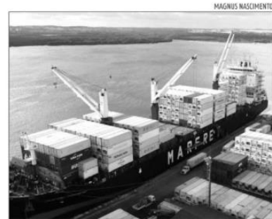
Balança comercial acumula superávit de US$ 11,313 bilhões

Em relação às importações, os maiores crescimentos foram registrados nos seguintes produtos: pescados (+114,3%), frutas e nozes não-oleaginosas (+50%) e soja (+81,9%), na agropecuária; carvão não aglomerado (+113,7%), óleos brutos de petró-