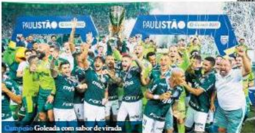
Campeão Goleada com sabor de virada

Corinthians venceu o Palmeiras por 4 a 0 no domingo em São Paulo e conquistou o título de campeão paulista.