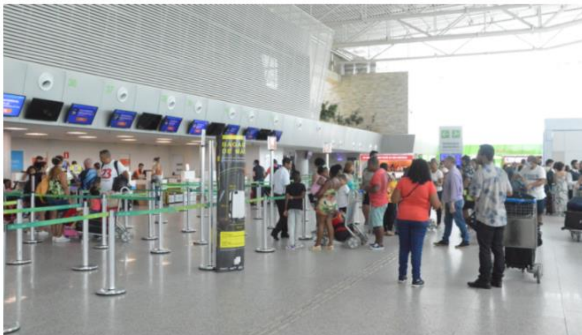
Aeroporto de Natal.