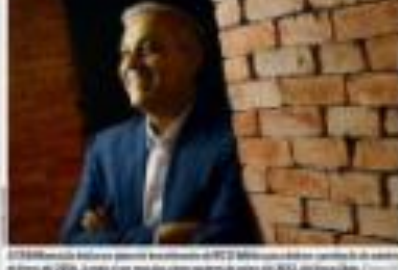
Um executivo da Avon discute a expansão da empresa em mercados internacionais.