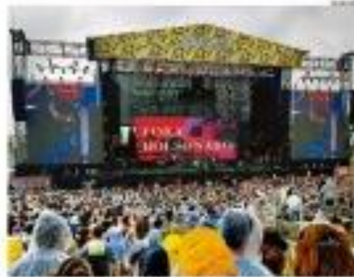
Um momento do festival de música em São Paulo.

Partido do presidente entrou com ação após Pablo Vittar agitar cartaz de Lula