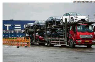
Parado. Caminhão em frente à fábrica da Tesla, em Xangai: nova interrupção

A Foxconn, uma das principais fornecedoras da Apple, que também tem fábrica na China, foi outra que parou suas operações em março. A unidade fica no maior polo tecnológico chinês, onde vivem 17 milhões de pessoas, em Shenzhen. Assim como Xangai, a cidade registrou aumento de ca-