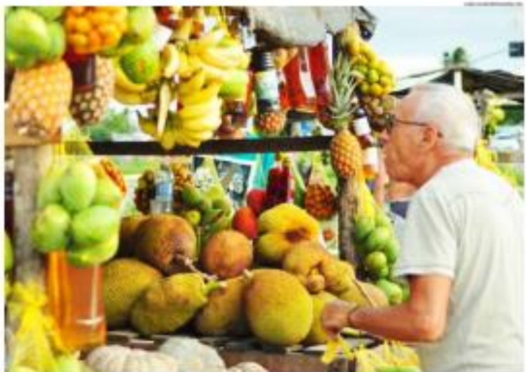
Agricultura familiar é uma atividade que abrange uma parcela da sociedade e está inserida na região Nordeste

Grande do Norte, assina a coordenação desses espaços de discussão que visam à qualificação das ações em prol do fortalecimento da agricultura familiar na região.