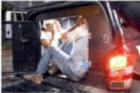
"Sangria", segundo levantamento da imprensa.

Repartições públicas voltam com atividades presenciais