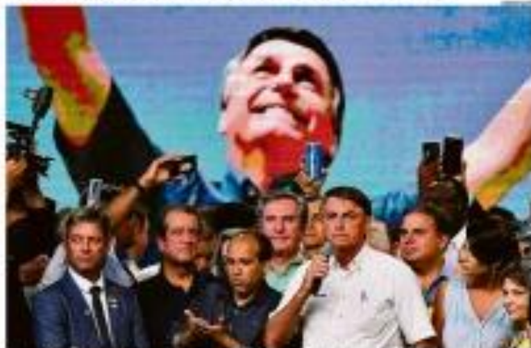
Um momento de uma manifestação em apoio a Bolsonaro.