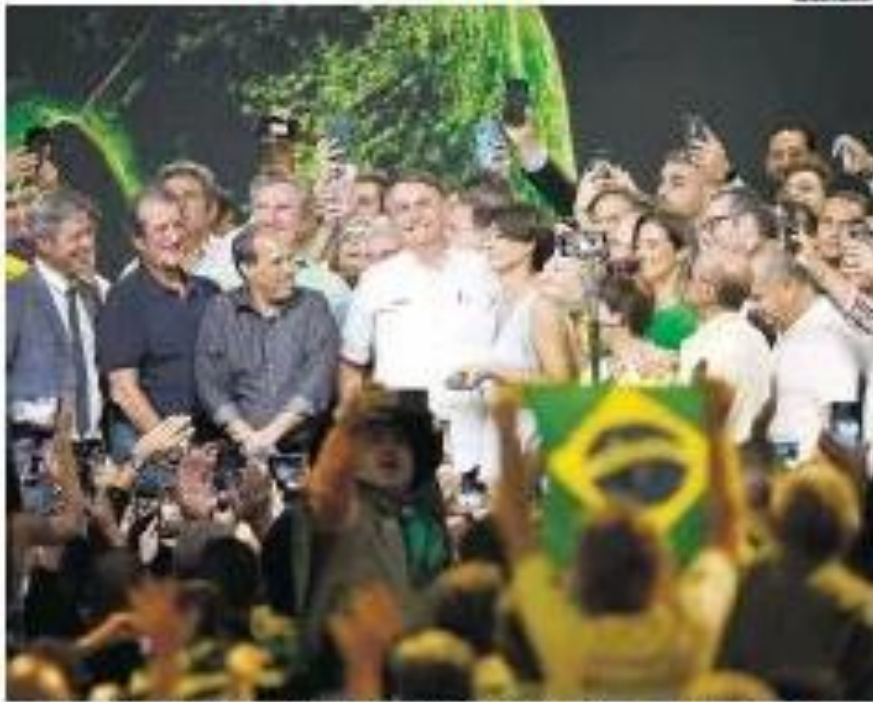
O presidente Jair Bolsonaro com o ministro Roberto, e outros em um dos momentos organizados pelo PL, antes do festival

Decisão, tomada a pedido do PL, fere jurisprudência, dizem especialistas