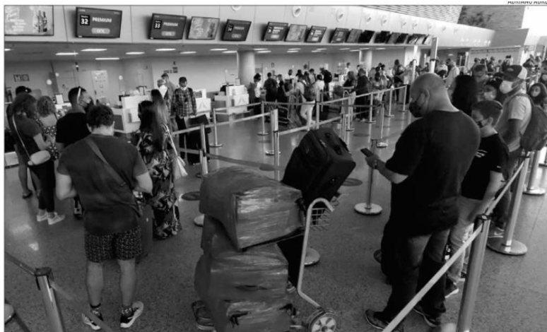
Segundo a Anac, o Rio Grande do Norte, entre embarque e desembarques, registrou 1,8 milhão de passageiros durante 2021

Aliado a isso, crescimento de aproximadamente 55,8% na demanda e oferta do transporte aéreo no ano passado ante os dados registrados em 2020 contribuíram para a alta da tarifa. O valor do dólar, outro componente que impacta diretamente os custos do setor, terminou 2021 valendo 8,4% a mais em relação a 2020. Os aeroportos no Rio Grande do Norte, entre embarque e desembarques, registram 1,8 milhão de passageiros. Foram analisados dados de voos nos aeroportos Aluizio Alves (São Gonçalo do Amarante), Dix-Sept Rosado (Mossoró) e da