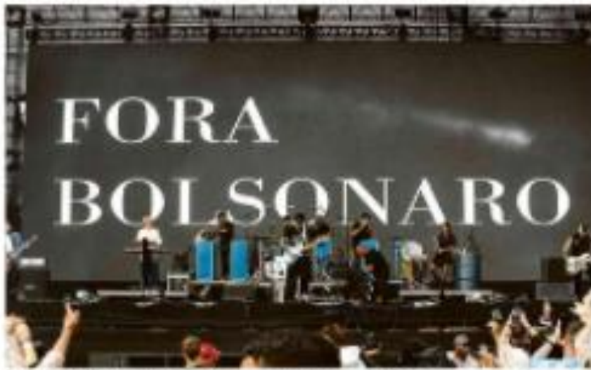
Artistas no festival de São Paulo, que inclui nomes como Paulo Vitor, após o corte acabou pedida do PL, apoiador de Lula, pela lista em que Paulo Vitor exibiu imagem de Lula (PT).

A pressão por parte do PT para que o TSE não censure a imagem de Lula no festival de música foi uma das principais razões para o corte da lista de artistas, segundo o ministro da Justiça, Alexandre de Gusmão.