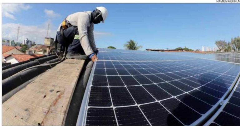
Segundo a Absolar, o sistema solar fotovoltaico do Brasil ultrapassou a marca de 14 gigawatts (GW) de potência operacional

O segmento atraiu mais de R$ 21,8 bilhões em investimentos em 2021, incluindo as grandes usinas e os sistemas de geração em telhados, fachadas e pequenos terrenos. O resultado representa um crescimento de 49% em relação aos investimentos acumulados até o final de 2020 no País.