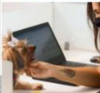
Uma mulher trabalha em um escritório com um cachorro ao lado dela. Ela está usando uma máscara facial e olhando para o computador.