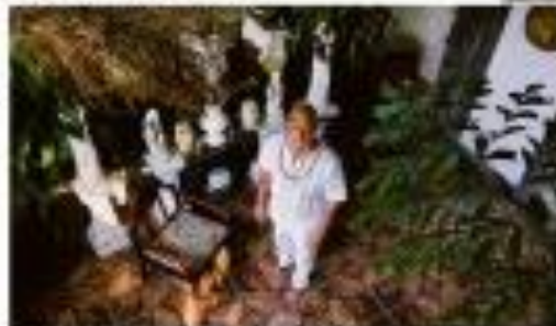
Uma manifestante em um traje de proteção completa.