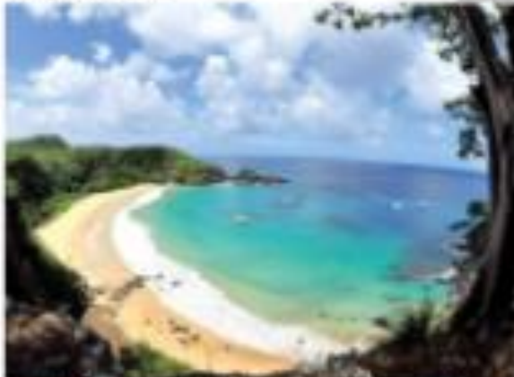
Briga no STF, segundo levantamento da imprensa.

PF instaura inquérito para suspeitas na Educação