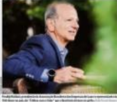
À esquerda: o ministro da Economia, Paulo Guedes. À direita: o ministro da Fazenda, Henrique Meirelles.