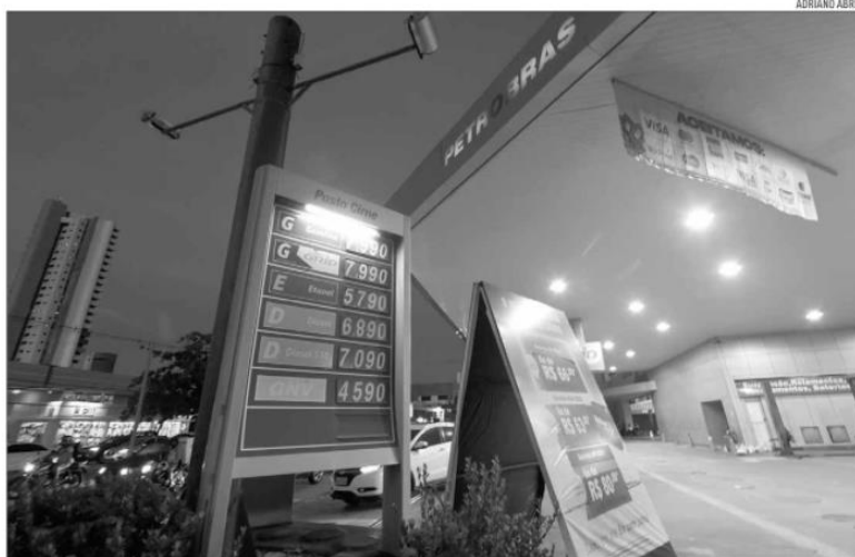
Confaz também prorrogou até 30 de junho o congelamento do ICMS que incide sobre o preço final da gasolina, etanol e gás de cozinha