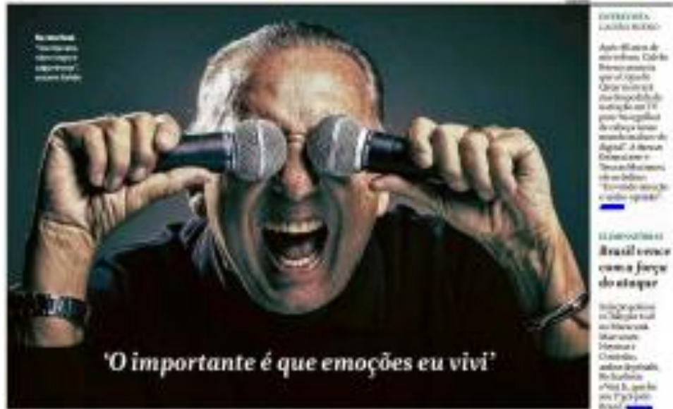
'O importante é que emoções eu vivi'

Dota Dilma e uma dorça de asarões fortes no Senado