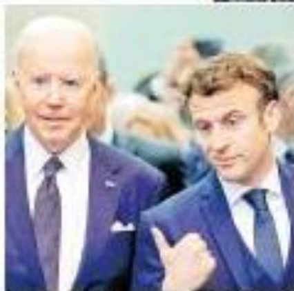
Putin (E) e Macron, em Moscou, assinam um tratado de cooperação econômica.

Artigo ... ... mais Weekly Update 10. 2022 A Economia do Brasil: Como está o cenário econômico?