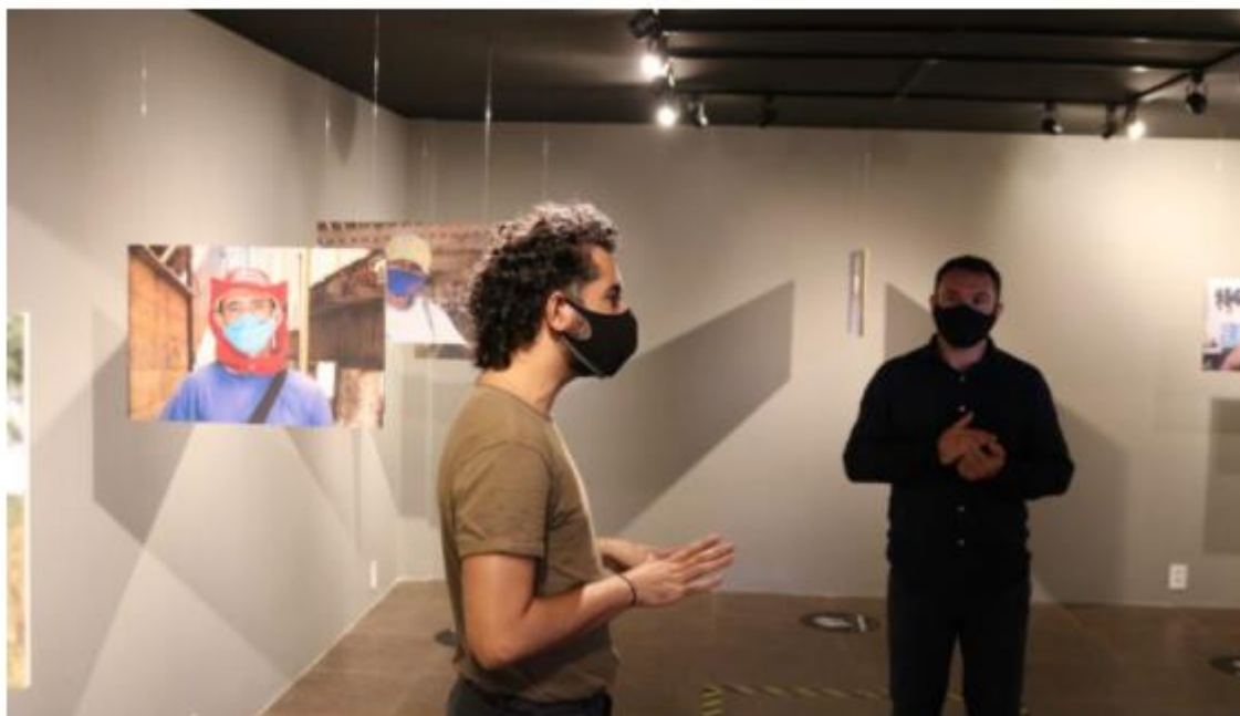
As duas seleções fazem parte dos editais de cultura do Sesc RN para o ano de 2022.