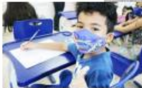
Estudante em sala de aula, de face ao processo de ensino presencial