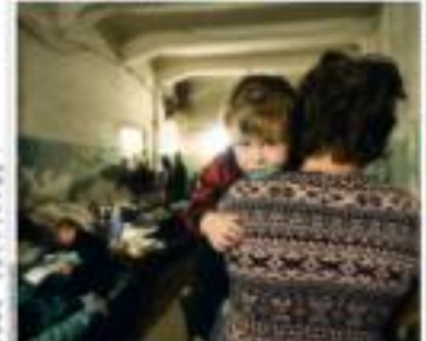
Um grupo de pessoas em um abrigo para vítimas de um terremoto na China.