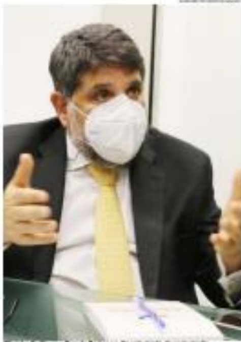
Ministro Guilherme Caputo Bastos na cerimônia de registro