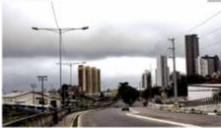
15/06/2021 - Avenida Aldeias para a todos a todos é de trânsito regular. Segundo a engenharia Ulisses Soares, de Natal, a avenida pode ser considerada uma das melhores de Natal. 15/06/2021