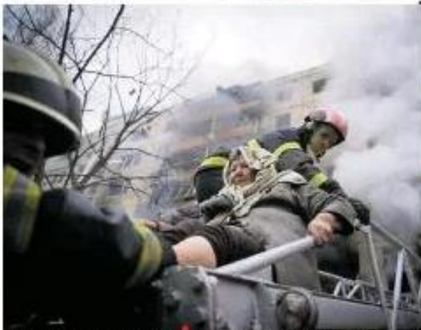
Bombeiros resgatam mulher de prédio residencial em São Carlos, capital de São Paulo, incendiado pela Rússia depois de tróvão aéreo atingi-lo