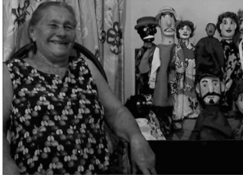
Os curtas "Saudades" e Dona Dadi (fotos) estão entre os que serão exibidos no evento que marcará o lançamento do edital cultural do Sesc/RN este ano