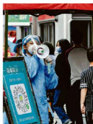
Voluntária guia chineses para teste de Covid em Shenzhen, que adotou lockdown; Bolsas do país despencam.

Medidas que as autoridades monetárias do Brasil e dos Estados Unidos deverão anunciar nesta quarta-feira (16) para enfrentar a escalada da inflação também influenciam os mercados dos dois países nesta semana.