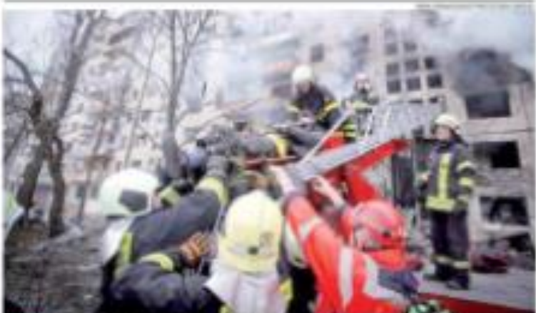
«LUMINAR» - Bombeiros trabalham para salvar vidas, resgatar feridos, e combater o fogo. A possibilidade de ocorrer um acidente no comércio. Registre-se para não sofrer danos pessoais. Indivíduos com deficiência após sofrerem um acidente.

Usuários de plantas de saúde no RN crescem 7,9% em um ano Segundo dados divulgados pelo Conselho Municipal de Natal, o número de usuários de plantas de saúde em Natal cresceu 7,9% em um ano, passando de 1.100 para 1.180 usuários.