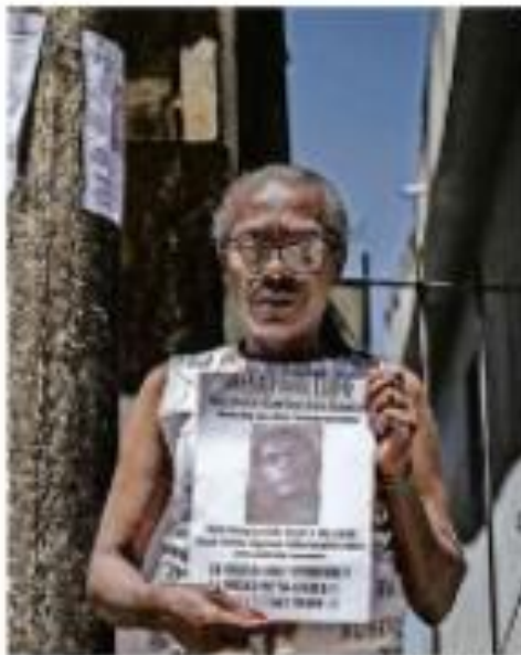
QUASE 1 MÊS APÓS CRIMES, MULHER BUSCA DÍVIA A busca por Dívina é intensa. Ela registra o caso com fotos de documentos e fotos, já que não quer se identificar. Ela quer a identidade da mulher que se tornou a mulher que ela busca.