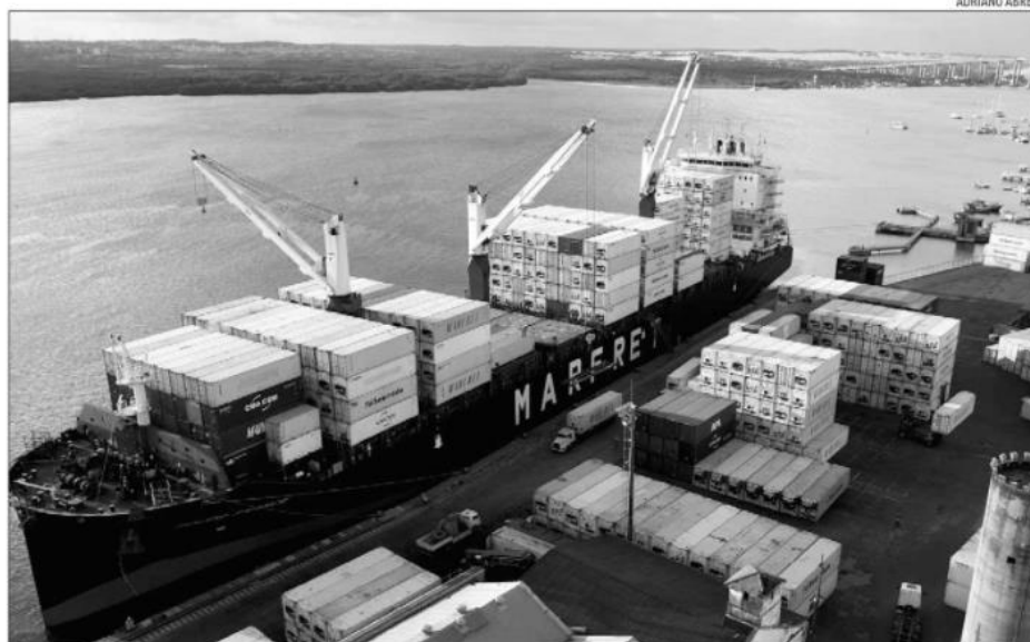
Números das exportações potiguares apontam para aumento de 172% se comparados apenas o mês de fevereiro deste ano