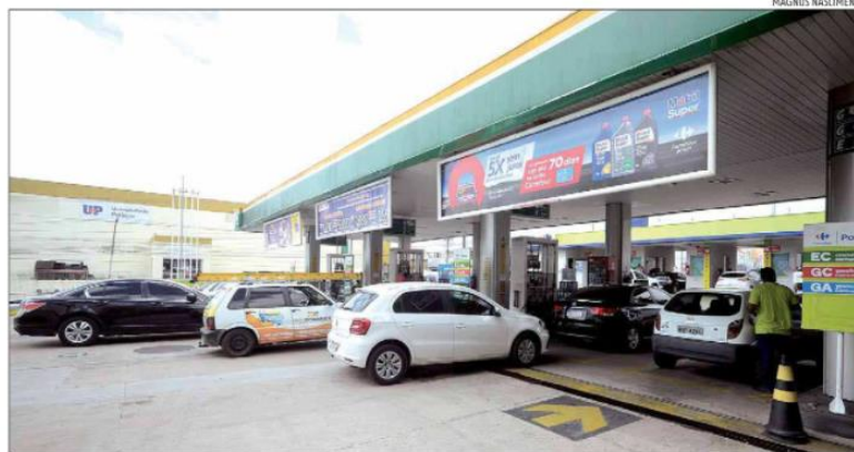
Preço médio da gasolina nos postos de combustível saltou de R$ 5,70 em março para R$ 7,15, segundo a ANP

de cozinha em 16%, reduzindo assim a defasagem da estatal em relação ao mercado internacional, que já beirava os 50%. Em um ano, ficou 25,3% mais caro abastecer com gasolina comum no Rio Grande do Norte.