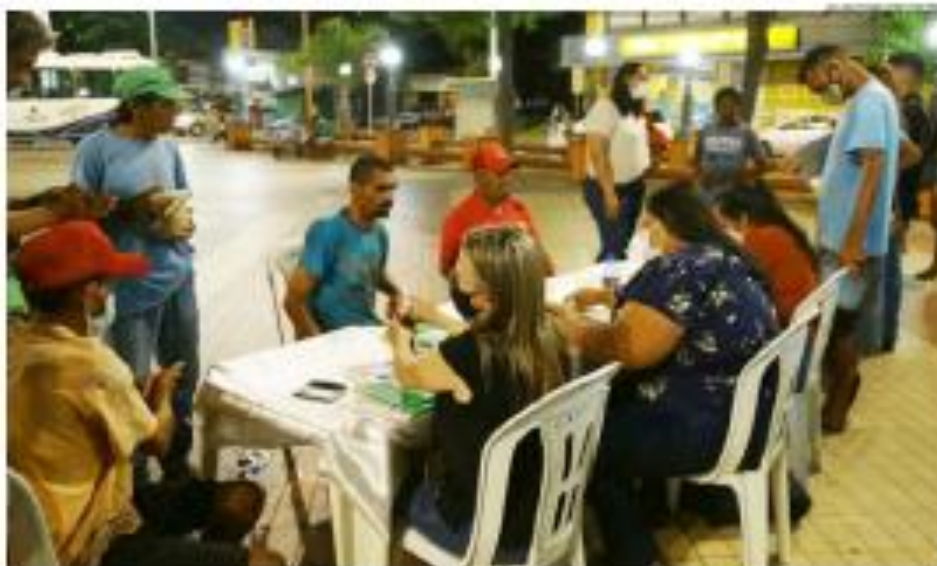
Equipe multiprofissional atende as pessoas que estão em situação de rua, na área de 302 e realiza ações de permanência familiar, sempre em Mossoró.

Todas as noites, oferta acompanhamentos familiares das pessoas que estão em situação de rua, oferecendo uma complementação alimentar e também parando diversos diálogos como documentação civil e encaminhamentos para a rede de saúde, de educação e para justiça.