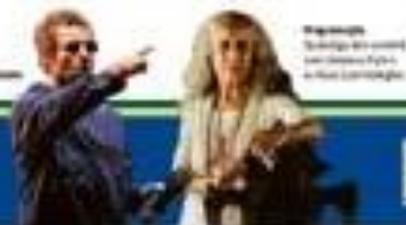
Programa Sábado, em versão para o novo canal do Rio Entertainment

Estrelas no Rio: Nova casa de show tem Bethânia na estrela e astros internacionais