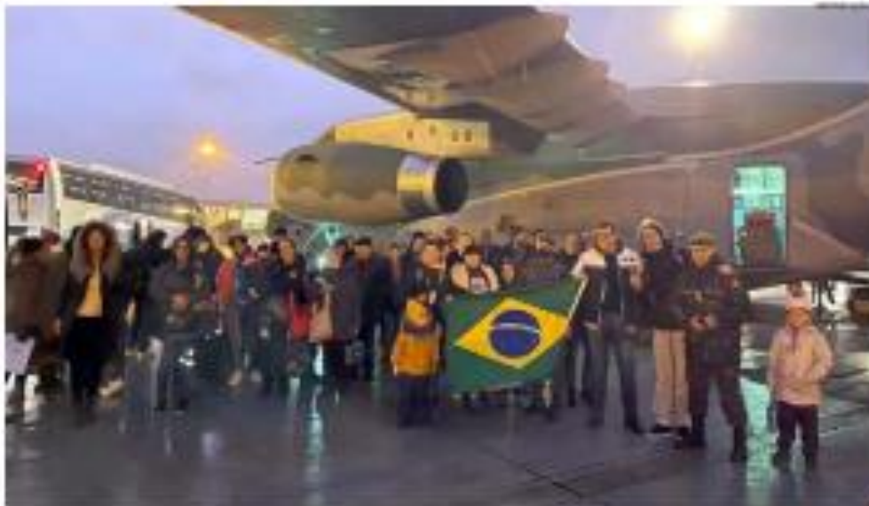
Idem de brasileiros, argentinos, espanhóis e ucranianos saíram a bordo de avião que libertou/resgatou pessoas de situação _ PÁG.11