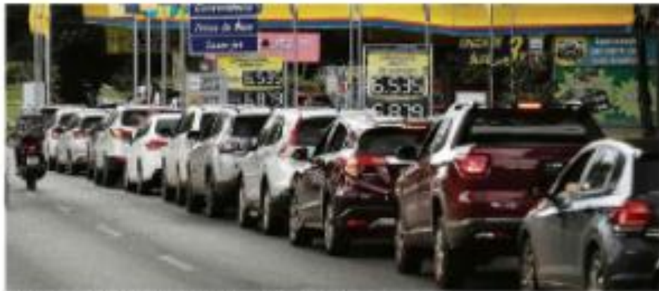
Uma longa fila de carros aguardando abastecimento em uma estação de gasolina em São Paulo.