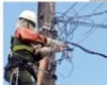
Trabalhador em manutenção de rede elétrica em Natal.

Estado apresenta saldo negativo de empregos em janeiro, diz Caged