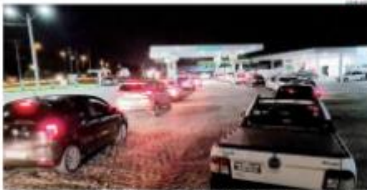
Uma estação pagadora de gasolina em Natal. O preço do litro da gasolina comum chegou a R$ 7,99.

■ BOMBA - Após uma semana paralisada pela greve dos trabalhadores, o preço do litro da gasolina comum em Natal está em R$ 7,99. A alta foi de 10 centavos em relação ao dia anterior. Mas há uma boa notícia: o preço não deve subir mais neste fim de ano. Isso ocorre porque o preço do petróleo está em queda desde o início de 2014. Segundo a Associação Nacional de Distribuidores de Petróleo (ANDEP), o preço do barril de petróleo caiu 40% em relação ao início de 2014.