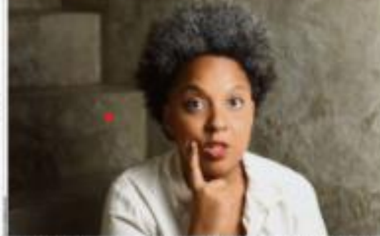
Um novo perfil: a mulher é o novo protagonista do mercado de trabalho. Ela busca equilíbrio entre vida profissional e pessoal.