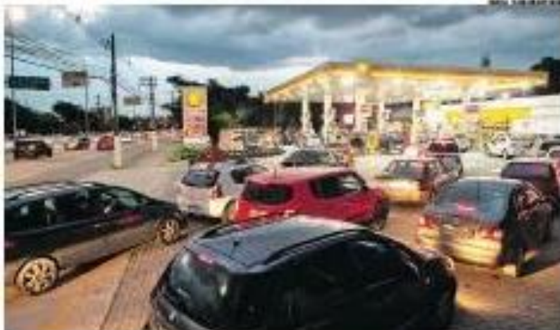
Comentários: Nemora: 10 para abastecer no posto de gasolina no Marginal de Tietê, zona oeste de SP, no domingo da noite de ontem

Parlamentares aprovam novo ICMS e auxílio para motoristas