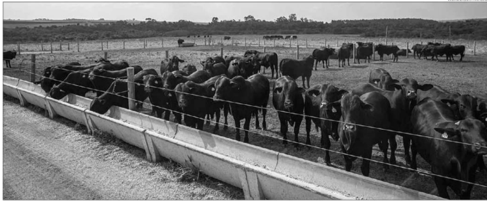
No quarto trimestre do ano passado, segundo o IBGE, a agropecuária brasileira teve o melhor desempenho, avançando 5,8% em relação ao terceiro trimestre

"O PIB do quarto trimestre foi o melhor do que esperávamos e o melhor do que esperávamos e