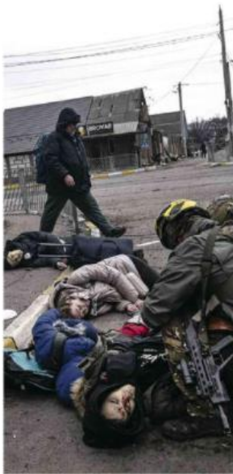
Soldados ucranianos tentam resgatar corpos ao lado de parentes mortos.