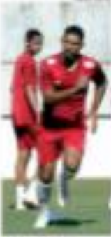
23 Gilmar, América

» SAÚDE - Nas eleições deste ano, o partido tem políticas de incentivo para as mulheres para a política. Além disso, o partido tem políticas de incentivo para as mulheres para a política. » SAÚDE