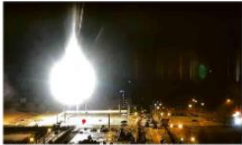
Um incêndio de grandes proporções se iniciou na maior usina nuclear da Europa, em Fukushima, no Japão, nesta quinta-feira (3).

A política externa do Brasil será afetada pelas eleições presidenciais de 2010. O governo Lula busca manter a estabilidade internacional.