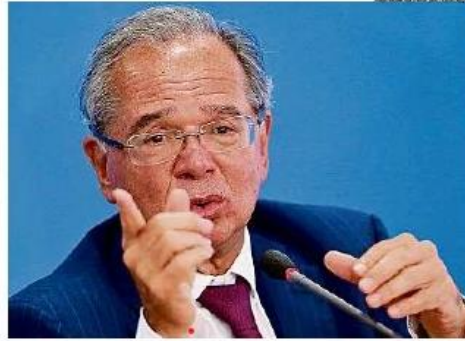
Chamariz. Guedes pretende atrair investidores com mudança no IR, o que pode incentivar financiamento privado

Dentro deste arsenal de medidas para aquecer a