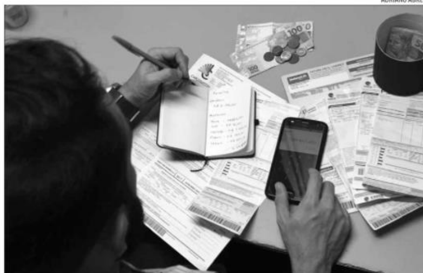
Pesquisa da CNC mostra que, no mês passado, 76,6% das famílias afirmaram estar endividados

Apurada mensalmente pela CNC desde janeiro de 2010, os dados são coletados, em todas as capitais dos Estados e no Distrito Federal, num universo de cerca de 18.000 consumidores. Segundo a pesquisa, o percentual de famílias que relataram ter dívidas a vencer (cheque pré-datado, cartão de crédito, cheque especial, carnê de loja, crédito consignado, empréstimo pessoal, prestação de carro e de casa) atingiu 76,6% em fevereiro, retomando o nível apurado em dezembro de 2021. Há um ano, a proporção de endividados era de 66,7%, 9,9 pp abaixo do número atual.