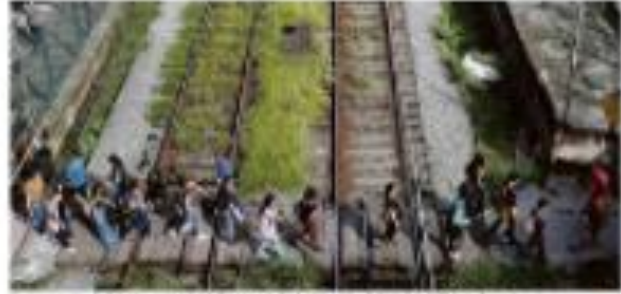
Manifestantes se reúnem em frente a uma estação de trem em São Paulo, durante uma greve dos funcionários da CPTM.

O sucesso eleitoral do candidato da oposição em 11 de maio pode levar a mudanças significativas no governo.