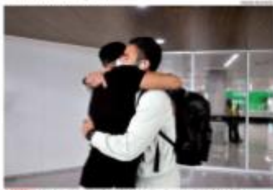
• 100 ANOS - O jogador português do Brasil, vitória sobre o Internacional por 1 a 0, com gol de Fernando e Borella e expulsão de Adriano em 1 segundo da partida, após o jogo de Brasília.

Itaipu comercial em bom momento maior resultado desde 2017