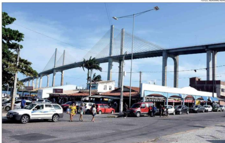
Início da reforma do Mercado da Redinha depende de acordo com permissionários. Outros lotes do complexo já foram iniciados

No quebra-mar será realizada a recuperação da estrutura por meio da execução de piso de concreto pigmentado sobre o atual revestimento em paralelepípedo, bem como a melhoria da iluminação e criação de um mirante na extremidade do espigão, promovendo um espaço de contemplação aos pedestres, para que aproveitem a vista do mar e da Fortaleza dos Reis Magos.