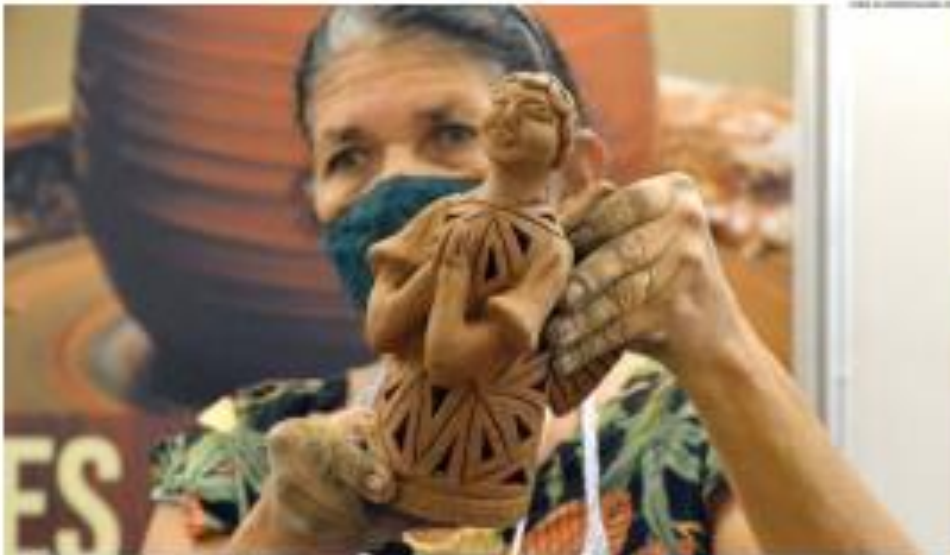
Oficinas e palestras técnicas em desenvolvimento, marketing e técnicas serão oferecidas a partir deste mês de março. _ PÁG. 8

reflete uma verdade crucial, "que a situação que se vive na Ucrânia" representa uma ameaça à abertura de portas de atendimento para inocentes que buscam refúgio e proteção.