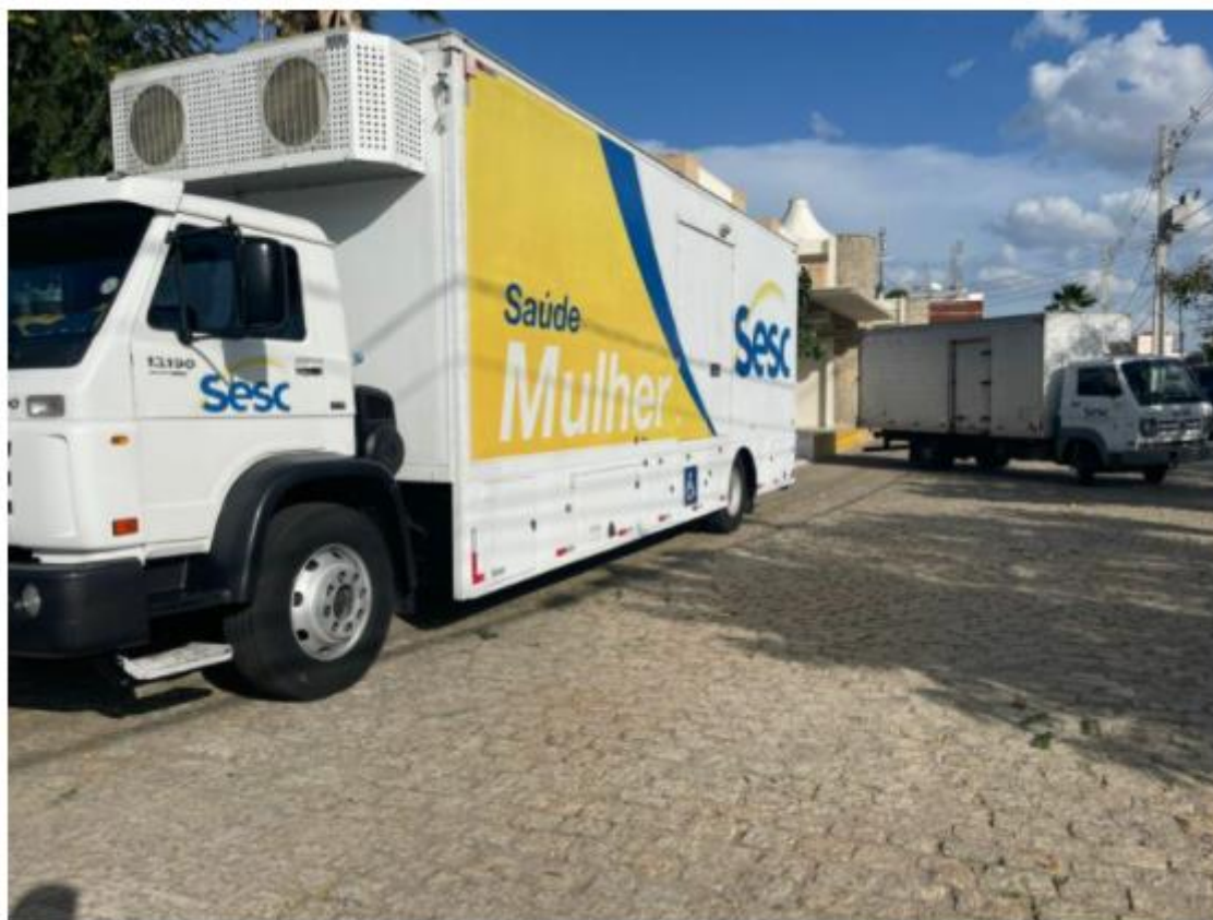
A Unidade Móvel Sesc Saúde Mulher ficará instalada ao lado da rodoviária.

Por Da Redação - 3 de março de 2022 - 21h40