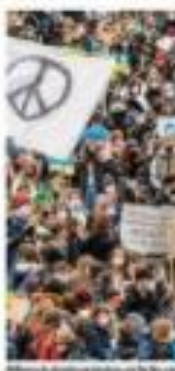
Manifestantes em uma manifestação em São Paulo, em apoio à Ucrânia.

Com a Rússia e a Ucrânia em conflito, o preço dos alimentos no Brasil aumentou. O preço dos alimentos no Brasil aumentou.