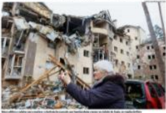
Um edifício residencial destruído em Kiev, Ucrânia, após ataques aéreos russos.

O ministro da Fazenda, Paulo Guedes, afirmou que o Brasil não se importa com o default russo em razão da guerra na Ucrânia. Ele afirmou que o Brasil não se deixará intimidar por ameaças de retaliação econômica por parte da Rússia. 30