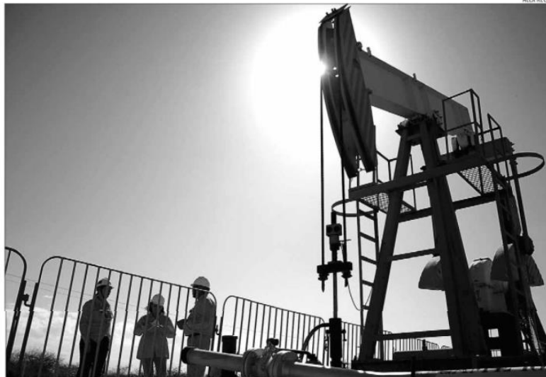
Blocos exploratórios ofertados em leilão circundam campos de produção da Petrobras e áreas vendidas pela estatal no Estado

As 61 áreas exploratórias que serão ofertadas na Bacia de Sergipe-Alagoas podem