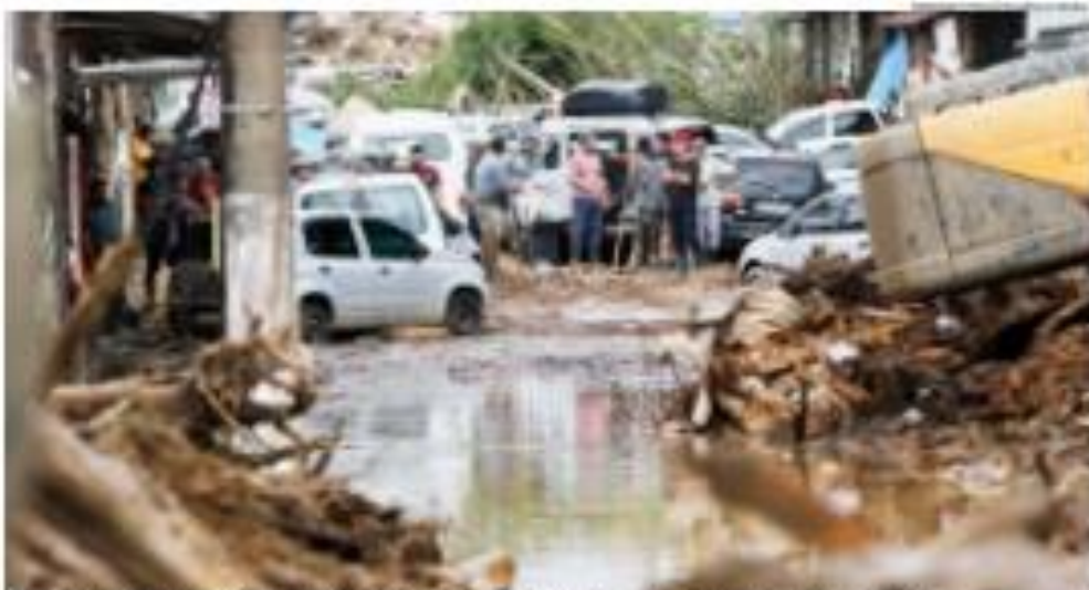
Último primeiro dia de buscas, na Região Serrana do RJ, corajosa com o espírito de tropas aliadas feitas pelo prefeito. PÁG. 12