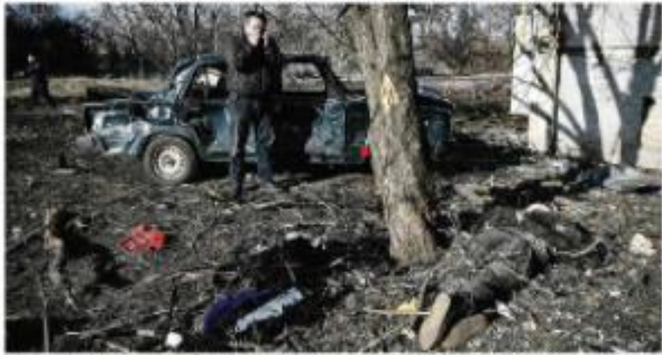
Um homem se aproxima de um carro destruído por um ataque aéreo em uma cidade do leste da Ucrânia, sob o domínio russo, durante a operação militar.

Os Estados Unidos e outros países ocidentais condenaram a operação militar e ofereceram ajuda humanitária e financeira à Ucrânia. O presidente Joe Biden anunciou que os EUA estavam enviando armas e equipamentos militares para a Ucrânia. A União Europeia também anunciou que estava enviando ajuda financeira e humanitária.