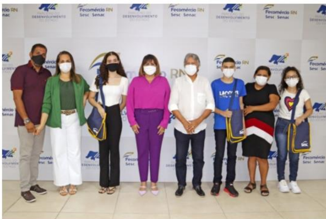
Gestores da Fecomércio e Sesc com os novos alunos e a concluinte da ESEM

Com os novos alunos, sobe para 55 o número de potiguaros que ingressaram na instituição referência no país.