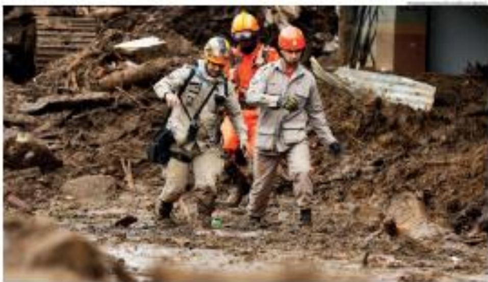
Rescueiros de socorro médico trabalham em Isolda, que levou 10 feridos para alguns momentos por causa das condições climáticas. _PÁG.12

Isolda comentei as parcerias com o setor privado, as relações com a sociedade, com o meio ambiente e as parcerias com a sociedade.