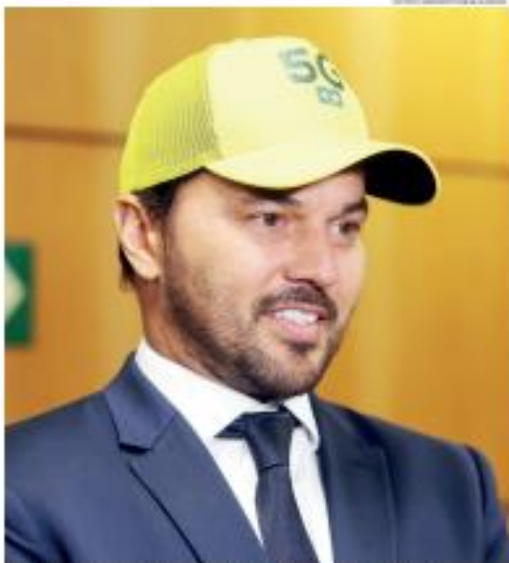
Fábio Faria em uma reunião, após o anúncio de seu apoio ao projeto de lei que cria o 5G como legado.

O ministro das Comunicações, Fábio Faria (PSB), anunciou nesta terça-feira (12) seu apoio ao projeto de lei que cria o 5G como legado. Faria afirmou que não houve interferência de Jair Bolsonaro na decisão. Ele também mencionou o apoio de Rogério Marinho (PT) e a importância de deixar o 5G como legado para o Brasil.