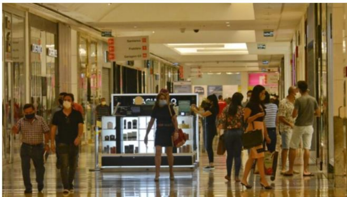
Shoppings terão horário de funcionamento diferente no carnaval

Durante os dias de Carnaval, o comércio seguirá funcionamento em horário diferenciado. Conforme aditivo à convenção coletiva de trabalho 2022 firmada pelo Sindicato do Comércio Varejista no Estado do RN (Sindilojas RN), a Fecomércio RN informa o horário de funcionamento entre os dias 26 de fevereiro e 2 de março.