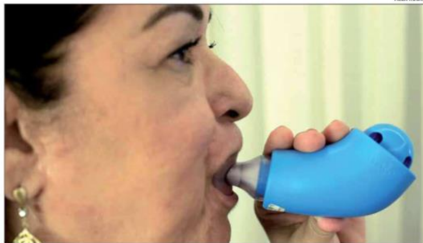
Sintomas incluem falta de ar, tosse, dor torácica, perda de olfato e paladar, cefaleia, entre outros

A liberação do investimento foi assinada na última semana pelo ministro da Saúde, Marcelo Queiroga. “Os leitos de unidade de terapia intensiva (UTI) são importantes, mas se tivermos uma atenção primária preparada teremos mais condições de en-