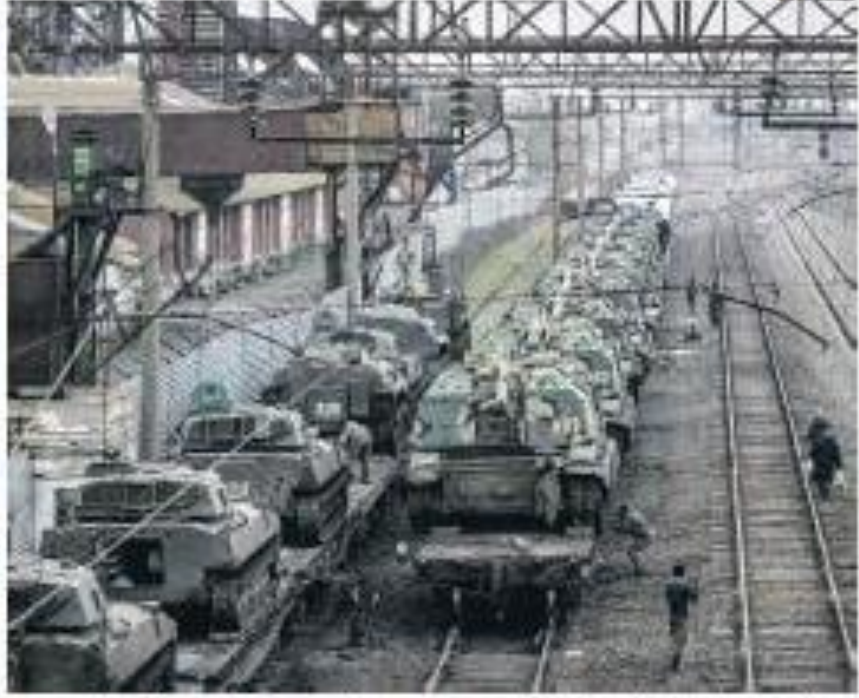
Tropas russas em movimento em direção ao leste da Ucrânia, duas áreas separatistas reconhecidas por Moscou.

O governo russo anunciou a entrada de tropas militares para controlar as áreas de Donetsk e Luhansk, duas regiões separatistas no leste da Ucrânia. A decisão foi anunciada no início desta madrugada (segunda de manhã), dois dias depois de Moscou reconhecer essas regiões separatistas sob o nome de Donetsk e Luhansk, como independentes. A ordem veio após um dia de negociações com os Estados Unidos, Alemanha, França, Reino Unido, Itália, Espanha, Holanda, Bélgica, Canadá e outros países, incluindo o Brasil, para evitar a escalada da situação. Putin disse que o envio de tropas russas para o leste da Ucrânia é uma medida necessária para garantir a segurança dessas áreas.