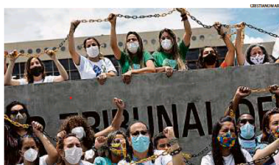
Protesto. Manifestação liderada por pais e mães de crianças com autismo defende que a cobertura dos planos deve ir além da lista de procedimentos definida pela ANS

Ontem votou a ministra Nancy Andrighi, que discordou da posição do relator, ministro Luis Felipe Salomão. Quando o julgamento foi iniciado, em setembro de 2021, Salomão votou pela taxatividade da lista editada pela ANS. Para a ministra, porém, o rol de procedimentos de saúde da ANS deve ter natureza meramente exemplificativa, "servindo como importante referência tanto para as operadoras e os profissionais