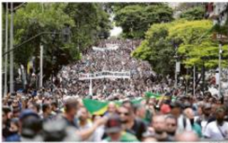
SERVIDORES DA ÁREA DE SEGURANÇA PROTESTAM CONTRA GESTÃO ZENHA EM BELO HORIZONTE

O presidente russo, Vladimir Putin, reconheceu hoje os separatistas na Ucrânia e anunciou o envio de tropas de apoio. A União Europeia e os Estados Unidos consideram a ação ilegal e dizem que isso aproxima a região da guerra.