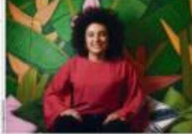
O empresário que se tornou o novo líder do setor de tecnologia em São Paulo, o empresário que se tornou o novo líder do setor de tecnologia em São Paulo.