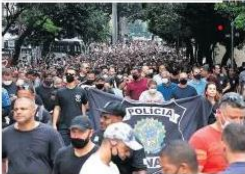
Policiais de MG desafiam governador e anunciam greve A greve dos policiais de segurança pública aprovada por eles em 2019, após o governador romper o acordo de paz, está sendo retomada, com o anúncio de que os policiais não vão trabalhar amanhã.