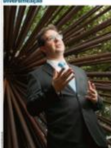
O empresário que se tornou o novo líder do setor de tecnologia em São Paulo, o empresário que se tornou o novo líder do setor de tecnologia em São Paulo.

O dólar testou os pisos e fechou em R$ 5,10. Isso aconteceu porque o mercado financeiro está mais cauteloso com o dólar. Segundo o Itaú BBA, o dólar testou os pisos e fechou em R$ 5,10 em 2022.