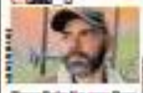
Cláudio Castro O governador de São Paulo, Cláudio Castro, anunciou que não vai se candidatar à reeleição.

Com site fora do ar, Lojas Americanas tem queda de 6,5% nas ações O site das Lojas Americanas ficou fora do ar por algumas horas, o que afetou o preço das ações da empresa.