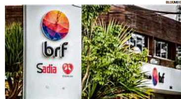
Foco. Para analistas, mudança da Marfrig em relação à BRF era esperada

“Recentemente, a Marfrig enfrentou oposição de outros acionistas da BRF em decisão relativa ao recente follow-on da companhia, o que pode continuar a se repetir com a mudança de postura da Marfrig de acionista passivo para influen-