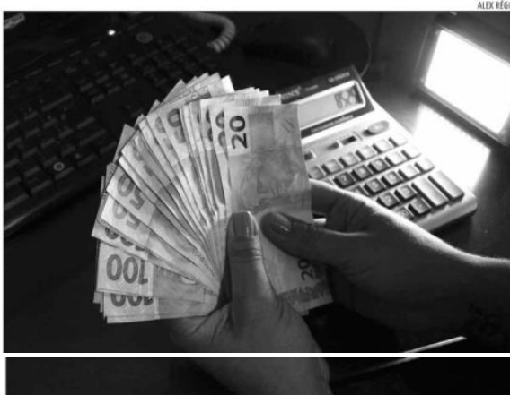
A dívida consolidada do RN cresceu 20,4% no comparativo com o montante verificado em 2020

Em termos absolutos, os maiores superávits primários