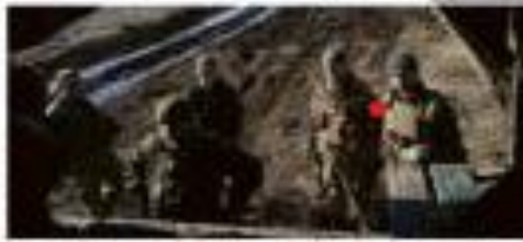
Imagem: Soldados russos em uma operação militar na Ucrânia.

Uma decisão que levou de imediato a condições propícias para o conflito armado. O presidente russo, Vladimir Putin, anunciou em um discurso que enviou tropas para a Ucrânia. O anúncio ocorreu em um momento de alta tensão diplomática entre os dois países. Putin afirmou que as tropas foram enviadas para proteger os russos na região e para garantir a segurança das fronteiras da Rússia. Ele também acusou a Ucrânia de violar o direito internacional e de cometer crimes de guerra. A decisão de Putin foi recebida com choque e condenação por muitos países e organizações internacionais, incluindo a Organização para a Segurança e Cooperação na Europa (OSCE) e a Organização das Nações Unidas (ONU).