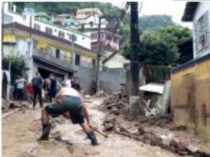
Tragédia na Vila de Jansen, perto de Natal, durante de uma destruição, pessoas desamparadas e prejudicadas

ontem, era um duro opositor ao governo popular do governador Fátima. Não foi diferente em outros tempos, seu histórico de atuação política é de traíção", critica.