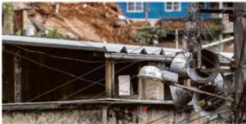
Uma estrutura de improvisação e madeira que está sendo usada para abrigar pessoas em situação de vulnerabilidade em Petrópolis.

Fachin também criticou as acusações de fraude em produção de cloroquina, afirmando que não acredita nelas. Ele disse que se mantém aberto a qualquer investigação que possa esclarecer os fatos.