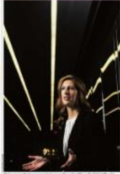
Uma mulher em um ambiente moderno, possivelmente um escritório ou espaço de trabalho.