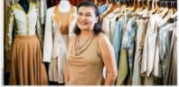
Uma mulher em uma loja de roupas, com várias peças de vestuário visíveis no fundo.