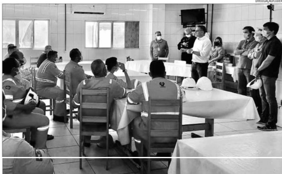
Representantes do Consórcio Intersal fizeram visita ao Tersab na última quarta-feira para acompanhar as obras em andamento

Ao todo, segundo a Codern, são 107 empregados nas funções de Auxiliar Portuário, Técnico Portuário e Analista Portuário. Os que tiverem adquirido no decorrer do tempo novas habilidades e capacitações poderão assumir outras funções.