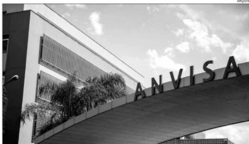
avaliação do pedido de registro pela Agência Nacional de Vigilância Sanitária levou 16 dias

Entre os requisitos, estão a usabilidade e o gerenciamento de risco, que servem para adequar o produto ao uso por pessoas leigas para garantir a maior segurança e eficácia do teste. As orientações com relação ao pro-