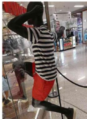
Manequim preto simula quebra de vitrine; Reserva diz repudiar racismo e que ação visava promover liquidação.