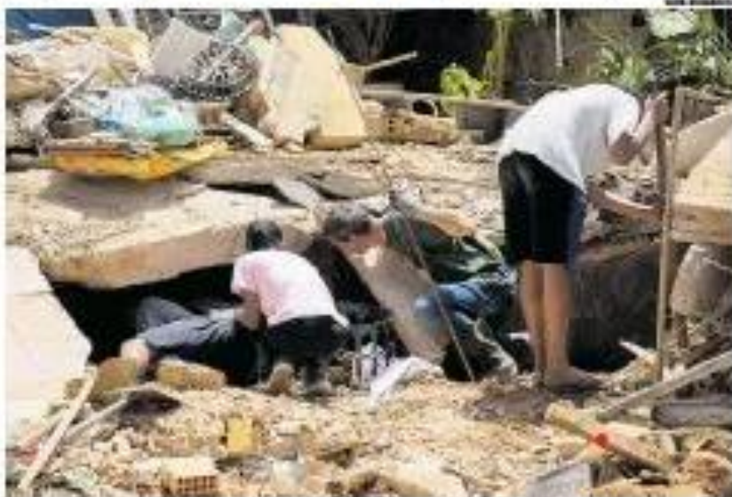
Desastrosos deslizamentos de terra em Serrana, em 2011, deixaram milhares de pessoas mortas e milhares de casas destruídas

Recursos foram reservados há 11 anos, após morte de 918 pessoas