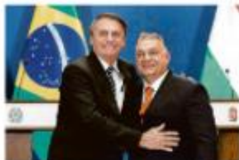
BOLSONARO USA LEGIA PARZITA E COME OMBRÃO NA BRENDEIA

Quilô 49 Capital paulista ganha 500 mil do luxo com bolsonaristas e faz-se de iluz