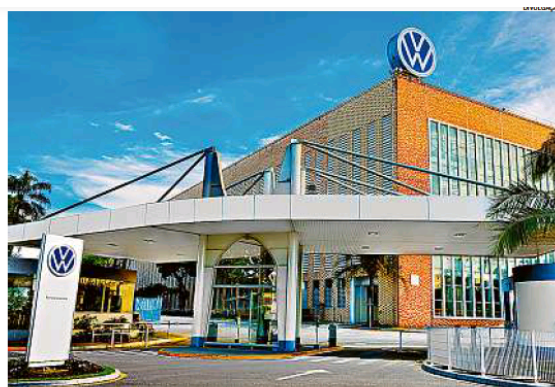
Fábrica em São Bernardo do Campo. Sindicato ressalta que problemas do setor com os chips não acabaram

Houve recuo também em comparação com os números de dezembro, quando