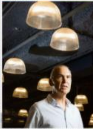
Iluminação sustentável: luzes modernas e sustentáveis para ambientes modernos.