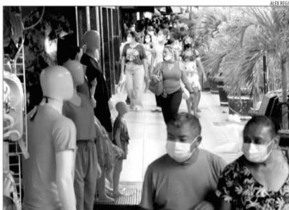
Em janeiro, os setores produtivos efetivaram uma média de 1,03 milhão de operações de vendas por dia

Dentre os setores analisados, ainda na comparação entre janeiro/2021 e janeiro/2022, destacaram-se: o comércio de combustíveis, com crescimento de 19,35%; a atividade de energia elétrica, com crescimento de 14,08%; o setor de indústria de transformação, com crescimento de 12% e o setor de comércio atacadista, com crescimento de 4,27%. Entre os que apresentaram quedas, a SET cita: o setor de comércio varejista