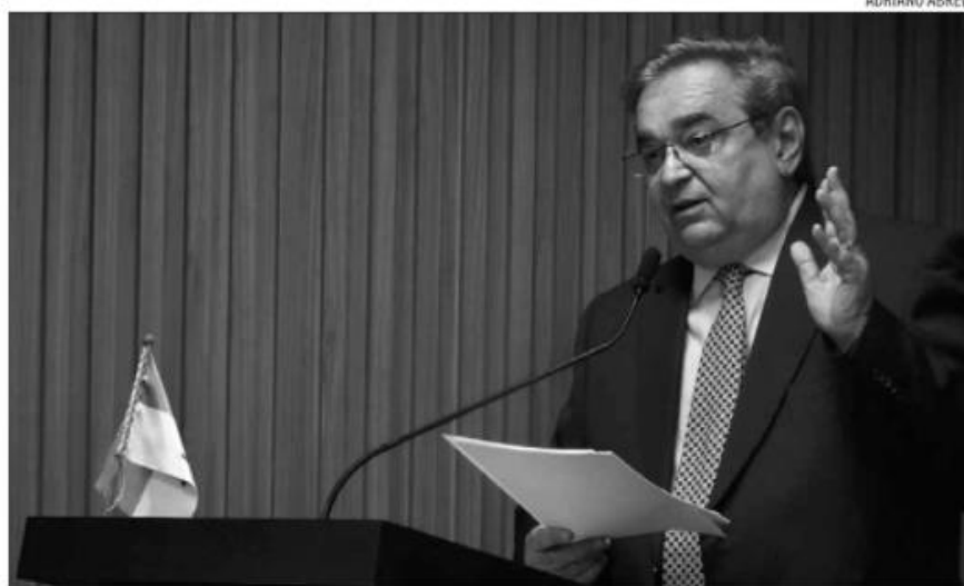
Prefeito Álvaro Dias destaca plano com as principais obras que pretende executar

Álvaro Dias enfatizou ações em andamento e as que estão por se realizar no município. Ele detalhou, principalmente, o esforço feito para conter as implicações da pandemia de covid-19 em 2021. Segundo o prefeito, já foram aplicadas mais de 1,6 milhões de doses de vacinas contra a Covid em Natal. "Isso significa dizer que chegamos a 92% da população acima de 12 anos com ao menos uma dose, mais de 83% com duas doses e 43% do público alvo já tomou a dose de reforço", informou ele, que acrescentou: "são dados que mostram como a população aderiu à vacinação. Para tanto, investimos substancialmente em