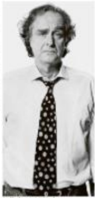
Antônio Carlos Jabor em 1991.

ATMOSFERA O clima está quente e seco, com temperaturas altas e baixa umidade.