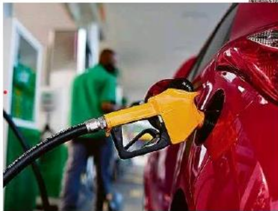
Impacto. Jean Paul Prates diz que gasolina afeta não só os os de automóveis como também atividades comerciais

Depois de apresentar seu parecer, Prates afirmou que a proposta de emenda à Constituição (PEC) dos Combustíveis está em stand-by e pode até tramitar nas comissões da Casa, mas não é prioridade no momento.