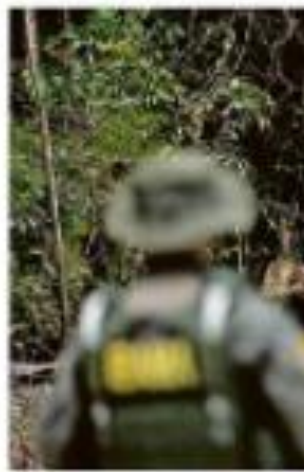
Atividade de fiscalização no Parque Estadual do Rio Negro, em Manaus.