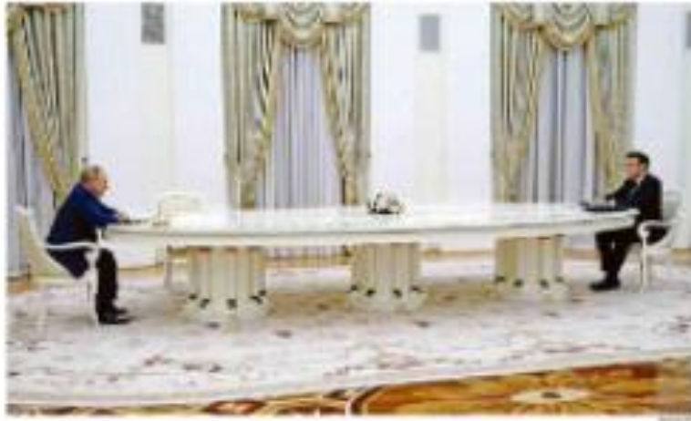
PUTIN E MAIOR MEGALOMANÍACO CIENTISTA UCRÂNIA

Manifestando uma convicção com o presidente russo Vladimir Putin e o maior cientista ucraniano, o físico nuclear e engenheiro nuclear russo, Vladimir Putin, em uma reunião com o presidente ucraniano, Petro Poroshenko.