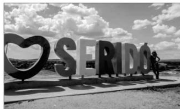
Os geossítios da região do Seridó são únicos no mundo

O sexto episódio da websérie Bora Veranear aprofundará ainda mais sua viagem pelo sertão potiguar, chegando a uma área altamente privilegiada: o Geoparque Seridó. Esse território, que compreende seis municípios da região, oferece exemplares únicos da geodiversidade nordestina, tendo importância ambiental, turística, econômica e cultural. A primeira etapa da aventura passa por Lagoa Nova e Currais Novos. O EP vai ao ar nesta terça, no Youtube, via TN Play.