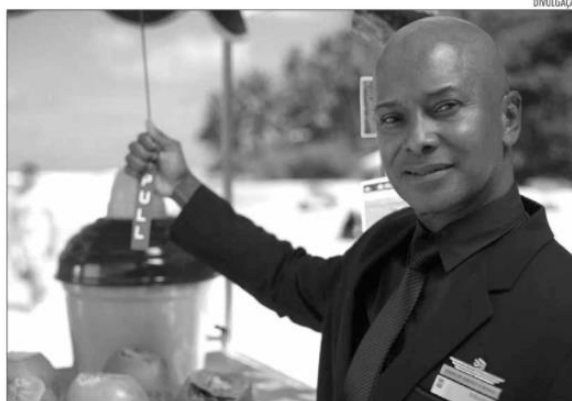
Com 5m43, vídeo traz colaboradores da Latam para o cenário de cinco destinos, entre eles, Pipa

Para apresentar com naturalidade as peculiaridades da região, a produção procurou destacar elementos característicos como figurino, cultura, morado