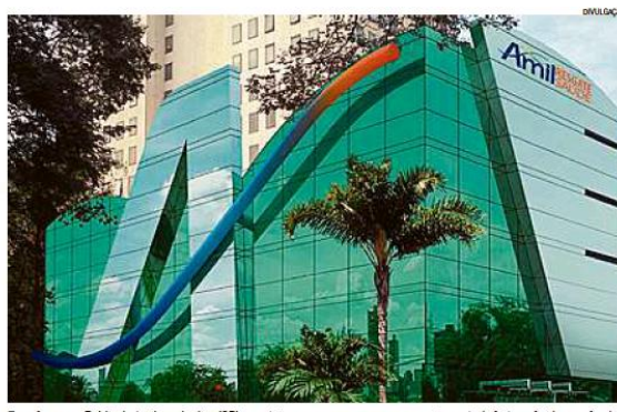
Fora do grupo. Prédio da Amil nos Jardins (SP); a carteira passou para uma empresa cujo controle foi transferido para fundo

Já a ANS afirmou, em nota, que a transferência parcial da carteira da Amil para a APS "cumpriu todos os requisitos necessários". E ressaltou que os termos dos contratos dos clientes "continuam os mesmos, apenas mudou a operadora contratada."