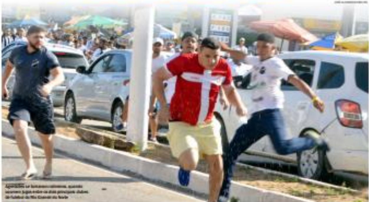
AGORARN - Os torcedores comemoram, quando saem, logo após os gols marcados, jogadores do futebol do Rio Grande do Norte.