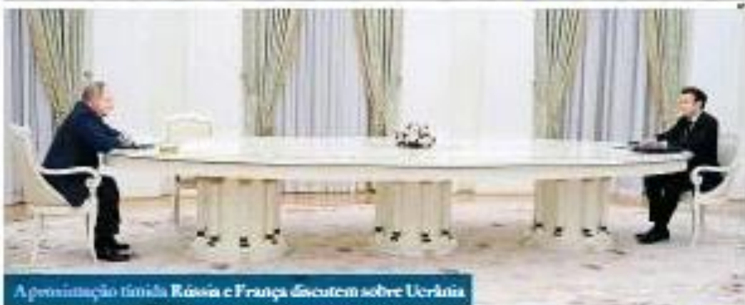
A aproximação tímida Rússia e França discutem sobre Ucrânia