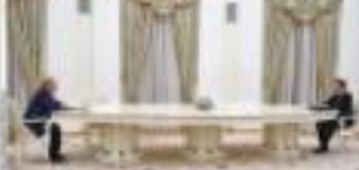
Reunião de trabalho em uma sala de reuniões.