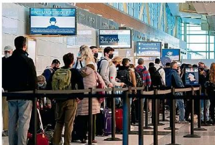
Menos burocracia. Passageiros brasileiros frequentes poderão usar quiosques eletrônicos em vez de entrar na fila de imigração para entrar nos EUA

Segundo o governo americano, o programa "permite agilizar o processamento de passageiros frequentes, de bai-