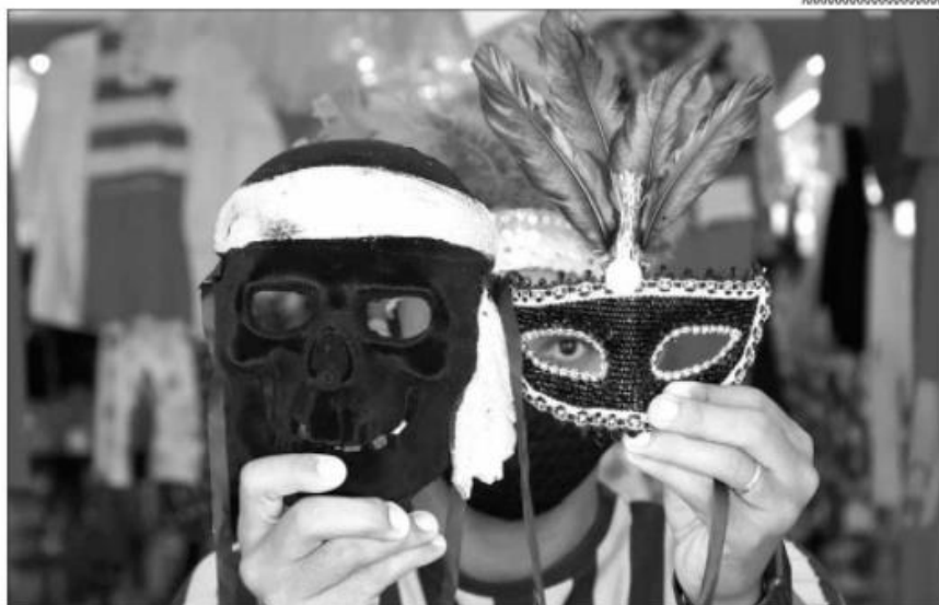
Ambulantes e lojistas precisaram diminuir os investimentos por conta da pandemia de covid

“Estou comprando a mercadoria de forma variada, mas, com certo controle. Ano passado, já fizemos esse controle e faltou produto. Esse ano, nosso foco são as escolas e as casas de praia”, relata. Segundo ela, já existe procura pelos itens, que também estão expostos no Instagram. Dentre os produtos para venda estão, principalmente, os acessórios infantis (adereços para cabelo, asinhas, pistola em água e varinhas mágicas).