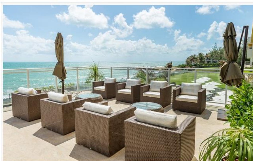
Área de lazer do Barreira Roxa, que fica na Via Costeira de Natal

Pelo terceiro ano seguido, o Hotel-Escola Senac Barreira Roxa (conheça AQUI ) em Natal, que integra o Sistema Fecomércio RN (Federação do Comércio de Bens, Turismo e Serviços do RN), está entre os estabelecimentos consagrados com o Traveller Review Awards (Prêmio de Avaliação de Viajantes). É realizado anualmente pelo Booking, site de buscas e reservas de hospedagens, identificando os hotéis mais bem avaliados nas notas deixadas por hóspedes.