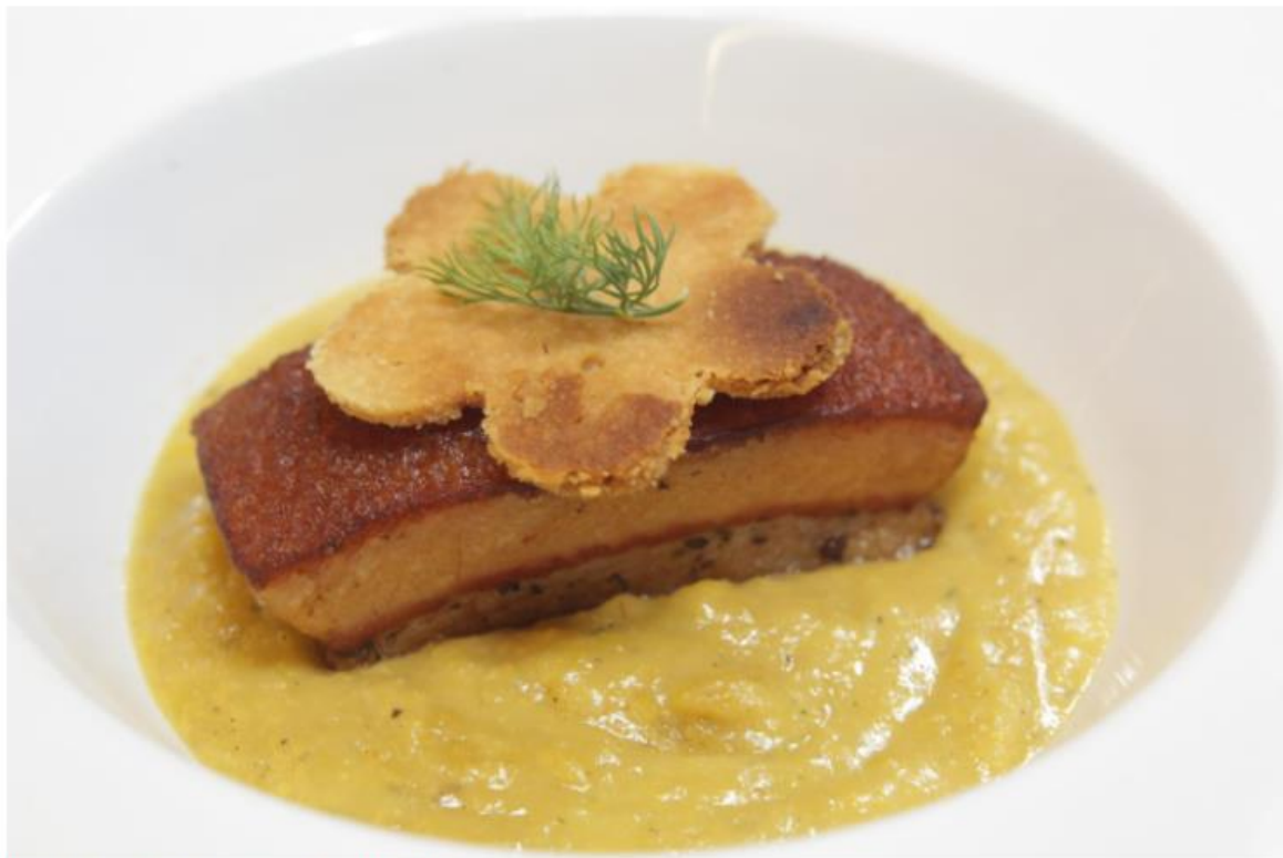
Barriga de porco cozida lentamente com purê de milho