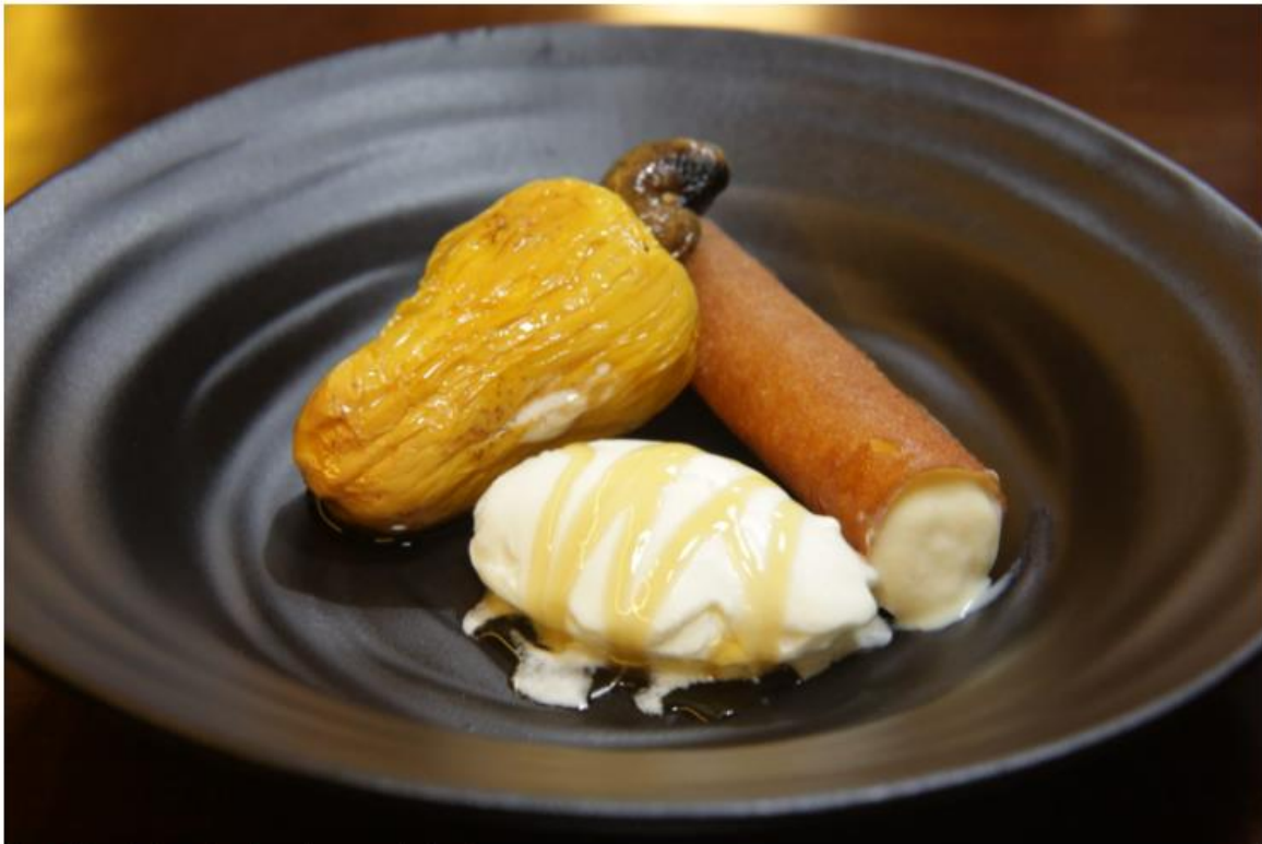
Huramaki de caju tem molho de rapadura e sorvete de caju