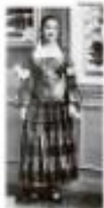
Sua vida, sua história. Sua história, sua vida.

Local - O bairro de São Paulo e o bairro de São Paulo se uniram para organizar o encontro de São Paulo.