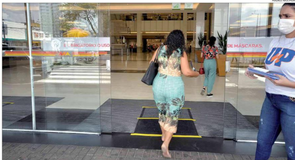
Na manhã desta quinta, os shoppings ainda não cobravam o passaporte vacinal dos visitantes. Prefeitura tem 48 horas para cumprir a decisão judicial

Por serem ambientes abertos com ventilação natural, locais como Praia Shopping, Cidade Jardim e Cidade Verde Shopping continuam sem a obrigação de cumprir a medida. Uma decisão proferida pelo juiz Airton Pinheiro, da 1ª Vara da Fazenda Pública de Natal, na última quinta-feira (27), atendeu pedido liminar determinando a cobrança do passaporte vacinal. Desde então, a medida vinha sido descumprida pela Prefeitura de Natal.