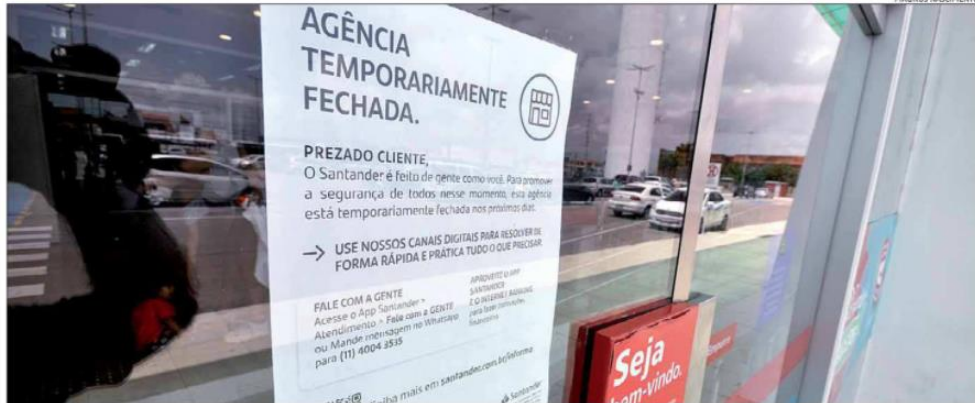
Agência do Banco Santander na zona Norte não abriu na última semana. Sindicato dos Bancários diz que fechamentos têm sido comuns em todo o Estado

Para outras empresas, especialmente as menores, não há opção: o jeito é fechar as portas até a situação se normalizar. Foi o que aconteceu com o ateliê Dorian Oculos, localizado na Cidade Alta. Após a funcionária da loja receber resultado positivo para a covid-19, o estabeleci-