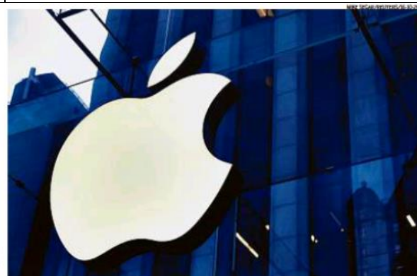
Maçã em alta. Loja da Apple em Manhattan: analistas consideram que empresa ainda tem potencial para valorização

Esses ventos favoráveis ajudaram os investidores a deixarem para trás os riscos potenciais da pandemia, como a falta de chips, que afetou todas as fabricantes de smart-