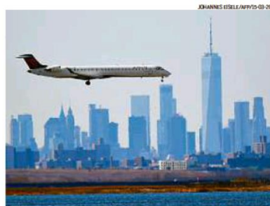
Disputa. Avião se aproxima do aeroporto JFK, em Nova York: 5G na berlinda

Do outro lado, fabricantes de aviões e companhias aéreas alertaram que a nova frequência poderá afetar até 350 mil