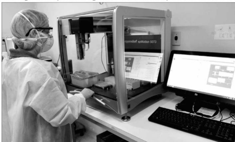
Equipes de vigilância epidemiológica seguem trabalhando no rastreamento dos casos e no monitoramento do cenário em todo o RN