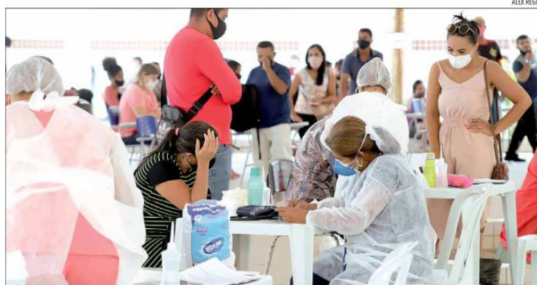
Centro aberto no Cemure, na semana passada, registrou, somente no primeiro dia de funcionamento, 431 atendimentos