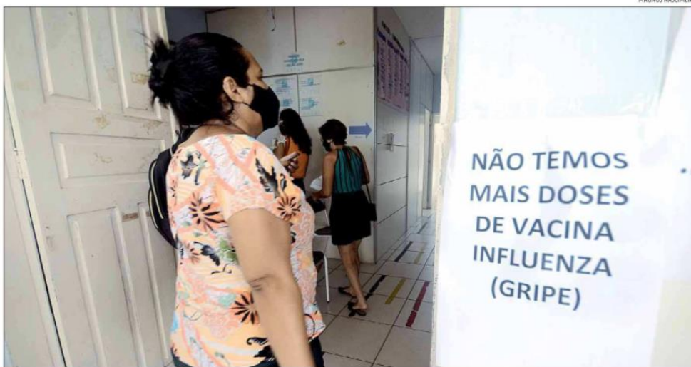
Em Natal, foram aplicadas cerca de 370 mil doses da vacina contra a gripe, recebidas do Ministério da Saúde para a campanha anual de imunização em 2021

Em Natal, a Secretaria Municipal de Saúde (SMS/Natal) informou, por meio de nota, que as últimas doses da vacina vêm sendo aplicadas desde a última quinzena de dezembro