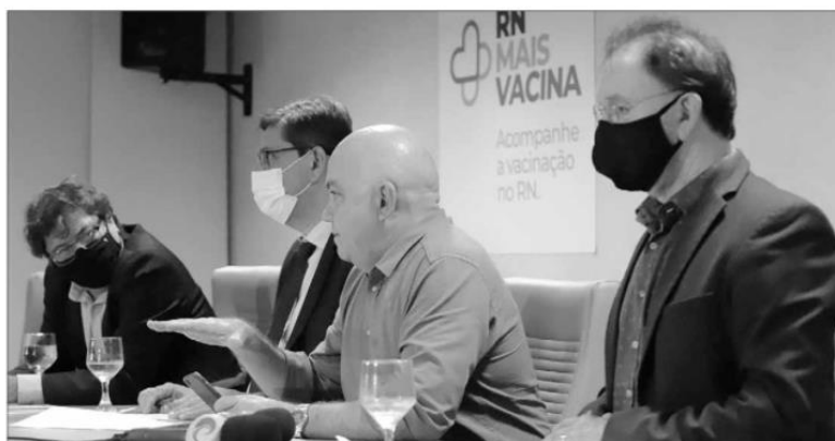
Secretários de Planejamento, do Gabinete Civil, controlador geral e procurador geral do Estado criticaram o relatório final da CPI