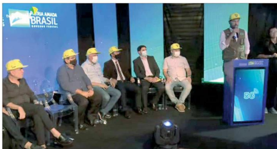
Ministro das Comunicações, Fábio Faria destaca que haverá ganhos de produtividade e conexão muito mais eficiente

Uma das inovações do lançamento piloto é o uso de luminárias dotadas de antenas 5G e instaladas em postes. Elas podem emitir sinais de até 100 metros de raio para cada poste. O projeto é batizado de Conecta5G. Além das conexões entre aparelhos, os instrumentos fazem reconhecimento facial, abrindo o caminho para uma melhor gestão na segurança pública. A lâmpadas das luminárias podem ser controladas a partir de um aplicativo de celular do gestor