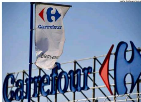
Naberinda. A rede Carrefour suspendeu, na Bélgica, a compra de uma marca de charque que tem joint venture com a JBS

Em nota, a JBS afirmou que "não aprova nenhum tipo de desrespeito ao meio ambiente, às comunidades indígenas ou à legislação brasileira". E acrescentou que, no momento da compra, todas as propriedades do fornecedor direto já cumpriam os protocolos de abas-