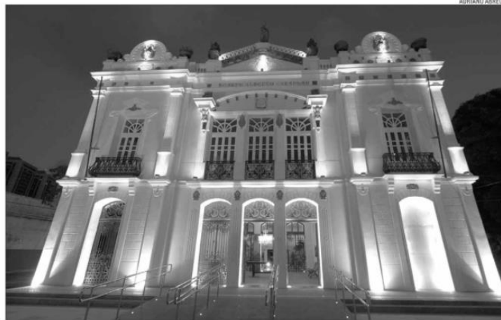
Prédio de 117 anos está sendo entregue com suas características históricas e arquitetônicas originais