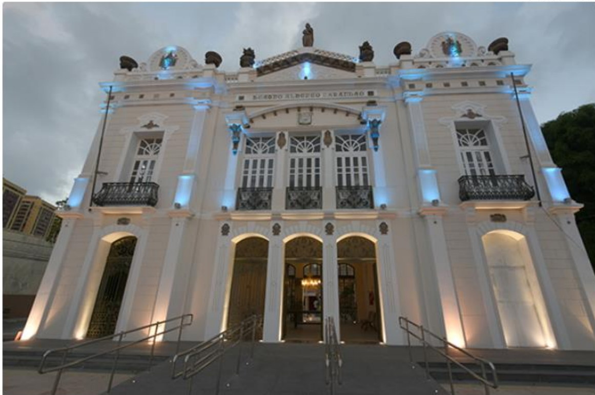
Prédio de 117 anos está sendo entregue com suas características históricas e arquitetônicas originais