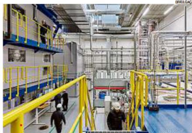
Mais caixa. Petrobras tem vendido ativos e decidiu sair do setor petroquímico

"Como primeiro passo neste sentido, Petrobras e Novonor, em complemento ao pedido já