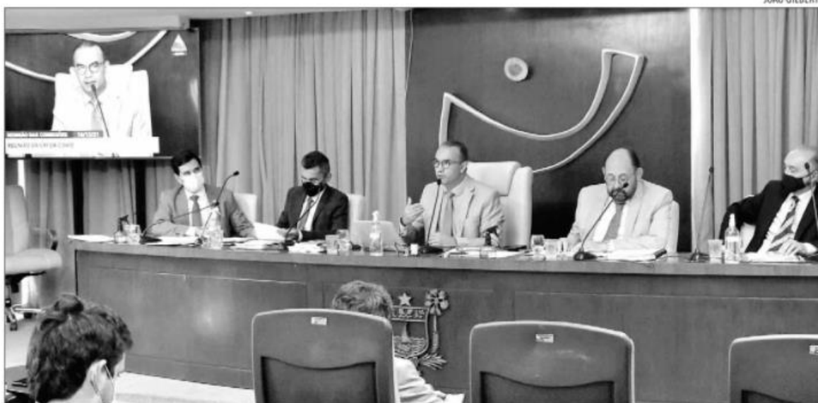
Deputados que integram a Comissão Parlamentar de Inquérito concluem a votação das emendas ao relatório final