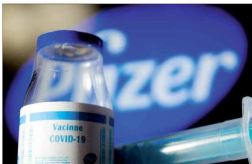
Pfizer informou que o acordo "inclui a possibilidade de versões do imunizante contra variantes"

Isso porque, segundo a Pfizer, o acordo assinado com o Ministério da Saúde em novembro "inclui a possibilidade de fornecimento de versões modificadas do imunizante para variantes (como a Ômicron), que poderão ser eventualmente desenvolvidas caso necessário, e versões para diferentes faixas etárias". O forne-