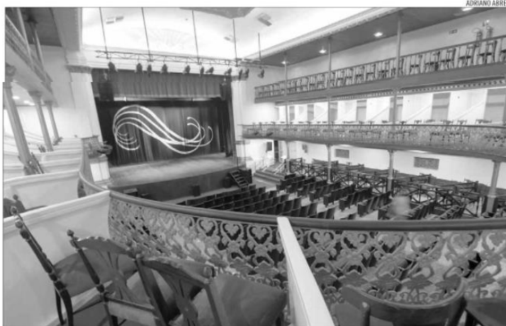
Caixa cênica, o "coração" do teatro, recebeu um moderno sistema de iluminação e sonorização

Depois de seis anos fechado, Teatro Alberto Maranhão será reaberto ao público no próximo domingo (19), com Concerto Especial de Natal da Orquestra Sinfônica do RN. Programação de reabertura vai até dia 23 de dezembro