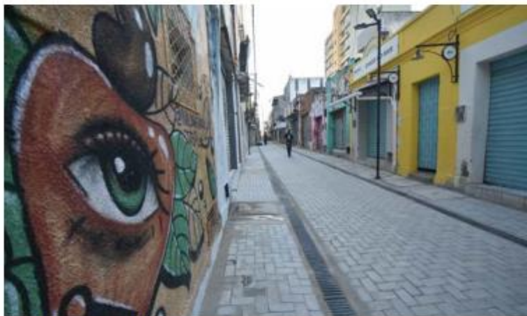
Reduto cultural de Natal, Beco da Lama ganha novo visual

A restauração do Beco da Lama teve investimento do próprio município na ordem de R$ 701.175,04, por meio da Secretaria de Mobilidade Urbana (STTU) como parte do projeto de melhoria do Centro Histórico de Natal.