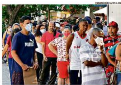
Espera. Filas em busca de informação na Caixa sobre o recebimento do Auxílio

O texto da MP, que será publicado ainda nesta semana, vai permitir que o Ministério da Cidadania use os recursos remanescentes do Bolsa Família para garantir o valor mais robusto aos beneficiários do novo programa social. A nova MP vai permitir uma parcela complementar aos R$ 220, fazendo com que o valor chegue a R$ 400. Esse mesmo instrumento será usado para o valor de R$ 400 no ano que vem.