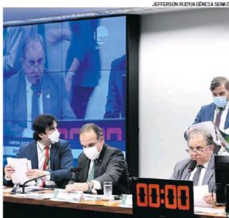
Reunião de Comissão do Orçamento; Rosa Weber pede transparência

PRAZO. Agora, a nova decisão de Rosa passará pelo crivo do plenário da Corte, em data a ser definida pelo presidente do STF, Luiz Fux. Apesar de ter atendido ao pedido do Congresso, a magistrada destacou ser necessário dar publicidade aos documentos utilizados na distribuição de recursos das emendas em 2020 e 2021 e