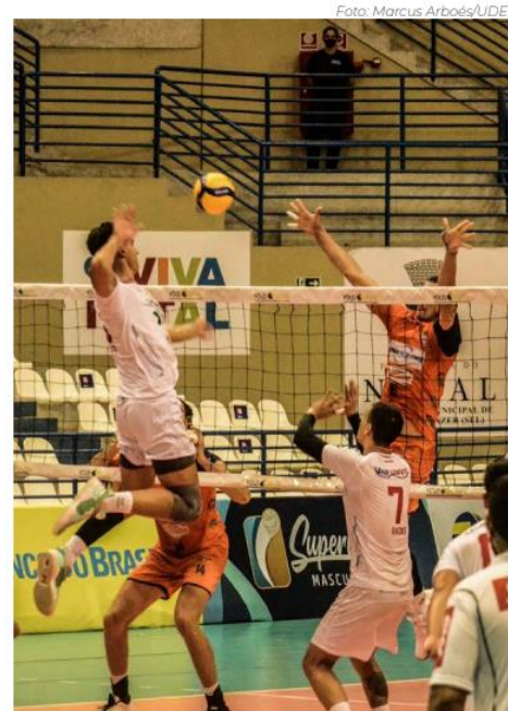
Torneio internacional conta com participação de seis equipes

- Sada Cruzeiro (BRA) - Campeão Sul-Americano 2019/20 - Trentino Itas (ITA) - Vice-campeão da Champions League 2020/21 - Sirjan Foolad (IRI) - Campeão Asiático 2020/21