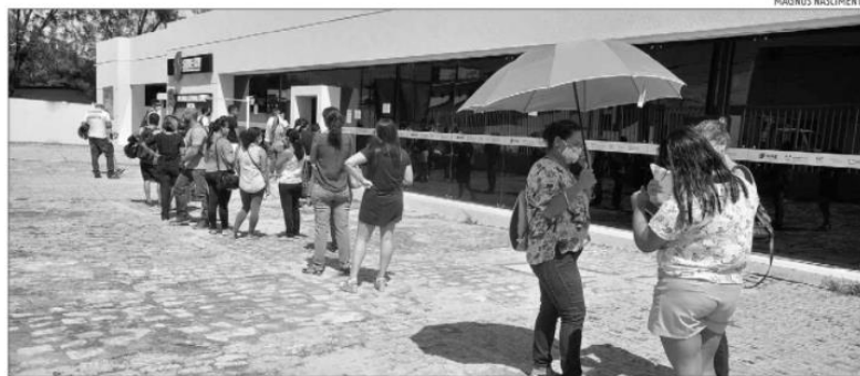
RN tem a oitava maior taxa de desocupação do País. De julho a setembro de 2021, havia 256 mil pessoas desalentadas ou indisponíveis

A Pnad Contínua considera como desocupada a pessoa que estava sem trabalho e que tomou alguma providência para conseguir emprego, como: entregar currículo, atender a entrevistas de emprego, inscrever-se em concurso, entre outras atitudes. Essas pessoas estavam disponíveis para assumir o posto de trabalho naquela semana caso o ti-