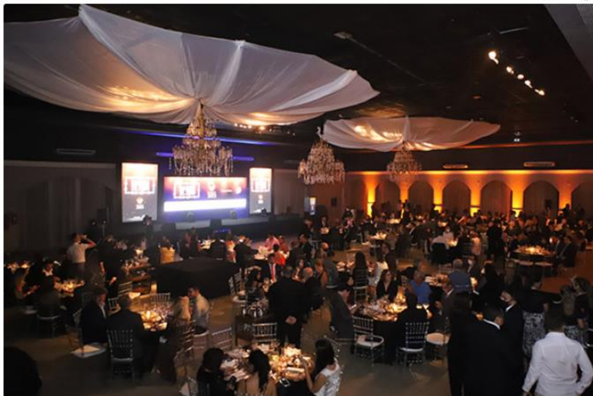
Festa, no Olimpo, reuniu empresários, publicitários e jornalistas

A Revista Top Natal 2021 tem como patrocinadores a Federação do Comércio de Bens, Serviços e Turismo do Rio Grande do Norte ( Fecomércio RN), Serviço Brasileiro de Apoio às Micro e Pequenas Empresas no Rio Grande do Norte (Sebrae/RN), Prefeitura do Natal, Assembleia Legislativa do Rio Grande do Norte (ALRN), Federação das Indústrias do Estado do Rio Grande do Norte (Fiern), Governo do Rio Grande do Norte, Sistema de Cooperativas Financeiras do Brasil (Sicoob) e Câmara Municipal de Natal.