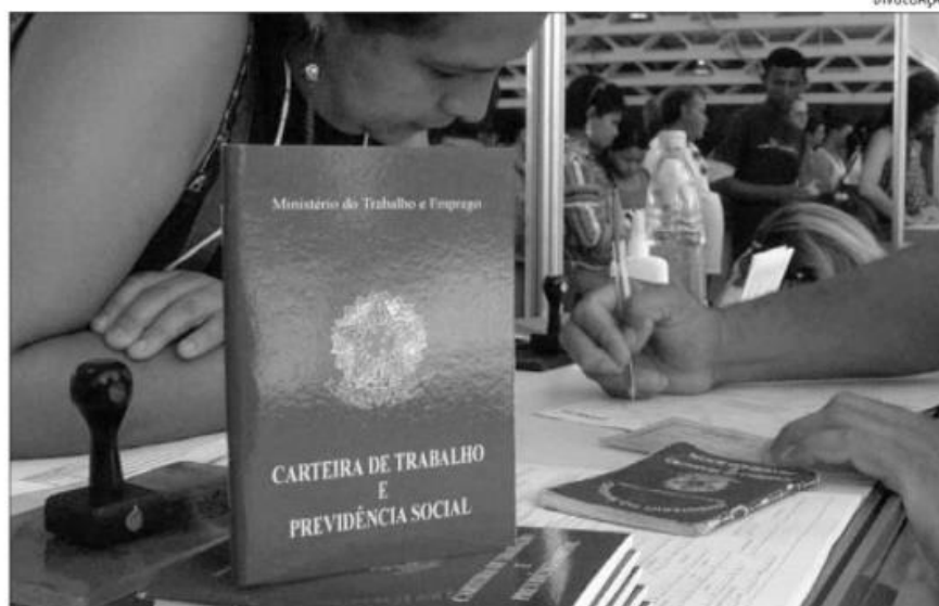
No acumulado deste ano, o Estado registrou 30.700 admissões a mais que desligamentos

No acumulado do ano, o resultado anima com 30.700 admissões a mais que os desligamentos. No mesmo período de 2020, o saldo foi de 5.327 desligamentos a mais do que contratações. Neste sentido, representantes dos setores produtivos garantem que o resultado é animador e dizem que a oscilação entre os meses, mantendo o saldo positivo, é normal.