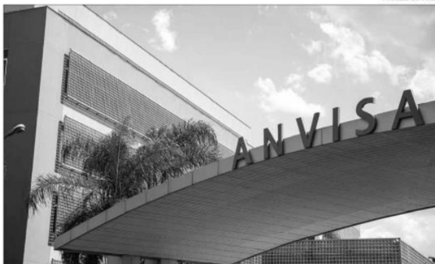
Agência disse que testagem foi feita em duas pessoas com passagem pela África do Sul

Segundo a Anvisa, a testagem foi feita em um passageiro vindo da África do Sul, que desembarcou em Guarulhos no último dia 23. Ele estava com exame RT-PCR negativo e, antes de retornar ao continente africano, realizou ao lado de sua esposa nova testagem. Esta segunda verificação, feita no dia 25, também de RT-PCR, testou positivo para ambos e o fato foi comunicado ao Centro de Informações Estratégicas em Vigilância em Saúde (CIEVS) de São Paulo.