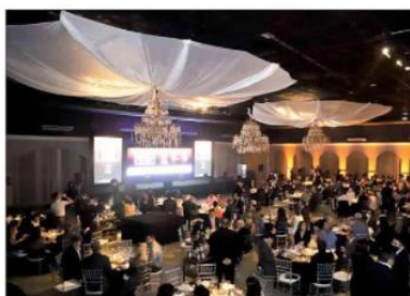
Festa, no Olimpo, reuniu empresários, publicitários e jornalistas

primeira vez, pelo renomado Instituto de Pesquisas Sociais, Políticas e Econômicas (Ipespe), com sede em Recife (PE), que aplicou 600 entrevistas com consumidores nas quatro zonas administrativas de Natal, das classes sociais A, B C e D. "Os resultados evidenciam a força de marcas locais em diversas categorias, inclusive sendo uma delas a Top dos Tops com o maior percentual de lembrança entre todas as citadas no levantamento chegando a 75% das men-