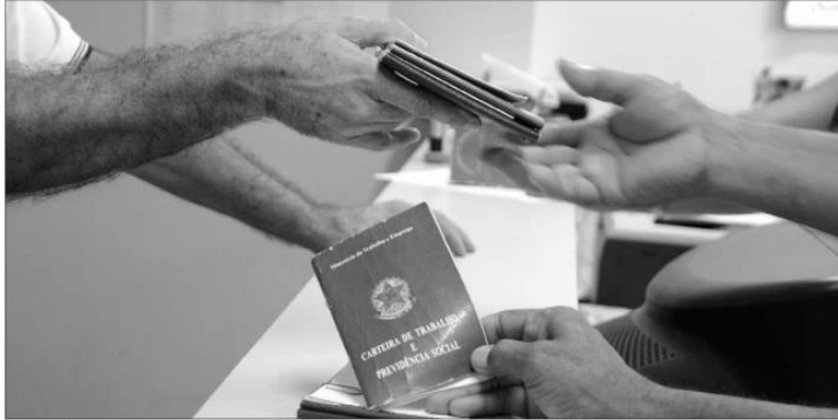
Em agosto, as empresas potiguares fizeram 19.127 admissões com carteira assinada e 11.654 demissões, de acordo com o Caged

O mercado de trabalho formal no Rio Grande do Norte acelerou em agosto e, pelo oitavo mês seguido, registrou um saldo positivo. Foram criadas em agosto, 7.473 vagas com carteiras assinadas, de acordo com os dados do Cadastro Geral de Empregados e Desempregados (Caged) divulgados nesta quarta-feira pelo Ministério do Trabalho. Esse quantitativo é 75,46% maior que o saldo líquido registrado em julho deste ano, na série com ajuste (4.259). Já ante agosto de 2019, antes da pandemia do novo coronavírus, quando foram criadas 3.951 vagas, o saldo foi maior em 89,14%. O resultado do mês passado decorreu de 19.127 admissões e 11.654 demissões.