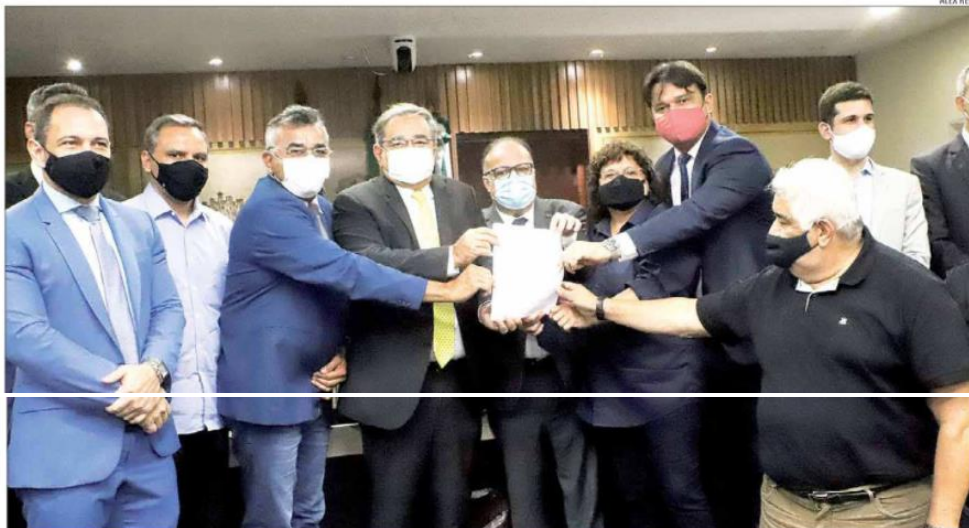
Proposta do Novo Plano Diretor de Natal foi entregue ontem na Câmara Municipal. Concentração de construções nos espaços será baseada na estrutura da cidade

De acordo com a minuta completa, que contém as propostas aprovadas na conferência final do Plano Diretor, "enquanto não forem regulamentadas, para efeito dos usos e ocupação, nas ZPAs 6, 7, 8, 9 e 10, ficam temporariamente instituídas, como referência, as regras contidas nos processos de regulamentação em tramitação