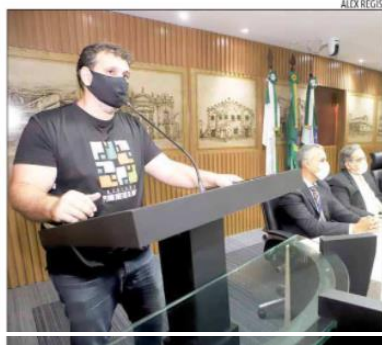
Semurb propõe autorregulamentação de zonas ambientais

no Concidade/Natal e/ou em suas Câmaras Técnicas".