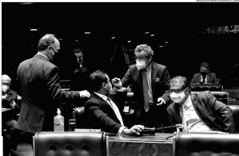
Senadores conversam, em plenário, sobre o Projeto de Lei em votação que muda a Lei Improbidade Administrativa

Com as mudanças aprovadas ontem o Senado restringiu os casos que podem gerar punição por violação aos princípios da administração pública. A chamada "carteirada" de agentes públicos, desrespeitos à Lei de Acesso à Informação e até mesmo "furar a fila" da vacina não poderão mais ser enquadrados na Lei de Improbidade.