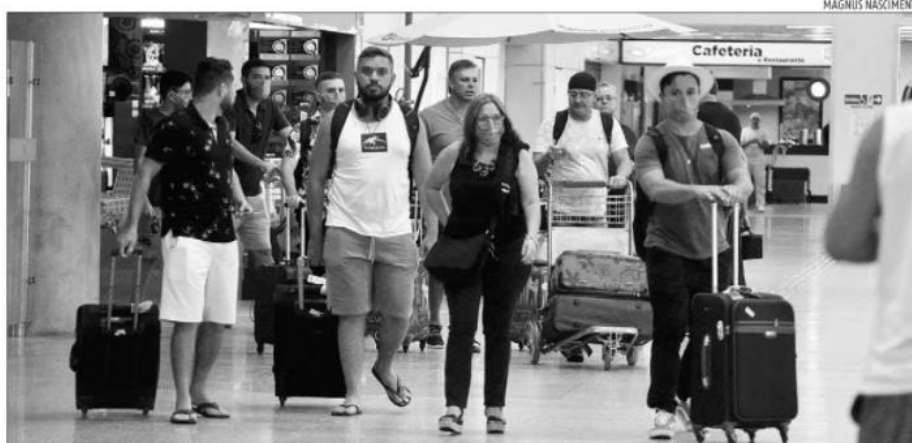
Previsão para dezembro deste ano, segundo a Emprotur, é de 27 chegadas diárias, com aumento em relação a outubro e novembro

«VOOS» Expectativa é de 1.688 voos em dezembro entre embarques e desembarques, com oferta de 287 mil assentos (21% mais que em dez/2019)