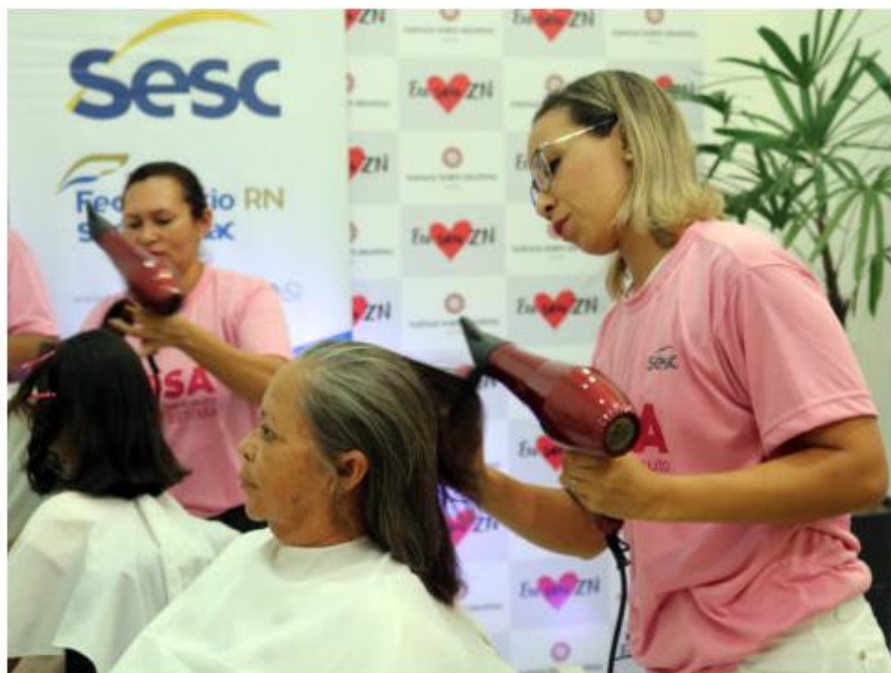
Campanha Outubro Rosa volta a ser protagonista no Sesc RN.

Postado às 18h09 • Cidade • Destaque • Nenhum comentário