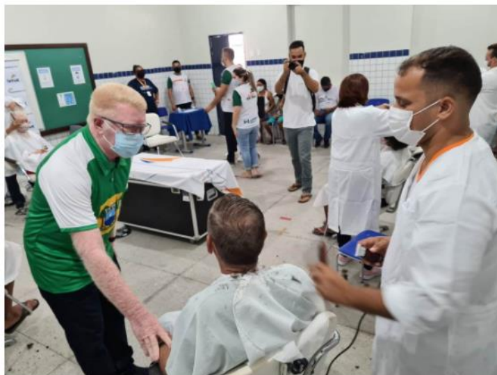
A iniciativa aconteceu neste sábado (25) e contou com mais de 1.000 atendimentos à população.