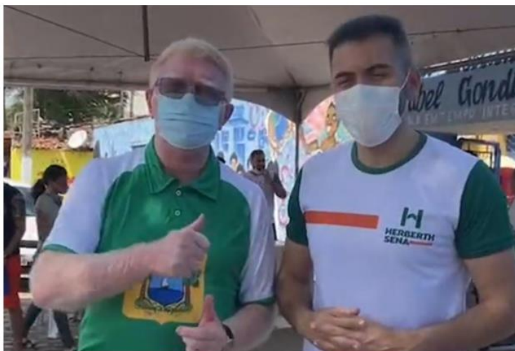
Ubaldo Fernandes e Herberth Sena.

O deputado Ubaldo Fernandes e o vereador de Natal, Herberth Sena, realizaram a “Ação do Bem” no bairro das Rocas. A iniciativa aconteceu no sábado (25), na Escola Estadual Isabel Gondim, e contou com mais de mil atendimentos à população.