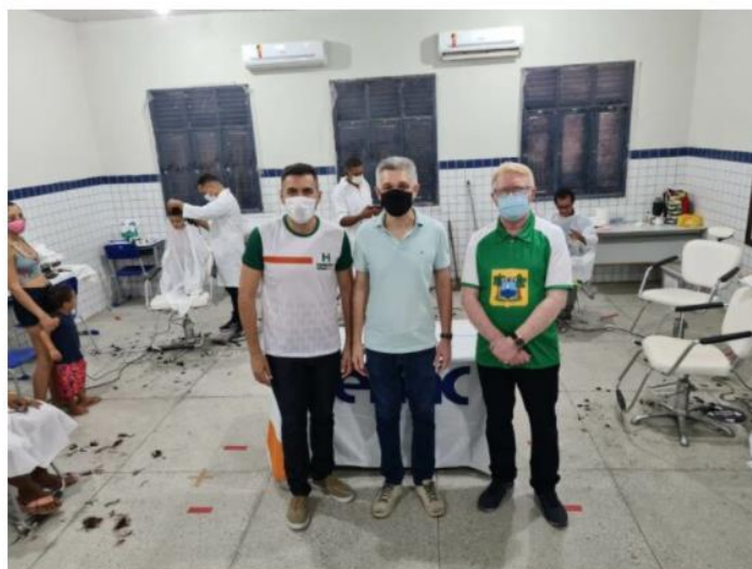
A iniciativa aconteceu neste sábado (25) e contou com mais de 1.000 atendimentos à população.

Por Da Redação - 25 de setembro de 2021 - 20h57