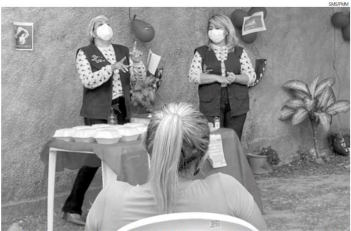
Serão 912 mamografias para mulheres com idades entre 50 e 69 anos, e outros 912 preventivos para público entre 25 e 64

O câncer de mama representa 29,7% da incidência da doença entre as mulheres e também lidera os índices de mortalidade de localização primária, segundo dados do Instituto Nacional do Câncer (INCA) e Ministério da Saúde.