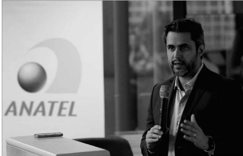
Presidente da Anatel, Leonardo de Moraes, diz que o documento oficial do edital deve ser publicado até a próxima segunda-feira, 27

« TECNOLOGIA » Licitação será a maior na área de telecomunicações do País e deverá movimentar R$ 49,7 bilhões. Segundo o texto, a nova rede móvel poderá ser ativada nas capitais até julho de 2022