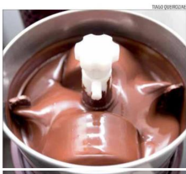
Equipamento 'mélanger' é usado por pequenos chocolateiros

atrás e hoje tem o pódio disputado ano a ano com o Pará, é o mais usado pelos empreendedores da pesquisa: 73% (na média geral entre negócios bean e tree to bar), enquanto 25% usam cacau do Pará e 22%, do Espírito Santo (resposta múltipla).