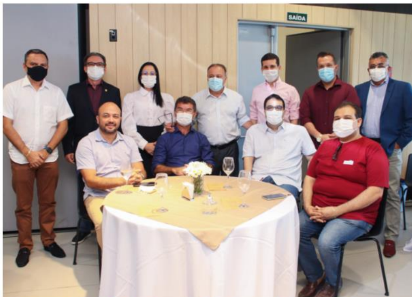
Sistema Fecomércio RN, Sesc e Senac detalha trabalho desenvolvido aos vereadores de Natal.

Em evento realizado hoje (24), no Hotel-Escola Senac Barreira Roxa, vereadores de Natal puderam conhecer detalhes do trabalho realizado pelo Sistema Fecomércio RN na capital potiguar.