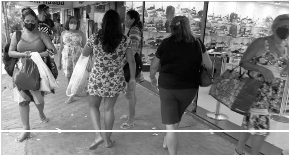
Levantamento da Confederação também aponta um crescimento de 3,8% nas vendas natalinas neste final de ano, em relação ao mesmo período do ano passado

Salário médio cresce Cálculos da CNC apontam que o salário médio de admissão para as vagas temporárias