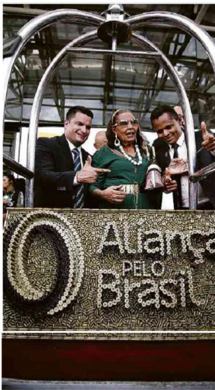
Apoiadores posam para fotos com obra, feita de balas, com o nome do partido Aliança pelo Brasil.

Na lista de partidos na fila do TSE, nenhum chama mais a atenção do que o Aliança Pelo Brasil, que foi proposto pelo próprio presidente Jair Bolsonaro, em 2019. Embora o projeto tenha sido abandonado por ele, permanece tendo assinaturas coletadas, sobretudo em eventos da direita.