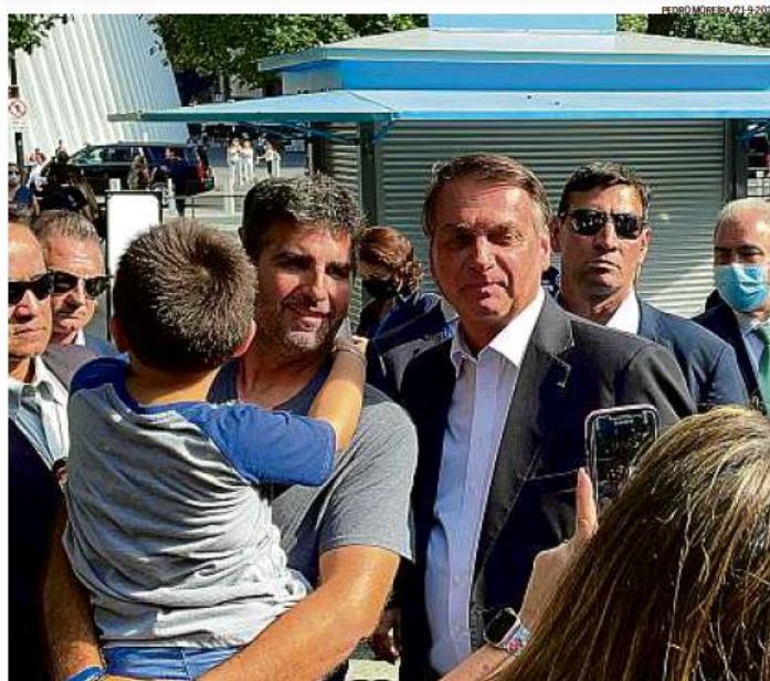
Sem máscara. Bolsonaro posa para foto com apoiador em Nova York, durante visita ao Memorial do 11 de Setembro

de Bolsonaro para celebrar o marco dos mil dias, na terça ele participará da inauguração de trechos que somam dez quilômetros de asfalto na Bahia: 5,4 km de duplicação da BR 116 e 5 km da BR-101, em Teixeira de Freitas, além da liberação de títulos do Instituto Nacional de Colonização e Reforma Agrária (Incra) e da entrega de equipamentos para um centro de iniciação ao esporte.