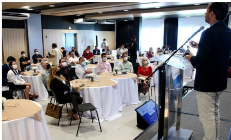
Reunião foi na última sexta.

Os vereadores de Natal participaram, na última sexta-feira (24), de um encontro com representantes da Federação do Comércio de Bens, Serviços e Turismo (Fecomércio/RN) para conhecer o trabalho da entidade na capital potiguar, visando futuras parcerias.