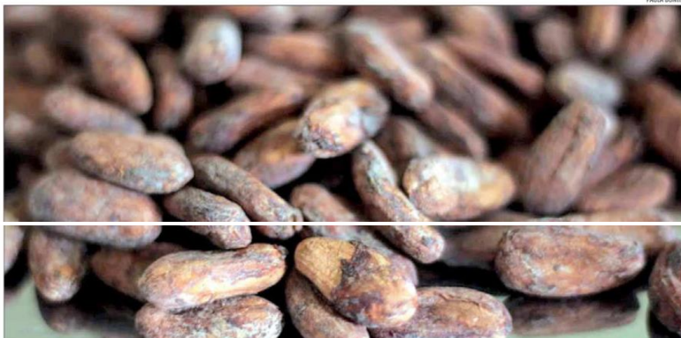
No caso dos negócios bean to bar (do grão à barra), o empreendedor produz o chocolate a partir da amêndoa de cacau e tem controle sobre a origem da matéria-prima

As sedes das empresas de chocolate bean to bar se concentram na maior parte em São Paulo (24%) e na Bahia (19%). Quando o recorte é só sobre as marcas tree to bar, a Bahia reúne 52% desse tipo de negócio (21% estão no Espírito Santo e 12% estão no Pará, dois outros principais Estados produtores de cacau no Brasil). O cacau da Bahia, que liderou a produção de cacau no País até pouco tempo