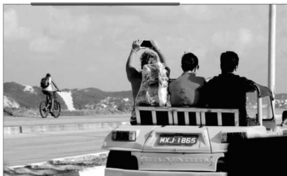
No acumulado do ano, de janeiro a julho, houve crescimento de 2,9% no faturamento do turismo

A atividade mais impactada pela retração segue sendo o transporte aéreo, que, na comparação com o mesmo mês do ano pré-pandemia, registrou queda de 44,8%. Como a vacinação não atingiu um percentual adequado para redução total das restrições, o que implica menos viagens, em julho, especificamente, apesar do período de férias, a oferta de as-