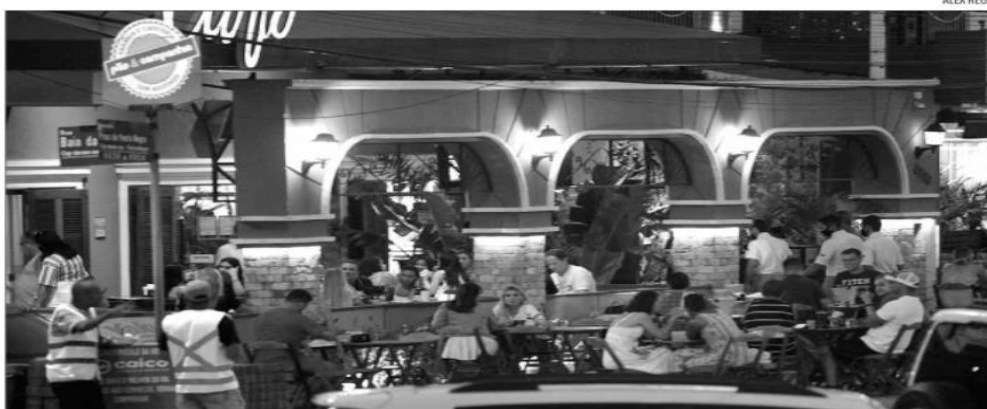
Associação de Bares e Restaurantes considera que medida pode atrapalhar recuperação. Para hoteleiros, não haverá dificuldades