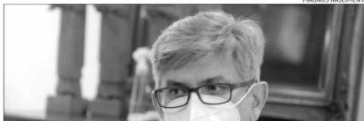
Leitos de UTI chegaram aos mais baixos níveis de ocupação desde o início da pandemia