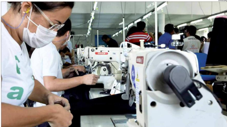
Atualmente, mais de 80 oficinas de costura integram o Pró-Sertão e geram cerca de 3 mil empregos diretos em cidades do semiárido do Rio Grande do Norte

Nesta etapa do programa, a prioridade é o treinamento voltado ao uso de materiais como viscosa, malha, tecidos leves e lycra, além da inserção do bordado. O Pró-Sertão foi criado