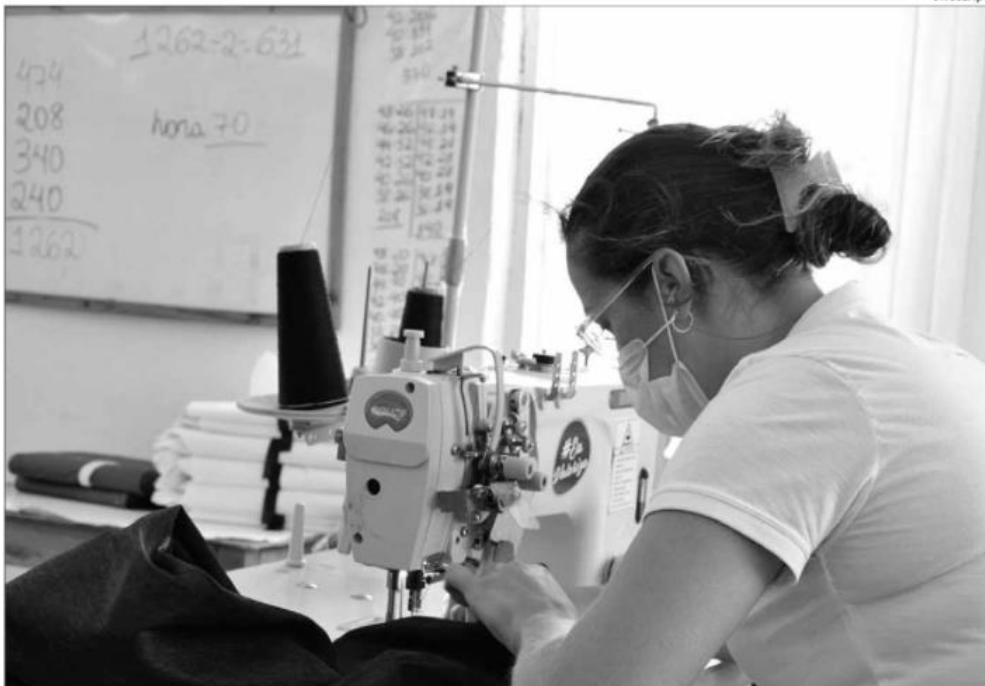
Guararapes encomenda, hoje, às oficinas de costura do Pró-Sertão uma produção de 38 mil peças/dia, segundo a Afase