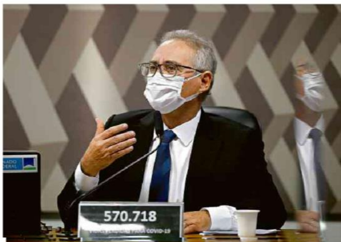
O senador Renan Calheiros (MDB-AL), relator da CPI da Covid. Pedro Ladeira - 18.ago.21/Folhapress

Caso o relatório da CPI aponte que Bolsonaro cometeu crimes de responsabilidade, cabe ao presidente da Câmara dos Deputados, Arthur Lira (PP-