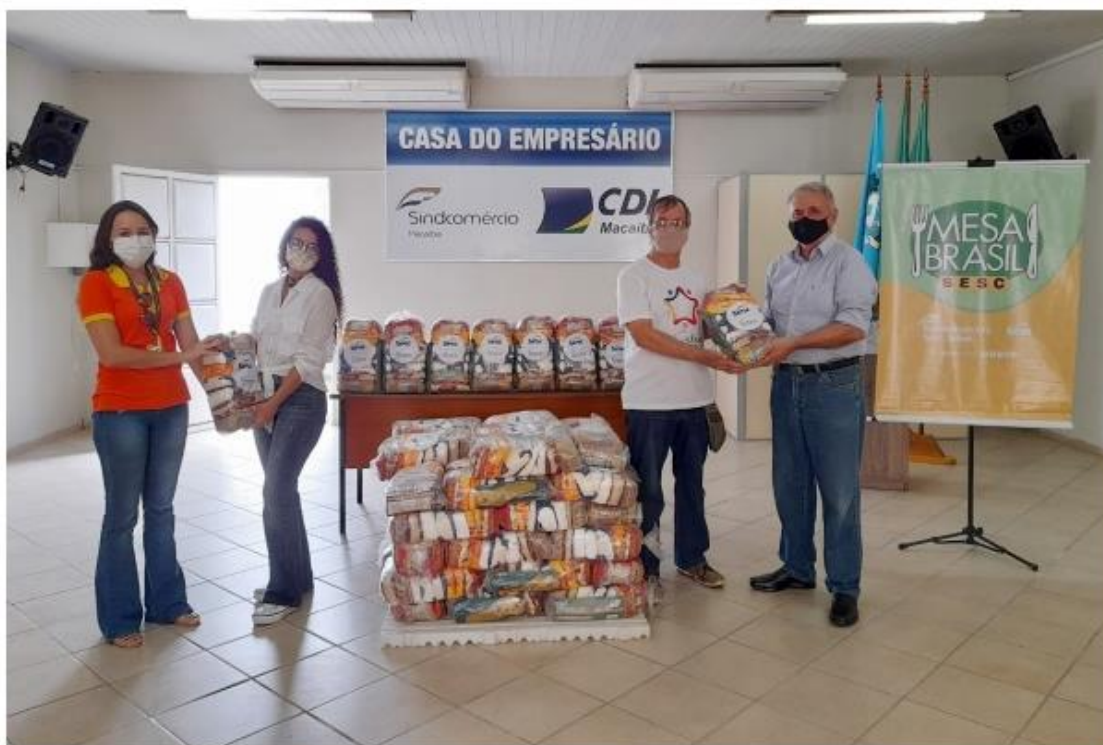
Alimentos foram adquiridos graças a doação ao Programa Mesa Brasil Urgente.

O Serviço Social do Comércio (Sesc RN), instituição do Sistema Fecomércio, deu início nesta semana a distribuição de 12 toneladas de alimentos, convertidos em 1.786 cestas básicas, em oito municípios do Rio Grande do Norte, adquiridos com recursos doados à Campanha Mesa Brasil Urgente, entre julho e agosto deste ano.