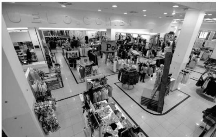
Atualmente, o grupo Guararapes, dono das lojas Riachuelo, é a empresa âncora do programa

O selo é uma estratégia do Sebrae para garantir o cresci-