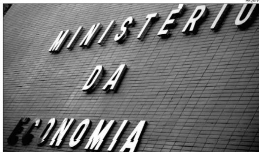
Vinculado ao Ministério da Economia, Secretaria do Tesouro aponta aumento das transferências do SUS

O boletim traz uma análise apartada dos indicadores financeiros das capitais, como o nível de endividamento, que mostra qual percentual da receita corrente líquida (RCL) de um exercício que seria consumido caso toda a dívida consolidada do município fosse paga. O Rio de Janeiro aparece em primeiro lugar como a capital mais endividada, apresentando um índice de 80,1%, seguido por São Paulo, com 74,3%. Na outra