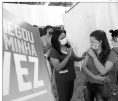
Adolescentes receberão a Pfizer como autorizado pela Anvisa

O baricitinibe é um inibidor seletivo e reversível das enzimas janus quinases (JAKs), em es-