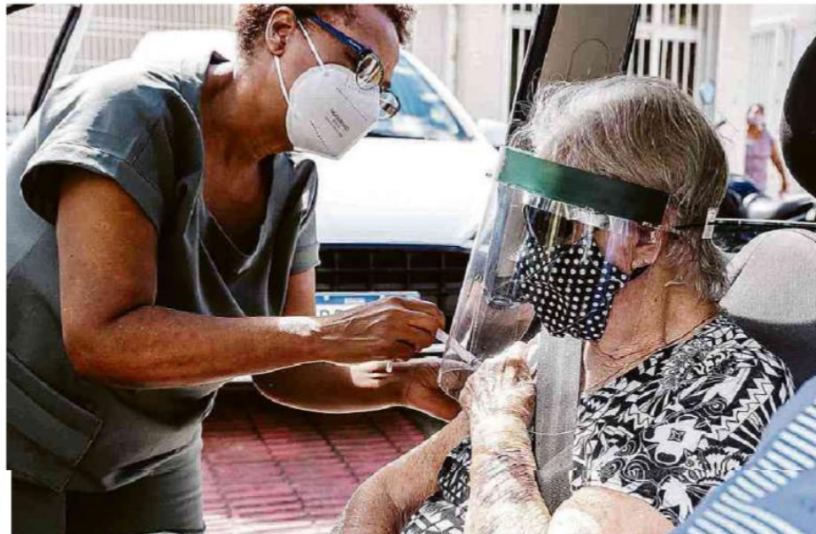
Profissional de saúde aplica segunda dose da Coronavac em idosa | Jansen Lubre - 17.mar.2021/PMV

Na última semana, a Sinovac divulgou dois estudos que mostram queda da taxa de anticorpos após seis meses tanto em pessoas tanto abaixo de 60 anos quanto acima. Os estudos avaliaram a segurança e imunogenicidade uma terceira dose da Coronavac, o que aumenta em até sete vezes a quantidade de anticorpos no sangue.