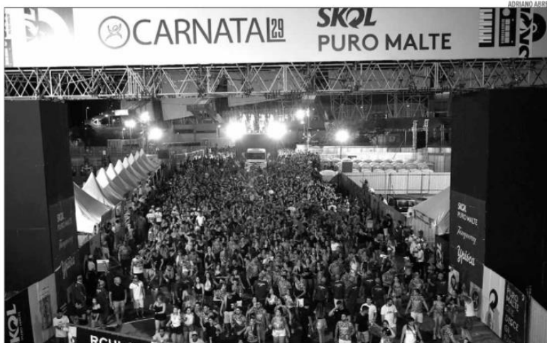
Expectativa é que o avanço da vacinação e a diminuição do impacto da pandemia nos serviços de saúde possibilitem o evento

Na sexta-feira (20), o secretário estadual de Tributação, Carlos Eduardo Xavier, se reuniu com a Destaque para tratar da possível realização da festa. Os detalhes da reunião, no entanto, não foram divulgados. "Estamos sempre conversando com a Prefeitura e com o Governo do Estado, porque há