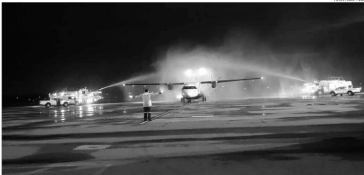
Ao pousar na pista do aeroporto, ontem às 17h50, após 46 minutos de voo, a aeronave modelo ATR 72-600 recebeu o tradicional batismo