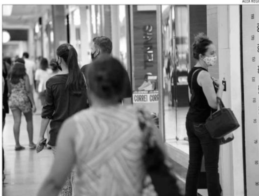
De janeiro a junho, o comércio varejista acumula 5,5% de crescimento ante igual período de 2020

De janeiro a junho, o comércio varejista potiguar acumula 5,5% de crescimento em comparação ao mesmo período do ano passado. Nessa mesma comparação, a média do Brasil é levemente superior ((6,7%). A receita nominal, no acumulado do ano, cresceu 18,1%. No comparativo entre junho deste ano e igual período do ano passado, a PMC registra um crescimento de 10,9% no volume de vendas no comércio varejista potiguar e de 25,9% na receita nominal de vendas.