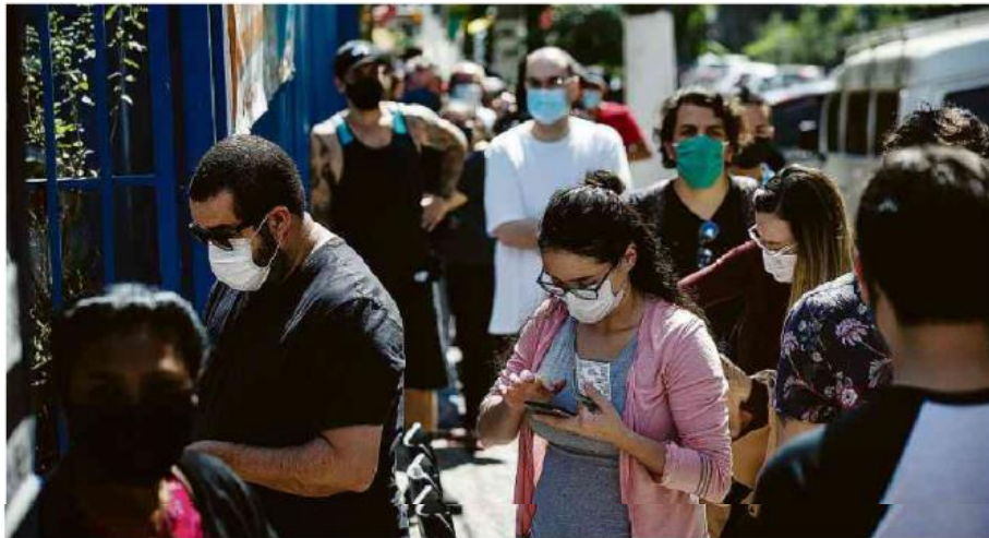
Paulistanos aguardam na fila para receber a vacina contra a Covid em posto de saúde da capital. Zanone Fraissat - 18 ago.2021/Folhapress

As pesquisas iniciais indicavam que o Sars-Cov-2 passava de um infectado para duas ou três pessoas, mas essa razão de contágio subiu com o aparecimento da alfa e mais ainda com a delta, diz Raghb Ali, pesquisador clínico sênior da Unidade MRC de Epidemiologia da Universidade de Cambridge (Reino Unido). “Cada vez que esse núme-