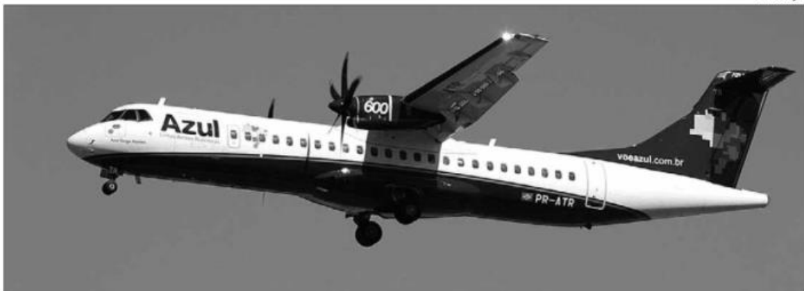
Aeronave modelo ATR 72-600, da Azul Linhas Aéreas, que tem capacidade para 70 passageiros, fará a rota entre Mossoró e Natal

A companhia Azul Linhas Aéreas abre, na próxima segunda-feira (23) a operação do voo Mossoró/Natal/Mossoró, com três frequências semanais as segundas, quarta e sextas-feiras. A aeronave modelo ATR 72-600, como capacidade para 70 passageiros, parte do aeroporto Dix Sept Rosado às 16h, horário de Brasília com previsão de pouso às 16h55 no Aeroporto Internacional Governador Aluizio Alves, onde receberá o tradicional batismo. Mossoró/Natal é uma das 15 rotas abertas pela Azul neste mês.