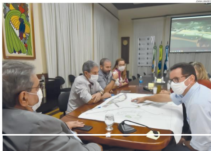
Prefeito Álvaro Dias, em reunião com secretários, reforça: "O turismo da nossa cidade precisa ser sempre valorizado e fortalecido"

A licitação da obra foi publicada na semana passada no Diário Oficial do Município e a expectativa da Secretaria Municipal de Obras Públicas e Infraestrutura (Semov) é concluir todos os trâmites em até 45 dias, se não houver nenhuma contestação por parte das empresas concorrentes. Após essa etapa, a or-