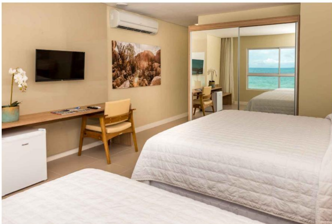
Os quartos são confortáveis e têm vista para o mar

O Hotel-Escola Senac Barreira Roxa, equipamento gerido pelo Sistema Fecomércio RN, recebeu o selo ISO 21401:2020 e passa a ser o único na América Latina certificado por desempenhar um modelo de gestão sustentável.