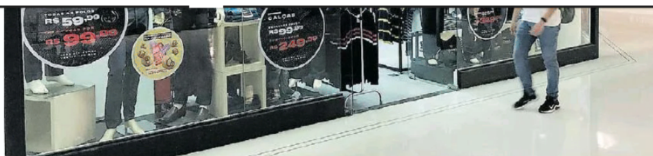
Nova realidade. Colombo, que vende ternos para a classe C, viu faturamento despencar 50%: público-alvo perdeu renda

No geral, a conta também não é das mais positivas. Mais da metade da população, por volta de 52%, está economizando menos do que antes. Ou seja: as pessoas estão utilizando as reservas para pagar contas básicas. Mesmo entre aqueles que estão conseguindo guardar algum dinheiro, 13% já estão de olho nas contas que precisam pagar. O universo de