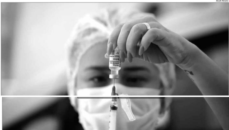
Última vez que o RN passou um dia inteiro sem mortes foi em novembro de 2020. Média de solicitação de leitos de UTI caiu para 25

A governadora Fátima Bezerra disse que os resultados possibilitam ao Estado o retorno de outros programas. "A redução do número de internados em UTI, dos pedidos de internações e de mortes por Covid, nos permitiu retomar um programa importante na área da Saúde, que é o Mais Cirurgias Mais Saúde. Estamos retomando agora e vamos intensificar em setembro, as cirurgias eletivas que foram interrompidas