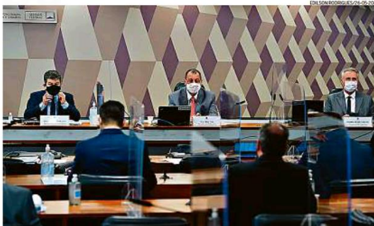
Retorno. Sessão da CPI da Covid no Senado: comissão volta aos trabalhos em meio a divergências do chamado "G7"

Os sigilos foram quebrados em junho pela comissão. A AGU entrou com pedido na Corte para barrar essas quebras, mas a ação foi negada pelo ministro Ricardo Lewandowski. Depois disso, instituições financeiras e de comunicação já enviaram o material para análise da investigação. O novo recurso tenta impedir que esses dados sejam utilizados como prova e pede novamente para suspender as decisões.