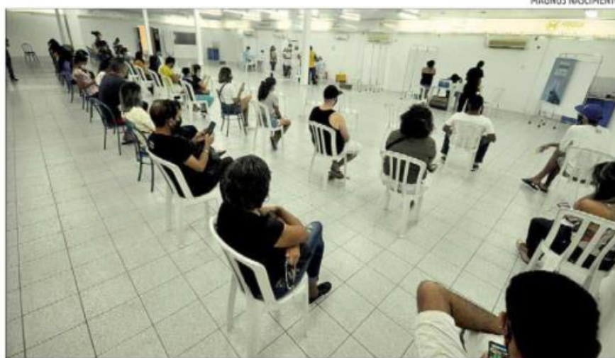
Segundo a Sesap, 86 pessoas se recusaram a tomar a 2ª dose. Dose única não garante imunidade

Hoje o RN registra 1.577.438 pessoas vacinadas com a pri-