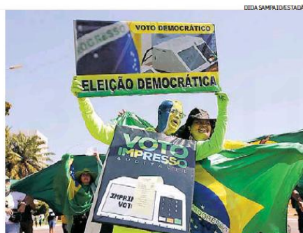
Brasília. Manifestante em ato na Esplanada dos Ministérios

nal Federal, ao ex-presidente Luiz Inácio Lula da Silva e ao governador de São Paulo, João Doria (PSDB). “Por que não?” foi o mote da manifestação. De acordo com os participantes, a possibilidade de imprimir o voto daria mais “transparência” ao processo eleitoral. Bolsonaro, na mensagem transmitida, afirmou que “uma eleição limpa, com voto impresso e contagem pública, é a garantia da democracia”. Diversas pessoas não usavam máscaras, apesar da pandemia. Participaram do ato na Paulista os deputados dos PSL Eduardo Bolsonaro e Carla Zambelli e o ex-ministro do Meio Ambiente Ricardo Salles. “Não vamos aceitar eleição fraudada”, afir-