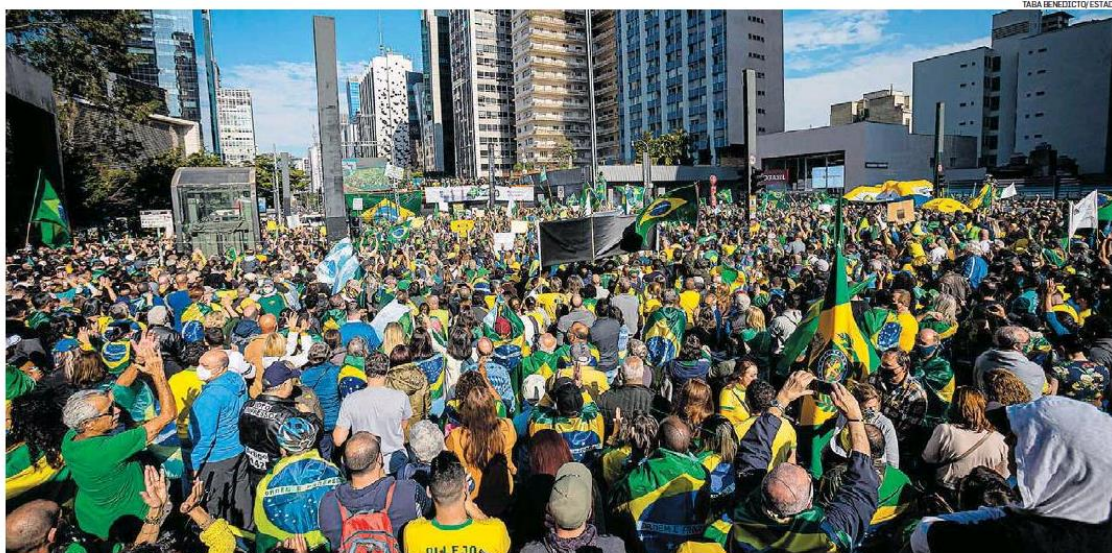
São Paulo. Manifestação em defesa do voto impresso reuniu apoiadores do governo na Paulista; mensagem do presidente transmitida pelo sistema de som