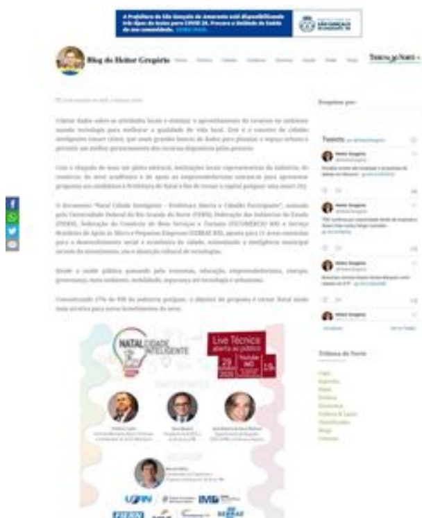
Clique aqui para abrir a imagem

Coletar dados sobre as atividades locais e otimizar o aproveitamento de recursos no ambiente usando tecnologia para melhorar a qualidade de vida local. Este é o conceito de cidades inteligentes (smart cities), que usam grandes bancos de dados para planejar o espaço urbano e permitir um melhor gerenciamento dos recursos disponíveis pelos gestores.