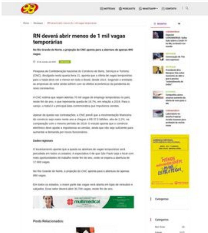
Clique aqui para abrir a imagem

Home Destaque RN deverá abrir menos de 1 mil vagas temporárias