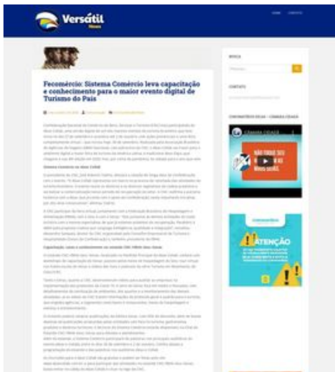
Clique aqui para abrir a imagem