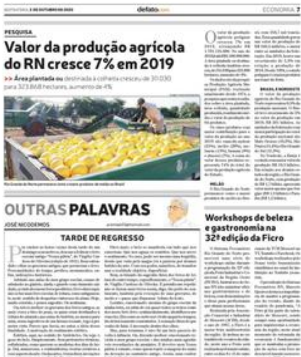
Clique aqui para abrir a imagem

faz parte do calendário de Mossoró, sendo sempre uma oportunidade para impulsionar a economia da região, neste atual momento de retomada da economia é fundamental que se mantenha a promoção de ações com foco no desenvolvimento socioeconômico do RN', disse.