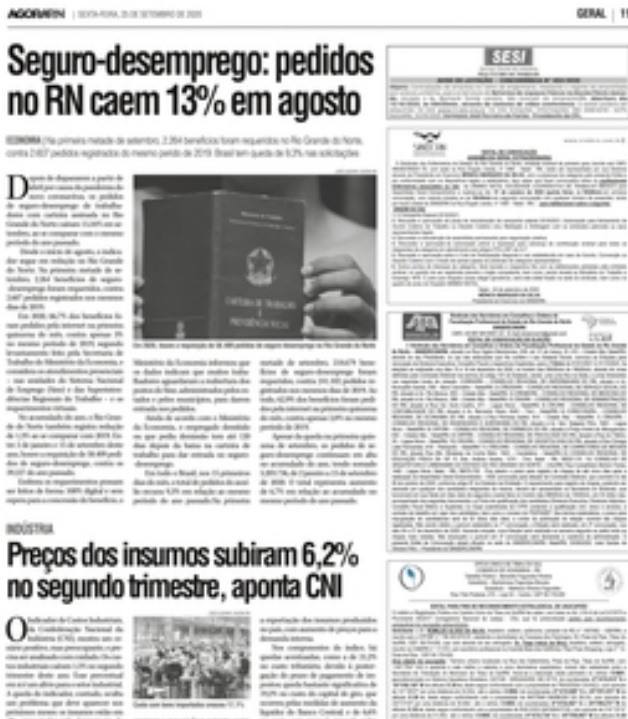
Clique aqui para abrir a imagem

Preços dos insumos subiram 6, 2% no segundo trimestre, aponta CNI