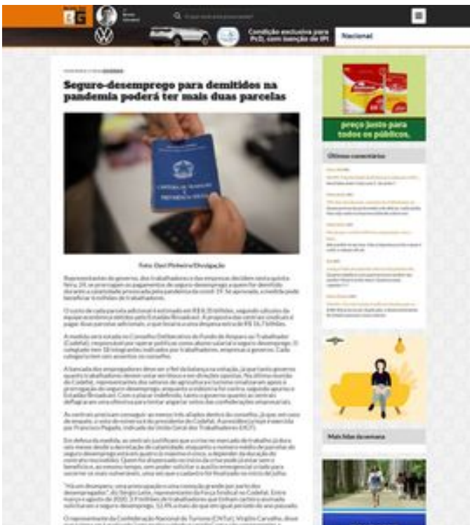
Clique aqui para abrir a imagem