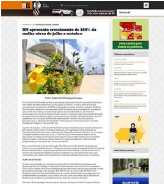
Clique aqui para abrir a imagem