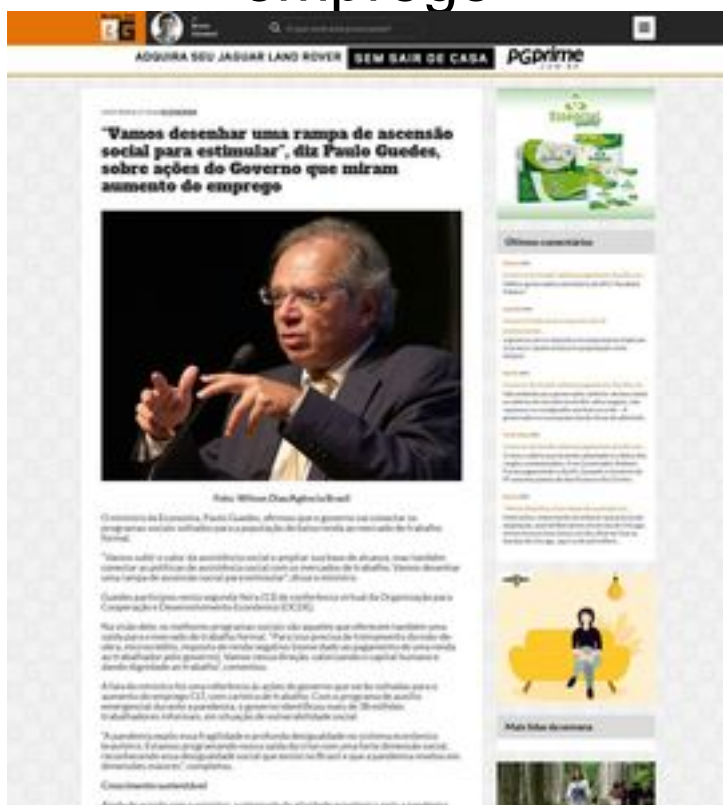
Clique aqui para abrir a imagem

'A pandemia expôs essa fragilidade e profunda desigualdade no sistema econômico brasileiro.