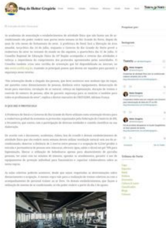
Clique aqui para abrir a imagem

As academias de musculação e estabelecimentos de atividade física que não fazem uso de ar-condicionado vão poder reabrir suas portas nesta semana no Rio Grande do Norte, depois de mais de três meses de fechamento do setor. A prefeitura de Natal fará a liberação da área amanhã, terça-feira dia 14 de julho, enquanto o Governo do Rio Grande do Norte prevê a reabertura do setor no restante do estado no dia seguinte, a quarta-feira dia 15 de julho. O Conselho Regional de Educação Física da 16ª Região acompanha o retorno das atividades e reforça a importância do cumprimento dos protocolos apresentados pelas autoridades. O Conselho também criou uma cartilha de orientação que foi disponibilizada na