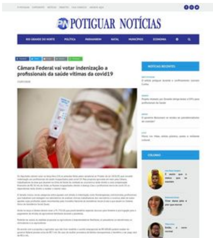
Clique aqui para abrir a imagem

Os deputados devem votar na terça-feira (14) as emendas feitas pelos senadores ao Projeto de Lei 1826/20, que concede indenização aos profissionais de saúde incapacitados pela covid-19. Pela proposta aprovada em maio pela Câmara, trabalhadores da área que atuarem na linha de frente do combate ao coronavírus terão direito a uma compensação financeira de R$ 50 mil, da União, se ficarem incapacitados devido à doença. Caso o profissional morra de covid-19, os dependentes terão direito a receber o mesmo valor.