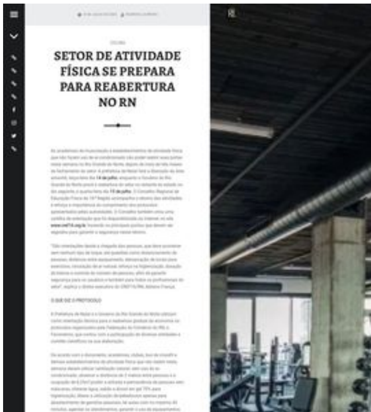
Clique aqui para abrir a imagem

As academias de musculação e estabelecimentos de atividade física que não fazem uso de ar-condicionado vão poder reabrir suas portas nesta semana no Rio Grande do Norte, depois de mais de três meses de fechamento do setor. A prefeitura de Natal fará a liberação da área amanhã, terça-feira dia 14 de julho, enquanto o Governo do Rio Grande do Norte prevê a reabertura do setor no restante do estado no dia seguinte, a quarta-feira dia 15 de julho. O Conselho Regional de Educação Física da 16ª Região acompanha o retorno das atividades e reforça a importância do cumprimento dos protocolos apresentados pelas autoridades. O Conselho também criou uma cartilha de orientação que foi disponibilizada na