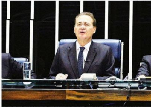
Renan Calheiros: "O que não pode haver, e não haverá, é o Brasil não permitir, é a diferença das instituições"

Eunício explicou que só fará mudanças de mérito no texto se houver acordo com a Câmara. "Se não houver negociação, não farei mudança de mérito. Ele lembrou que, caso haja mudança de mérito, o texto volta à Câmara, e a tendência é que os deputados,