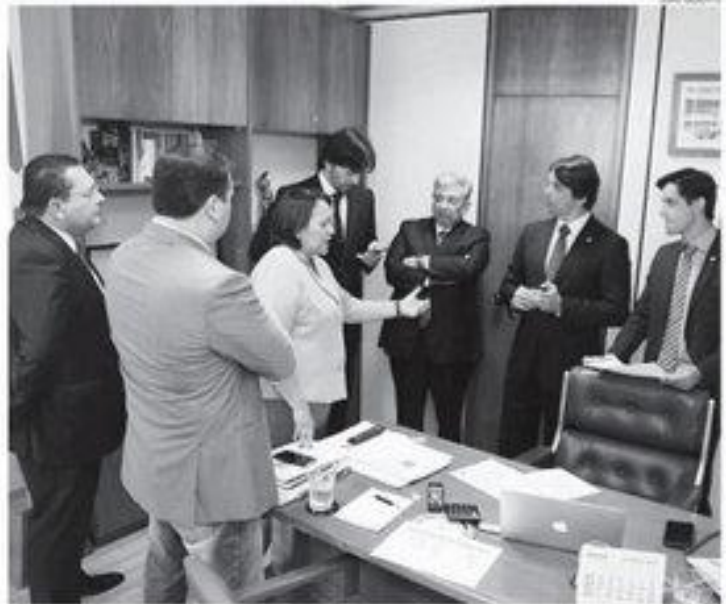
Reunião em Brasília foi considerada muito produtiva pelos deputados e senadores

Anteontem, em reunião com o ministro da Integração Nacional, a bancada federal obteve a garantia de que o RN terá a continuidade de obras hídricas necessárias à arremediação dos efeitos da seca. Ao todo serão R$ 13 milhões repassados por mês.