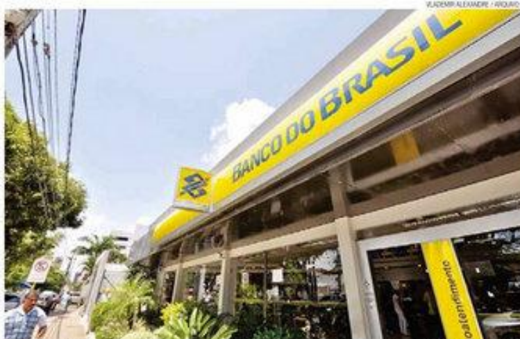
► Banco do Brasil lucrou R$ 3 bilhões no segundo trimestre de 2015 e seus ativos administrados atingiram R$ 1,53 tri

O financiamento ao agronegócio encerrou o primeiro semestre de 2015 com R$ 168,3 bilhões. Esse