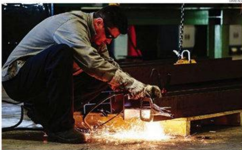
► Sondagem de julho mantém a tendência observada desde julho de 2013

As informações do estudo indicam que a sondagem de julho mantém a tendência observada desde julho de 2013, ao registrar um clima econômico menos favorável na América Latina do que na