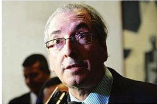
► Para Janot, Cunha pretendia ser beneficiado com iniciativa da AGU

No parecer, além de afirmar que a diligência foi legal, Janot informou que Cunha usou a estrutura da Advocacia-Geral para atuar