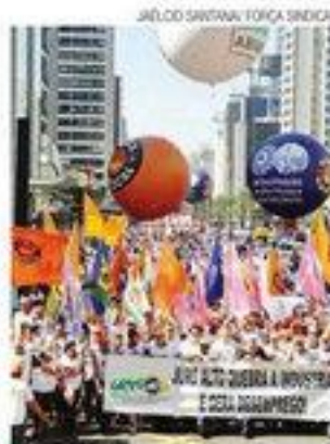
► Juros foram o alvo do protesto

"A crise se agravou e aumentou o desemprego e a falência das em-