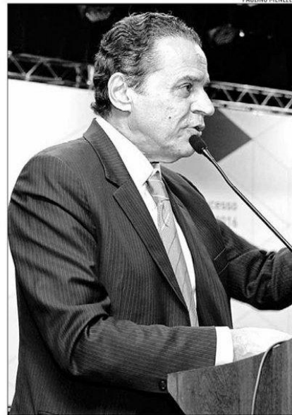
Henrique Alves participa de evento sobre legado da Olimpíada

O ministro do Tribunal de Contas da União, Augusto Nardes, foi enfático sobre o trabalho do ministro do turismo. "Tenho certeza que o ministro Henrique Eduardo Alves vai fazer uma grande gestão no Ministério do Turismo. Conheço a capacidade de gestão dele", afirmou. O ministro do Esporte, George Hilton, reforçou o empenho do governo federal para nacionalizar os jogos. "Temos trabalhado para que esta seja uma Olimpíada de todo o país. A nacionalização do evento passa pela entrega de equipamentos que permitam a iniciação da população no esporte e espaços para treinamento".