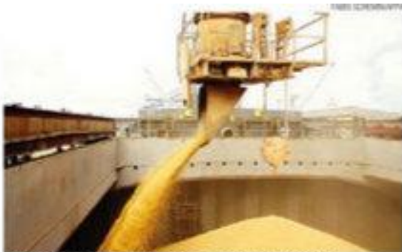
► Banco do Brasil tem projeções otimistas para o agronegócio

VEÍCULO: NOVO JORNAL DATA: 14.08.15 EDITORIA: ECONOMIA