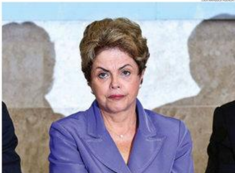
► Dilma Rousseff reconheceu a situação de dificuldade política e de baixa popularidade

Mais cedo, o vice-presidente e articulador político do governo, Michel Temer, voltou a defender que é preciso continuar o diálogo com o Congresso Nacional,