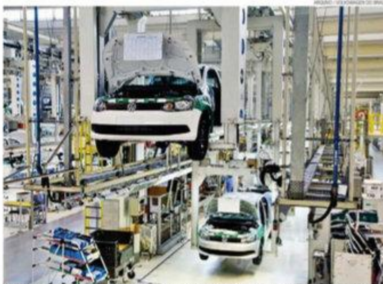
► Apesar da queda no acumulado do ano, em julho as vendas de veículos subiram 5,7% na comparação com junho