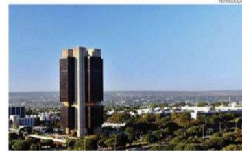
Para o BC, ritmo da expansão da atividade econômica é menor este ano

/ SELIC / NA AVALIAÇÃO DO COMITÊ, A ESTRATÉGIA DE ELEVAÇÃO DOS JUROS FARÁ COM QUE A INFLAÇÃO VOLTE PARA A META NO PRÓXIMO ANO