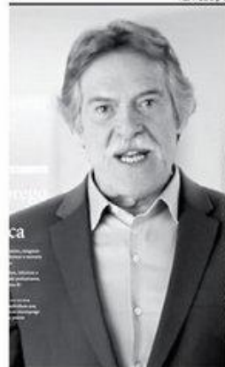
► José de Abreu, apresentador

O ex-presidente Luiz Inácio Lula da Silva, que também participou do programa, reconheceu que o país enfrenta fase difícil, mas que a atual situação ainda é melhor do que no passado. "Nosso pior momento ainda é melhor para o trabalhador que o melhor momento dos governos passados. Nosso maior ajuste ainda é menor do que os ajustes que eles fizeram. É mais fácil chegar a um porto seguro com quem já foi capaz de enfrentar a crise e fazer o Brasil avançar na tormenta, sempre prote-