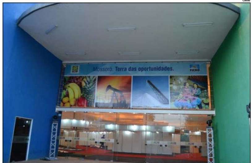
Ficro continua hoje, com capacitação para negócios