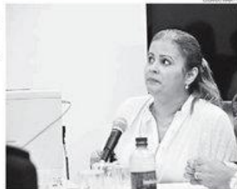
Acordo para pagar precatório foi feito na administração Micaela de Sousa

Certada, o acordo - presidiado pelo então presidente do Tribunal de Justiça do Rio Grande do Norte, desembargador Rafael Godinho - reduziu o valor para R$ 96,6 milhões que foi questionado pelo Tribunal de Contas. O então presidente depois foi afastado por envolvimento no desvio de milhões promovido dentro do setor de precatórios no TJ. Enquanto isso, no local, um novo hotel foi construído pela Henasa e estando concluído, foi vendido à empresa que transformou o prédio no Hotel Ponta do Sol. A estrutura física do hotel ainda permanece mesmo que foi engida pela Henasa.