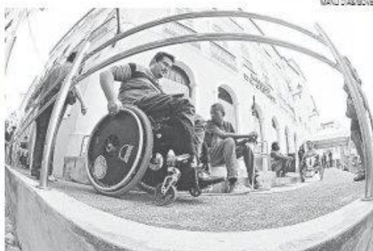
Terceirização ameaça cotas para portadores de necessidades especiais

"Será computados para efeito de cotas o número total dos empregados, mas quem será a contratante, quem será o responsável pelos encargos, como será feita essa contagem? Então ainda há