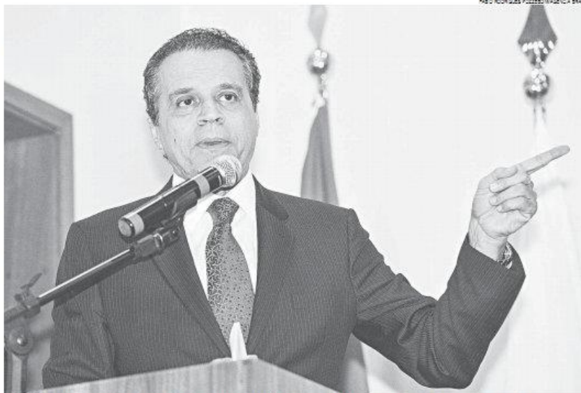
Presidente do PMDB, ministro Henrique Eduardo Alves, vai receber relatório dos deputados estaduais sobre situação do partido em cada região