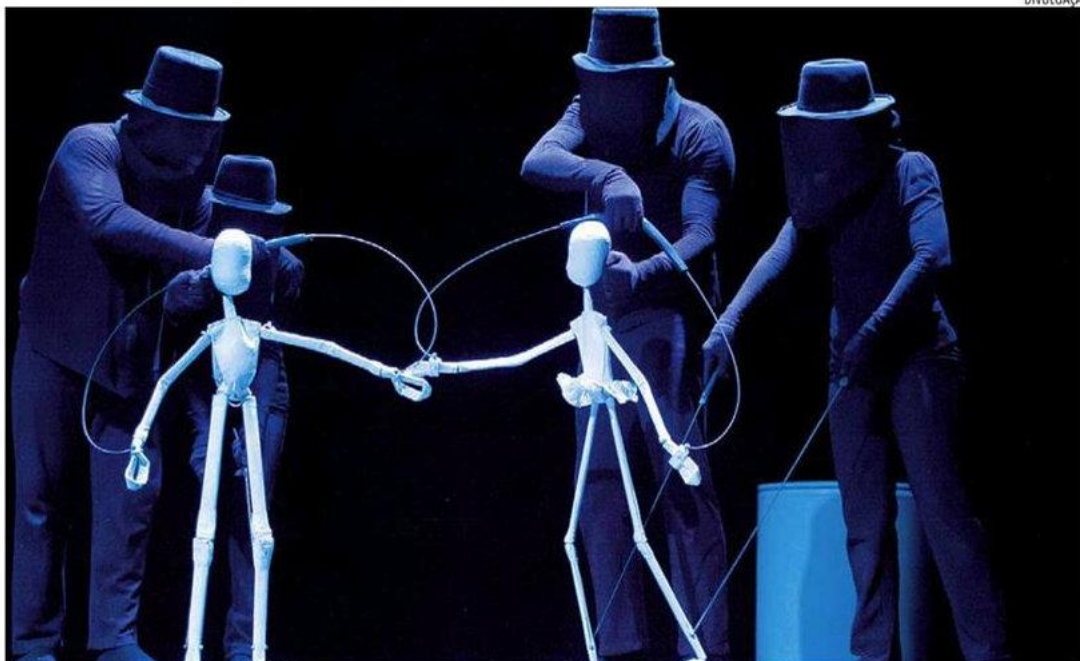
Companhia cearense utiliza técnicas de abricolagem e teatro negro, temas abordados na apresentação e nas oficinas