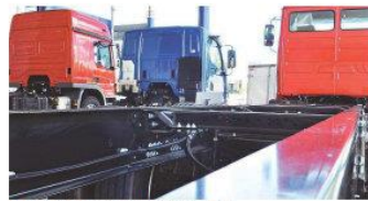
Venda de caminhões sofreu maior queda: 50%

"Quando tem vaca magra a gente olha cada centavo. Então tem que reduzir custos com material de expediente, telefone, ar-condicionado, diminuir investimento em propaganda, participação em eventos, para poder sair com um pouco mais de fôlego dessa crise", orienta.