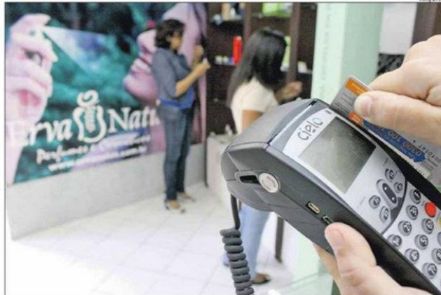
No cartão, a taxa passou de 12,02% ao mês, para 12,14% ao mês. É a maior desde março de 1999

Para quem já está endividado, uma das dicas é procurar o credor de sua dívida e propor uma renegociação do prazo e das taxas de juros em uma condição que consiga cumprir.