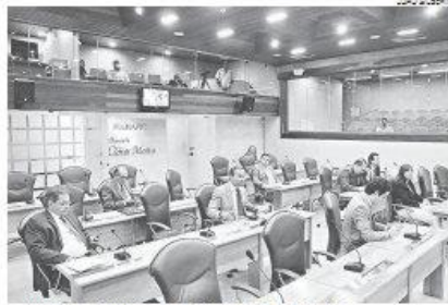
Assembleia deve começar a analisar projeto esta semana

O dinheiro, em tese, vai servir para preencher uma lacuna no orçamento do legislativo. De todo o orçamento da instituição, um montante de R$ 292 milhões, ape-