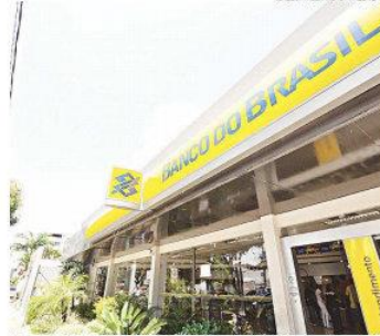
Banco do Brasil e privados continuam financiando 80% do valor dos imóveis

Pelas novas regras, os financiamentos via Caixa dentro do Sistema Financeiro Habitacional (SFH) — que financia unidades até R$ 750 mil no Distrito Federal, em São Paulo, no Rio de Janeiro e em Minas Gerais e até R$ 650 mil no resto do país — passam a ser de até 50% do valor para imóveis usados, e não mais 80%. No Sistema Financeiro Imobiliário (SFI) que fi-