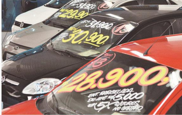
Queda nas vendas no setor automotivo potiguar chega a 11%, mas revendedores rechaçam momento de crise