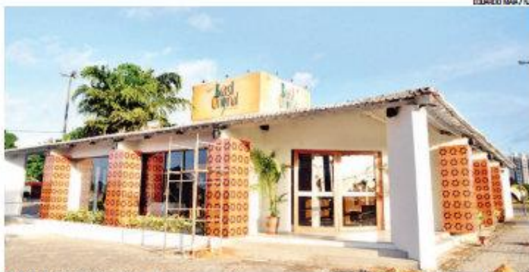
▶ Loja Brasil Original, instalada ao lado da Praça da Árvore, em Mirassol, fica sob administração do Sebrae só este mês