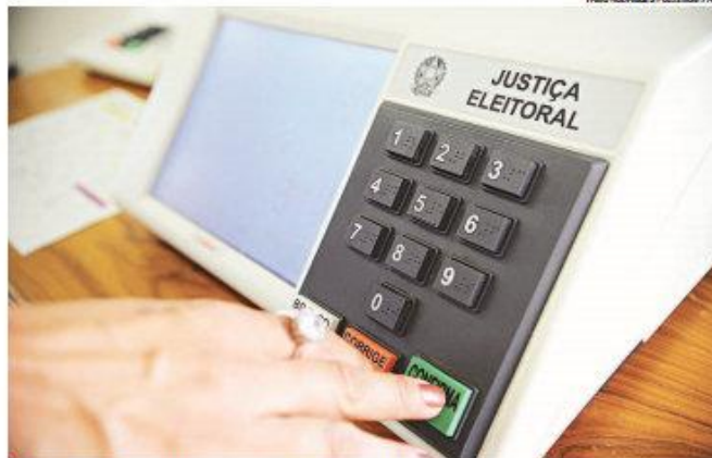
► Até o momento RN teve 89 pedidos de impugnação, assim como Mato Grosso do Sul

Além do ex-prefeito, outros 34 candidatos tiveram registros impugnados pela procuradoria fluminense, sendo 20 para deputado estadual e 14 para deputado fede-