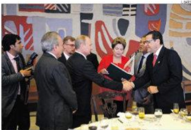
Michel Temer e Henrique Eduardo ladeiam o presidente Wladimir Putin e Dilma Rousseff

Em seu pronunciamento logo após o almoço no Itamaraty, a presidente Dilma Rousseff disse que o Brasil tem aprofundado suas relações com a Rússia e o intercâmbio entre os dois países ganhou novo impulso nos últimos anos. "Essa maior aproximação não é circunstancial, mas um fato importante em um mundo multipolar". Ela lembrou a assinatura nesta segunda-feira de uma série de acordos bilaterais nas áreas de economia, defesa, tecnologia, energia e produção de vacinas. Um dos prin-