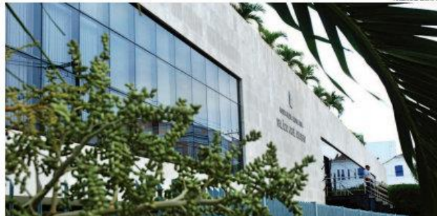
► Maior procura de candidatos é para a Assembleia Legislativa

O desejo de ascensão política também chegou às Câmaras Mu-