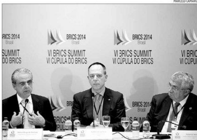
Empresários, ministros e presidentes dos Bancos Centrais discutiram sobre a economia do bloco

"Isso vai permitir que, se eu tiver que fazer uma remessa à Índia, eu não tenha que converter [o valor] em dólares e depois em rupias, gerando custos de transação. Assim, teremos pequenas baixas que diminuirão o custo financeiro de operação. É uma medida simples e possível de ser feita no ambiente do