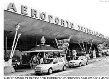
Augusto Severo foi fechado com inauguração do aeroporto novo, em São Gonçalo

incentivar o turismo rural, gastronômico e ecológico visando a história, a cultura, a paisagem natural e as vocações regionais. "Buscar ações para a instalação de infraestrutura dos distritos de Macaíba, o DIN de Natal e o DIM de Mossoró (criar um Micro Polo Industrial) para 40 novas empresas, in- mar para atrair navios de grande