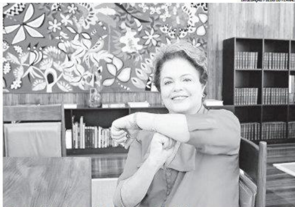
ENLARGAÇÃO / FLODO PLANALTO

A dor do Neymar ao ser atingido feriu o coração de todos os brasileiros. O Neymar está aí,