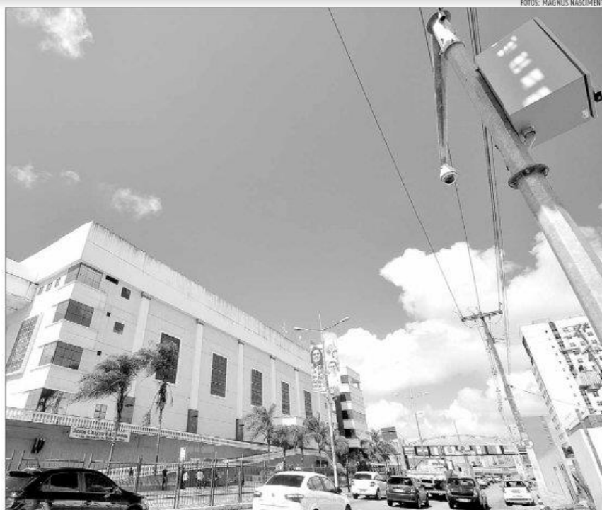
Sessenta câmeras de monitoramento estão funcionando em diversos pontos da cidade. Outras 140 devem ser instaladas ainda este ano

"Decidimos trazer o secretário aqui porque o comércio é um alvo preferencial e sempre muito vulnerável à ação de bandidos. Precisamos manter nossas portas abertas e a falta de uma política eficiente e eficaz de segurança pública tem um impacto enorme e direto nos nossos estabelecimentos. Pois, sem se-