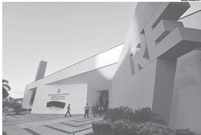
Previsões de gastos foram encaminhadas ao Tribunal Regional Eleitoral (TRE) no ato do pedido dos registros de candidatura

/ ELEIÇÕES / CAMPANHA MAJORITÁRIA DE 2014 TEM ESTIMATIVA DE GASTOS DE R$ 89,3 MILHÕES. PARA PRESIDÊNCIA, PREVISÕES CRESCERAM 90%