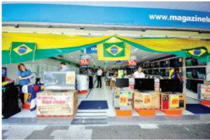
► Setor de eletrodomésticos teve um aquecimento substancial devido ao "boom" nas vendas de televisores, mas no geral a Câmara dos Dirigentes Lojistas de Natal estima redução no faturamento em junho