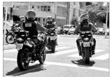
Polícia Militar está com 60 novas motocicletas em circulação