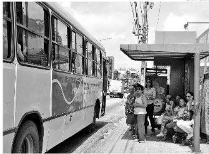
Seturn propõe reajuste para R$ 2,80. Prefeitura sinaliza para aumento de R$ 0,10

O Conselho Municipal de Mobilidade Urbana de Natal reuniu na manhã de hoje todos os conselheiros para discutir pautas relativas ao transporte público na capital potiguar. Entre as discussões, um novo debate sobre a necessidade do aumento das passagens de ônibus. A reunião começou às 10h, mas nada chegou a ser divulgado até o fechamento da edição deste vespertino de hoje.