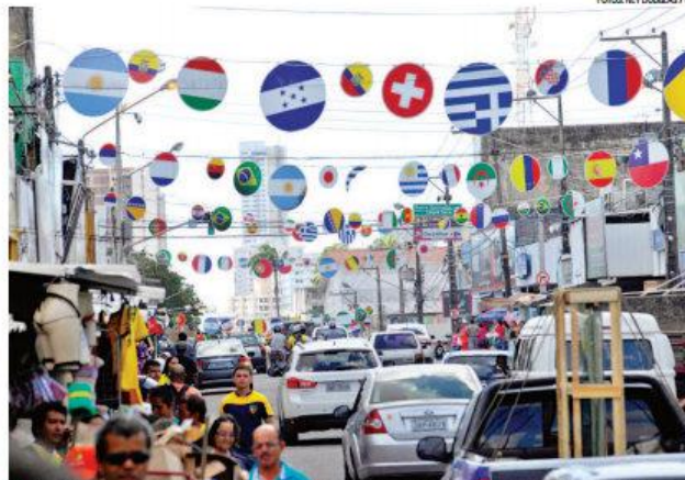
Comércio de preparo para faturar com a Copa do Mundo em Natal; balanço será anunciado amanhã pela Fecomércio

PASSAMOS POR UM MOMENTO HISTÓRICO PARA O RN, SÓ TEMOS BONS FRUTOS A COLHER A PARTIR DE AGORA"