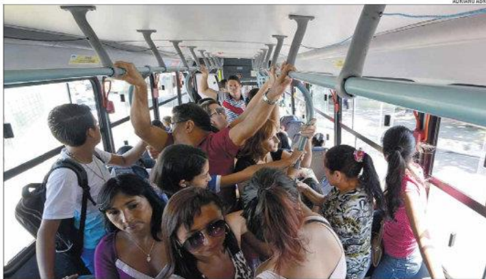
Empresários do transporte consideram novo valor "fora da realidade" e reafirma que a tarifa deve ficar entre R$ 2,56 e R$ 2,80

O estudo sobre o reajuste foi realizado pela Prefeitura após provocação do Ministério Públi-