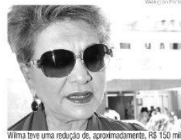
Wilma teve uma redução de, aproximadamente, R$ 150 mil

concorrente de Wilma, a deputada federal Fátima Bezerra, do PT, teve uma "pequena" evolução patrimonial, saindo de R$ 482 mil para R$ 558 mil - ainda quase metade do patrimônio de Wilma. Atualmente, segundo a declaração de bens da petista, pela tem uma casa, um chalé em Nísia Floresta, um residencial no Conjunto Ponta Negra e dois terrenos. Tem também três veículos: uma Hilux, um Fiesta e um Palio Weekend.