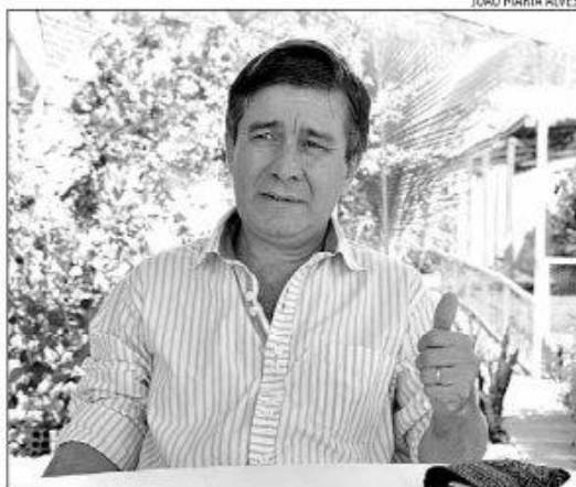
Robério Paulino disputa o Governo do RN pelo PSOL