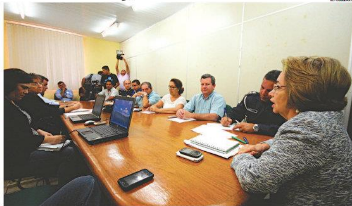
Conselho Municipal de Transporte e Trânsito Urbano volta a se reunir dia 16 para definir de quanto será o reajuste