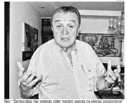
Ney: "Democratas não poderão obter registro apenas na eleição proporcional"

Aplicado subsidiariamente em matéria eleitoral, o Código de Processo Civil, no artigo 334, inciso I, estabelece que o fato notório não depende de prova. "Nesse caso o deferimento seria ultra petita, ou seja, a justiça acrescentaria deliberação que não foi tomada expressamente pelos convençionais. A controvérsia está estabelecida. Aguarda-se o pronunciamento, com a interpretação final da Justiça Eleitoral".