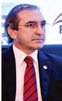
CLEO LIMA DO NOVO JORNAL

DUAS SEMANAS APÓS o apito final do jogo entre Itália e Uruguai na Arena das Dunas, que encerrou a participação de Natal na Copa do Mundo 2014, o saldo da competição para a cidade apresenta três cenários distintos. Enquanto bares e restaurantes comemoram evolução de até 300% no faturamento, o ramo de turismo aguarda benefícios a médio e longo prazo, exaltando a excelente visibilidade da capital potiguar no mundo inteiro durante o evento da Fifa.