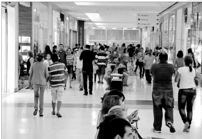
Em Natal, lojas dos shoppings fecham uma hora antes da partida válida pelas semifinais da Copa do Mundo e reabrem uma hora depois

A Justiça Federal no Rio Grande do Norte também funcionará em caráter excepcional, nas 14 Varas de Natal e do interior, das 9 horas às 15 horas.