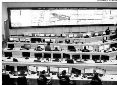
Estrutura onde está funcionando o Giosp custou R$ 80 milhões