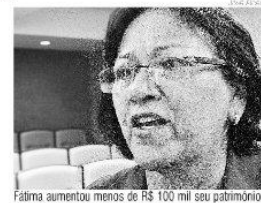
Fátima aumentou menos de R$ 100 mil seu patrimônio