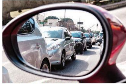
► Setor de veículos espalha seus fracos resultados para demais ramos

Outros fatores que prejudicam o setor, diz Macedo, são os estoques acumulados –e a redução da produção vai na direção de diminuir o acúmulo de veículos nos pátios das montadoras– e o crédito reduzido, especialmente para veículos. Segundo dados do Banco Central, o crédito para compra de carros concedido a pessoas físicas caiu 12,6% no período de março a maio, quando a produção do setor afundou de modo mais intenso e coincidiu com