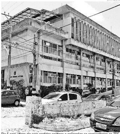
Dia 5 será último dia para partidos políticos e coligações se apresentarem ao TRE