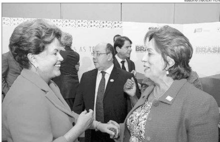
Tanto a presidenta Dilma Rousseff quanto a governadora Rosalba trajavam blazer vermelho