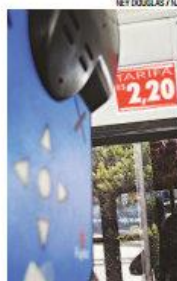
► Cartão garantirá gratuidade

No início de cada ano as escolas vão enviar à Semob a relação dos estudantes regularmente matriculados e cadastrados no sistema, para que tenham direito ao Cartão de Gratuidade Estudantil. Nas escolas o Setum (Sindicato das Empresas de Transporte Público) deverá instalar um equipamento validador e a Semob confeccionará os cartões a serem entregues gratuitamente através de tecnologia compatível com a bilhetagem eletrônica, contendo cores, especificações e detalhamento biométrico definidos em decreto regulamentar. De posse do