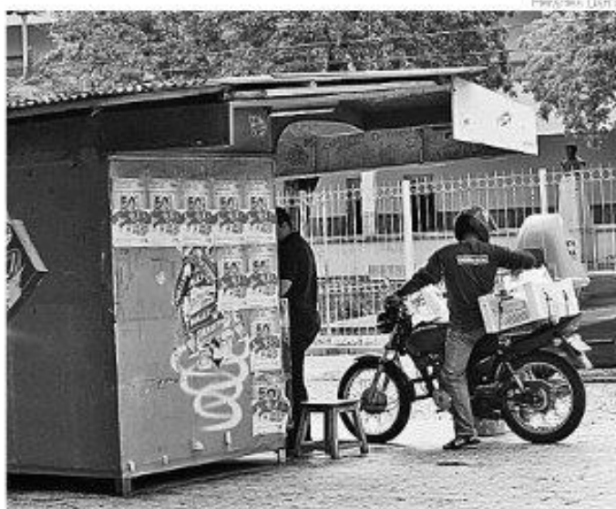
Proposta transforma bancas de jornais em pontos de informações turísticas

Serão disponibilizados materiais informativos gratuitamente pelo Poder Público, tais como mapas, endereços e sugestões que sejam de interesse turístico local e cultural às bancas de jornal e de revistas que estejam dispostas a atuarem como Pontos de Informações Turísticas. Poderão também ser firmadas parcerias com empresas