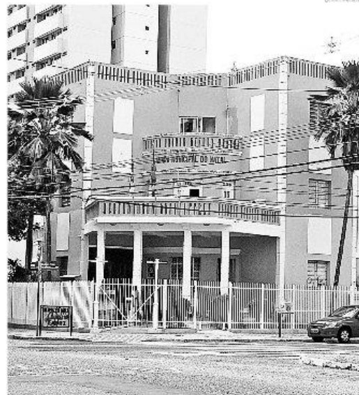
Câmara entrou em recesso após aprovar auxílio para desabrigados de Mãe Luíza