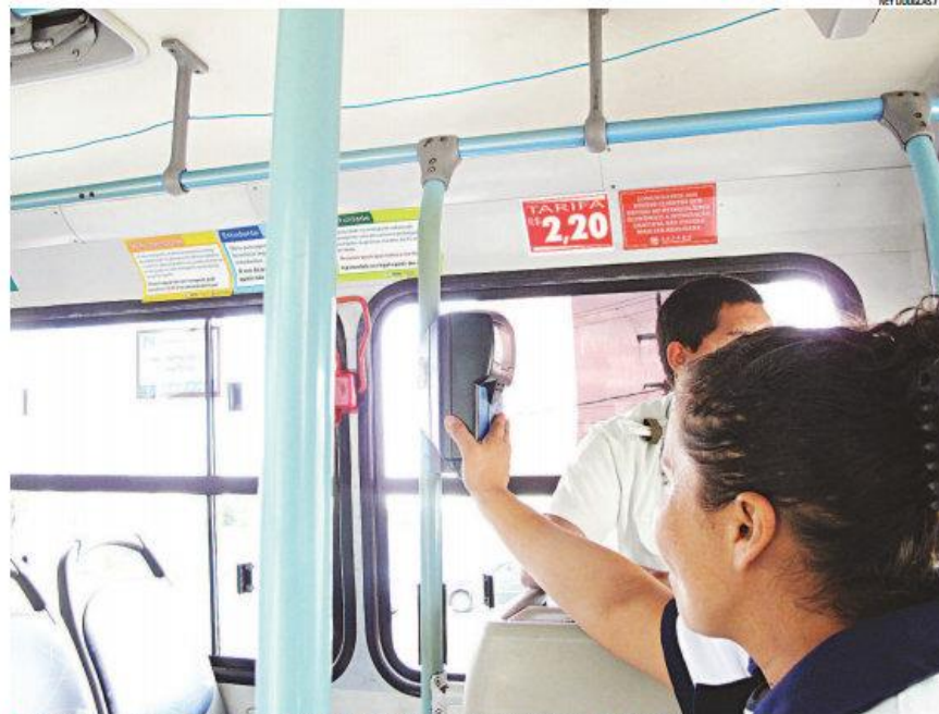
▶ Cada estudante deverá ter direito a 60 créditos mensais que contemplarão atividades escolares e extracurriculares

Porém, esses 44 mil alunos ainda devem passar pelo crivo de uma comissão formada por representantes das secretarias de Educação (SME); Mobilidade Urbana (Semob); Planejamento (Seplan); Procuradoria (PGM); e Gabinete Civil (Segap). Essa comissão terá todo o mês de julho para realizar estudos e filtrar somente aqueles estudantes que se enquadram na lei. "Após esse prazo de 30 dias, é que vamos ter um cadastro desses estudantes, um estudo de prazos para a implementação do sistema, das máquinas e poderemos definir quando, de fato, os alunos pode-