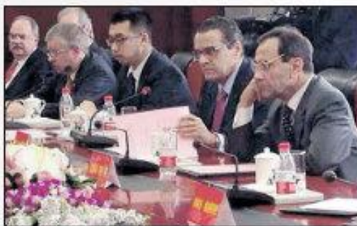
Representantes do Parlamento em missão oficial na China

Civil da Internet é uma conquista, foram seis meses de intensa discussão de um tema com muita complexidade", declarou.