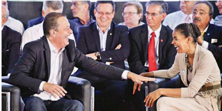
▶ No anúncio de Marina como vice, Eduardo Campos disse que pretende "ir pra cima" do PT durante a campanha

Campos não quis detalhar o que faria para enxugar a máquina federal. "A gente precisa diminuir o número de ministérios quem sabe à metade do que tem hoje", disse. "Da forma como está organizado o Estado brasileiro, não dá para ficar. A forma nós vamos ver mais adiante", disse. Marina comparou a união com Campos a um "casamento da tapioca com o açaí", em referência às iguarias de Pernambuco e do Acre.