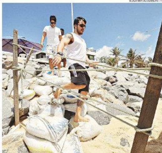
Escadas improvisadas desafiam banhistas em Ponta Negra

timo aditivo aprovado pela Procuradoria Geral do Município (PGM) para o enrocamento de Ponta Negra. "Ele já foi aprovado, e só está aguardando pela publicação. Acreditamos que agora o trabalho será concluído, e não haverá mais a necessidade de novos aditivos", comentou. Entretanto, o procurador admite que o custo do serviço pode ser elevado em mais R$ 75 mil, o que o deixaria