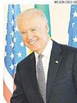
► Vice dos EUA, Joe Biden, na torcida

Diplomatas americanos contaram à reportagem que ainda aguardam a possibilidade de um encontro de Biden com a presidente Dilma, ainda não confirmado.