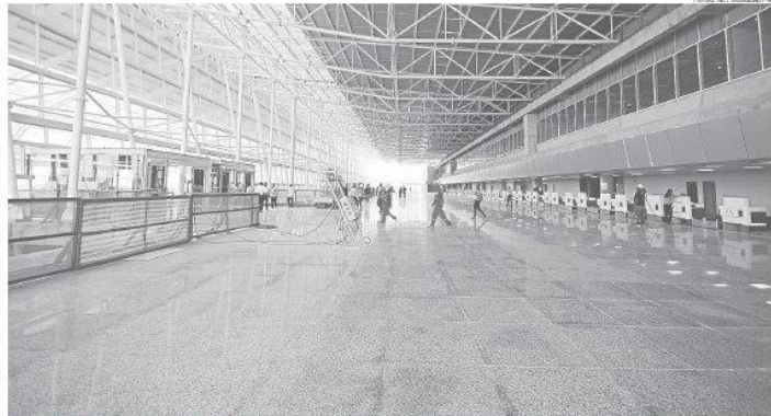
Terminal de passageiros do Aeroporto Internacional Governador Aluízio Alves entra na fase de polimento, instalações elétricas e paisagismo