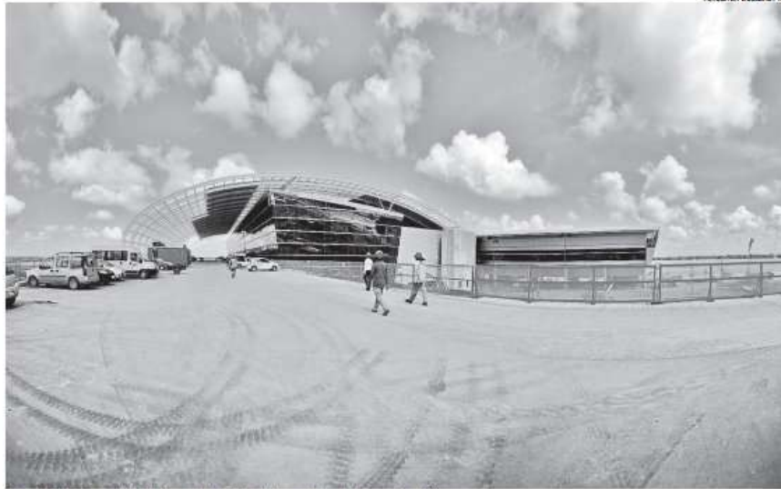
Terminal do Aeroporto Aluizio Alves ainda não tem linhas regulares de transportes coletivos

A Trampoline, que já trabalha com várias linhas intermunicipais interligando parte da Grande Natal - Parnamirim, São Gonçalo do Amarante e Macalba - já protocolou uma série de pedidos para atender a região. A ideia inicial é estender