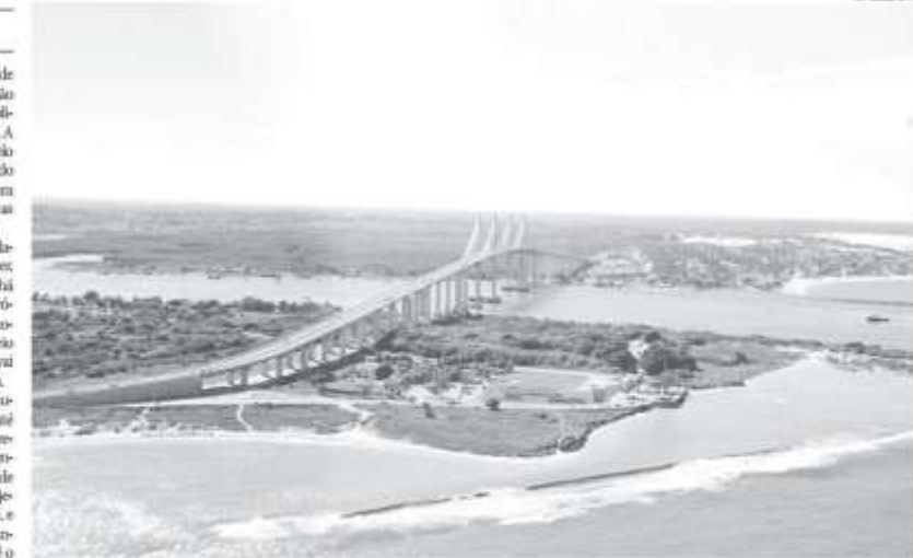
Local da Fila Fan Fest, entre a ponte Newton Nazareno e a Praia do Forte

Já o Museu de Cultura Popular Djalma Maranhão, localizado no primeiro andar da antiga Rodoviária de Natal, dentro da filiteta, ac-