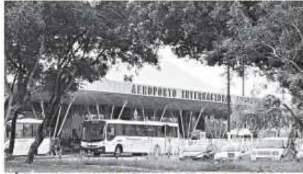
► Ônibus para passageiros irá de Parnamirim a São Gonçalo por 15 dias

O Consórcio Inframérica vai disponibilizar temporariamente uma linha de traslado. A partir do dia 31, data do início das operações, e pelos 15 dias seguintes, um ônibus ligará o Aeroporto Augusto Severo, em Parnamirim, ao novo terminal. O objetivo, de acordo com a assessoria de comunicação do consórcio, é resgatar o passageiro desavisado que for ao terminal antigo e levá-lo ao local certo de embarque. Terão acessos todas as pessoas que portarem passagens aéreas com a data do dia de uso do traslado.