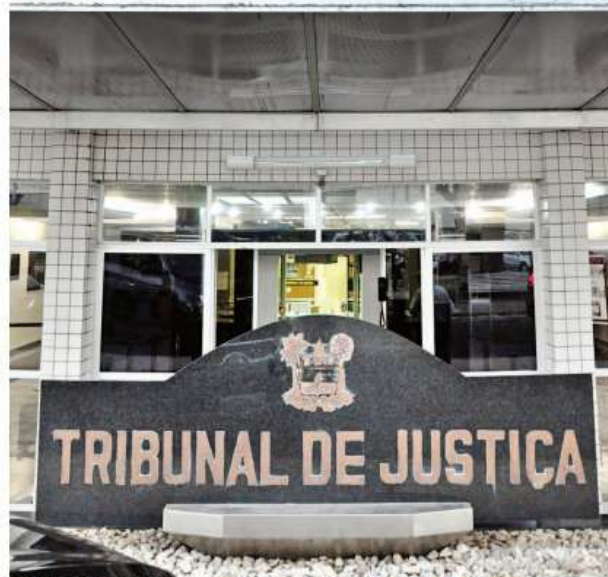
▶ Tribunal de Justiça só vai se pronunciar sobre o caso após analisar parecer que será apresentado hoje