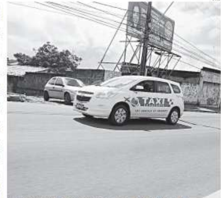
► Valores da corrida sobem em relação ao terminal de Parnamirim