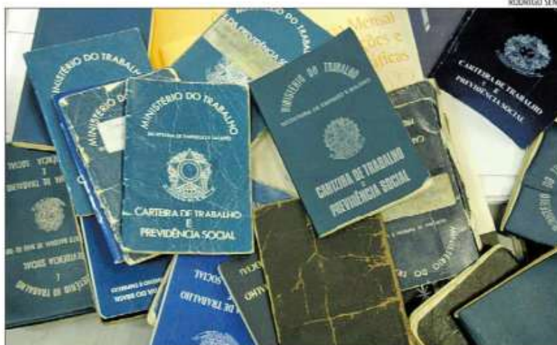
De acordo com projeções da OIT, o Brasil terminaria este ano com 100 mil desempregados a mais

Na semana passada, o IBGE revelou que abril havia registrado a menor taxa de desemprego nas seis regiões metropolitanas desde 2002. Mas o País abriu apenas 105.384 vagas formais de trabalho em abril, o pior resultado para esse período desde 1999, segundo o Cadastro Geral de Empregados e Desempregados (Caged) divulgado pelo Ministério do Trabalho.