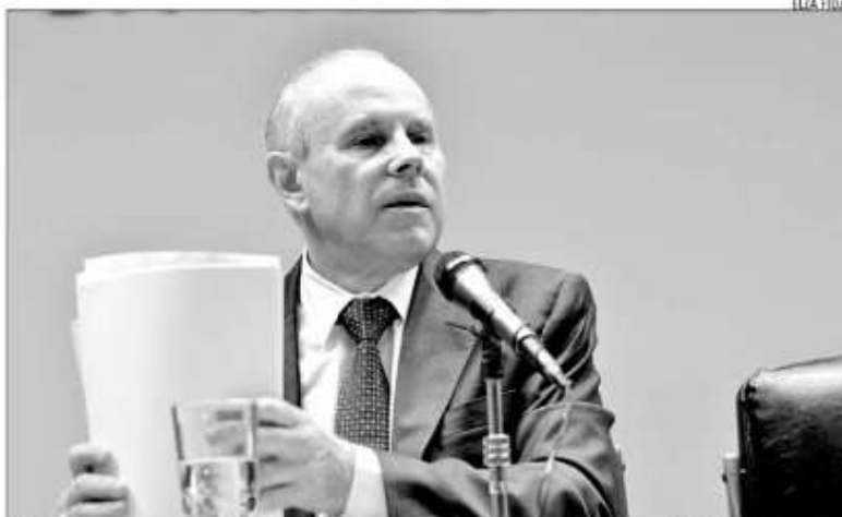
Guido Mantega vai negociar com prefeitos e deputados da Comissão Especial da PEC do FPM

A matéria consta na Proposta de Emenda Constitucional 241, que está tramitando na Câmara dos Deputados, e no Senado por meio da PEC 39, aumentará em R$ 186 milhões por ano o FPM das 167 prefeituras potiguares. Os 23,5% de todas as re-