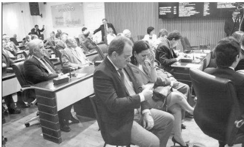
Veredores e secretários municipais acompanham o pronunciamento em plenário