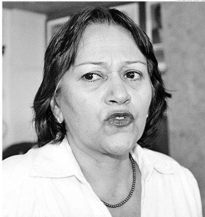
Deputada federal Fátima Bezerra é prioridade do PT nacional para o Senado