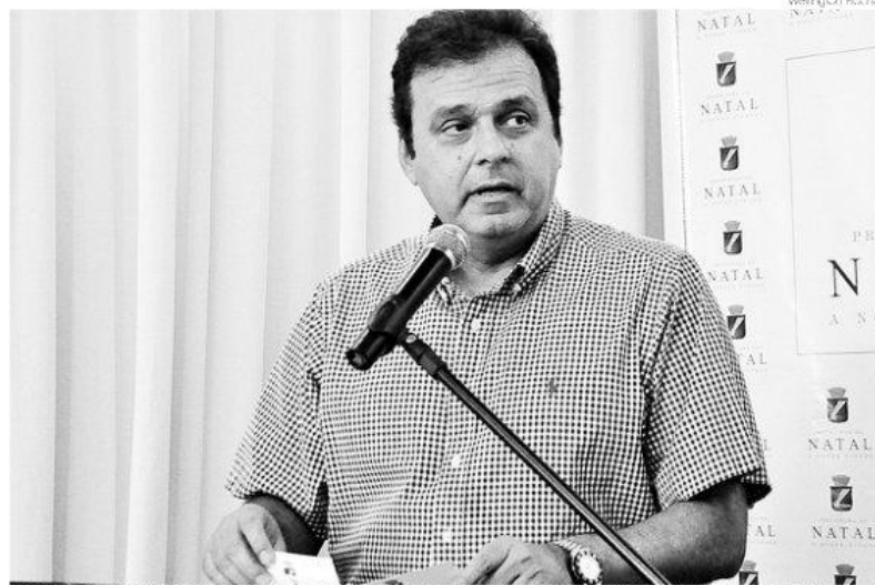
Prefeito de Natal, Carlos Eduardo, vai apresentar radiografia de seu primeiro ano de gestão e tratar de novos investimentos

O chefe do executivo municipal também mostrará que a folha de pessoal caiu de R$ 812 milhões, em 2012, para R$ 805 milhões, em 2013, redução obtida através de medidas de austeridade, cargos comissionados que não foram preenchidos e que devem ser extintos com a reforma administrativa a ser enviada neste semestre para apreciação dos vereadores. "Quando Carlos deixou a Prefeitura, em 2008, o comprometimento de gastos com pessoal era de 42,31%. Quando voltou, pegou com 54,56%, acima do limite legal da LRF, que é de 51%. Em dezembro passado, conseguimos fechar o quadrimestre com 48,71%, abaixo do limite