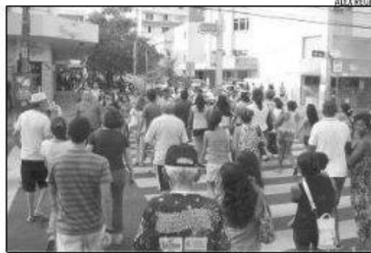
Segundo a pesquisa, a classe C consumiu R$ 1,17 trilhão em 2013

O estudo considera classe média a família com renda mensal per capita de R$ 320,01 a R$ 1.120 e apresenta quatro perfis do consumidor: os "batalhadores" formam o maior grupo e são os que mais consumiram em