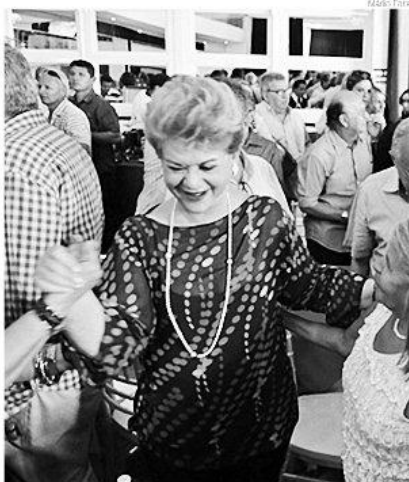
Ex-governadora foi pressionada por lideranças a assumir candidatura ao Governo

Na oportunidade mereceu destaque a presença da deputada Fátima Bezerra do PT, provável adversária de Wilma de Faria caso a vice-prefeita decida disputar o Senado, pretensão também externada pela petista, numa aliança com o PSD do vice-governador Robinson Faria, pré-candidato ao Governo do Estado. Em meio às comemorações de aniversário da vice-