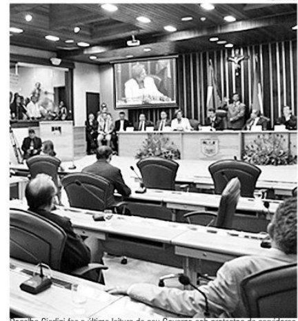
Rosalba Ciarlini fez a última leitura de seu Governo sob protestos de servidores

reaja no final e entregue o governo em condições de governabilidade", ressaltou Hermano Moraes, acrescentando que foram apresentadas novas promessas num final de go-