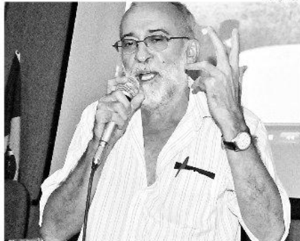
Siqueira: "Eles excluíram a gente da chapa. Depois querem a política de bater pé na sem golerio"

Garibaldi fica insistindo que podem surgir novidades de Brasília, para nos tornar reféns e enquadrar o PT. Eles dizem que eles vão ter um encontro com Lula na quinta-feira. Mas o Lula discute com todo mundo. Foi até na casa do Maluf. E isso não tem problema nenhum. Agora, que isso vai determinar a política no RN, tenho certeza que não vai sair nenhum decreto dessa conversa, estabelecendo que nós vamos subir no mesmo