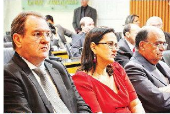
▶ Secretários acompanharam leitura na Câmara