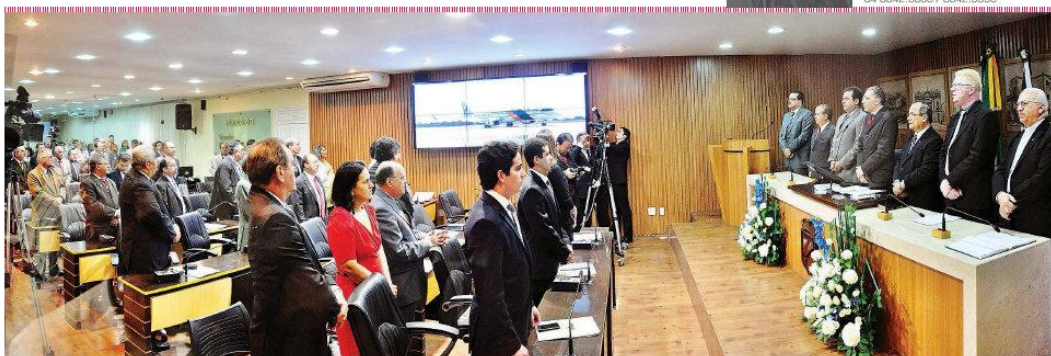
► Vereadores iniciam hoje sessões ordinárias da legislatura 2014