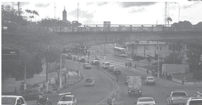
RAÍDO CORTEZ / N1

Complexo do Viaduto do Baldo tem custo de recuperação ampliado em quase 90% e interdição pode provocar caos no trânsito