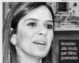
Wilma em Recife

te eleito da Câmara Municipal de Natal, integrante do PSB e um dos maiores defensores da candidatura da líder do seu partido ao Governo do Estado, declarou em entrevista recente a 'O JORNAL DE HOJE' que a candidatura de Wilma de Faria está a cada dia mais tornando-se "irreversível". Ele diz continuar acreditando que essa tese se fortalece e se consolida e em razão disso a vice-prefeita de Natal não poderá abandonar o projeto de ser governadora para disputar uma vaga no Senado. "Tudo isso ficou provado no encontro realizado no Versailles por ocasião do aniversário de Wilma de Faria", disse ele.