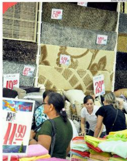
Vendas no RN, que já haviam crescido 6,6% em janeiro, acumulam aumento de 16,8% no primeiro bimestre deste ano

O IBGE divulgou na terça-feira, 15, os dados do volume de vendas relativos a fevereiro. No mês, o Comércio Varejista Ampliado do RN emplacou alta de 10,2%, o melhor segundo mês do ano desde 2011. No somatório dos dois primeiros meses (em janeiro a alta registrada foi de 6,6%) o primeiro bimestre de 2014 acumula alta de 16,8% nas