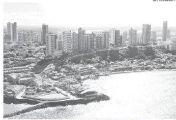
Cidade será a base dos africanos durante estadia no Brasil

Entre nossos futuros visitantes estarão executivos e diretores da GNPC, empresa responsável pela exploração e distribuição de todo o petróleo que entra e sai de Gana.