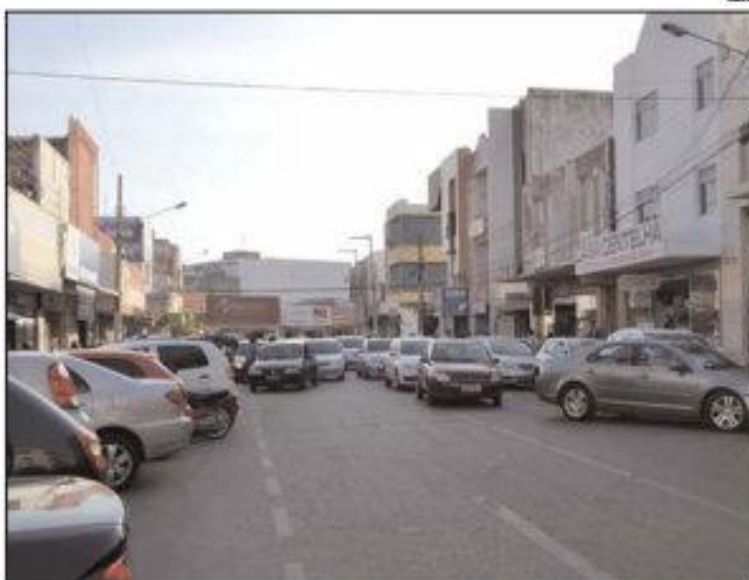
Lojas do comércio funcionarão normalmente no sábado