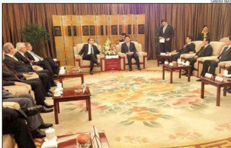
Henrique Eduardo Alves e demais integrantes da Comitiva se reúnem com Xi Jinping

Alves também lembrou que o presidente da China, Xi Jinping, deverá visitar o Congresso Nacional em julho, durante a visita oficial que fará ao Brasil por ocasião da reunião de cúpula dos Brics – grupo de países formado por Brasil, Rússia, Índia, China e África do Sul –, prevista para ocorrer em 15 de julho em Fortale-