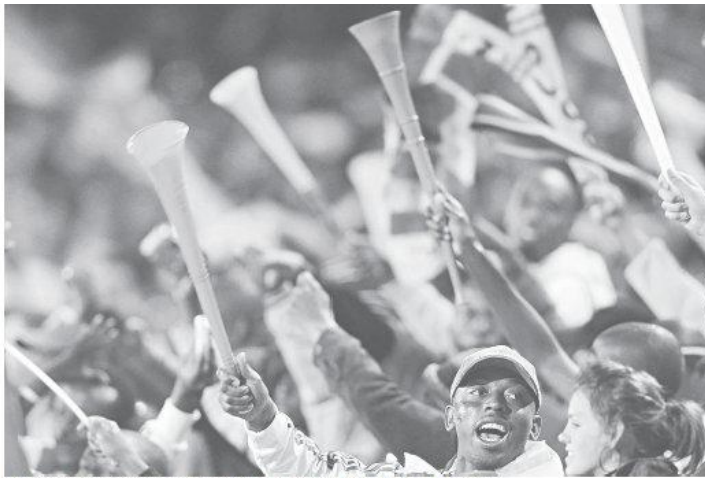
Torcedores virão em aviões fretados e procuraram hotel em Pamunirim para acomodar maior parte da caravana

Ele diz que a expectativa é de que pelo menos mil pessoas daquele país estejam na capital do Rio Grande do Norte no mês de junho.