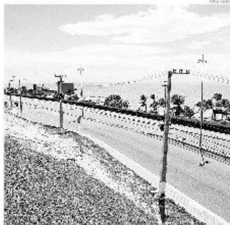
Titular antecipa que não vai fazer megaprojetos, mas focará as ações de mídia

"Infelizmente essa obra não estará completamente pronta para a Copa do Mundo, mas tivemos a confirmação de que o espaço estará aberto à visitação neste período", disse a secretária. Outros projetos que terão continuidade com a nova gestão é o Pronatec - Copa na Empresa, responsável pela capacitação de profissionais inseridos no ramo turístico, e a Reabilitação do Centro Histórico, com obras de conservação e restauração de 64 fachadas de prédios