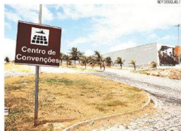
► Centro de Convenções: ampliação estimada em R$ 30 milhões