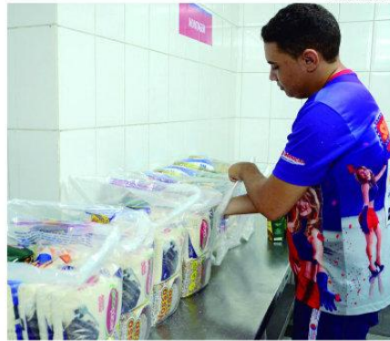
Estabelecimento monta quatro tipos do produto

Em doze meses - de abril de 2013 a março deste ano -, houve um aumento em 12 cidades e as maiores altas foram constatadas em Florianópolis (12,45%), Curitiba (11,8%), Porto Alegre (10,63%) e Rio de Janeiro (9,56%). As retrações foram observadas em Belo Horizonte (-8,38%), Aracaju (-8,18%), Manaus (-4,18%), João Pessoa (-4,18%), Salvador (-3,02%) e Natal (-2,84%).