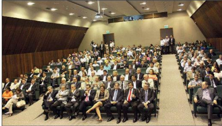
Eventos está na 20ª edição e discute temas relevantes para o desenvolvimento social e econômico do Rio Grande do Norte