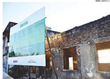
► Complexo Cultural da Rampa: obra orçada em quase R$ 10 milhões

ano anterior. Foram 24.246 voos em 2013, contra 27.135 em 2012. O número de passageiros caiu de 2.553.195 para 2.281.708. "Já tenho algumas conversas com a America Airlines (maior companhia dos Estados Unidos). Esperamos reduzir as perdas de voos ocorridas nos últimos anos", comenta.