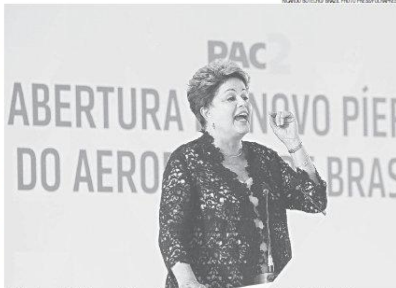
► Dilma Rousseff: "Não há a menor hipótese de o governo federal pactuar com qualquer tipo de violência"

"Nós, nesses grandes eventos, estamos aprendendo. Aprendemos com a Rio+20, com a Copa das Confederações. Temos certeza que a Copa é outra questão. É o futebol voltando para casa, é algo que todos os brasileiros, todos, sem exceção, mesmo os que fa-