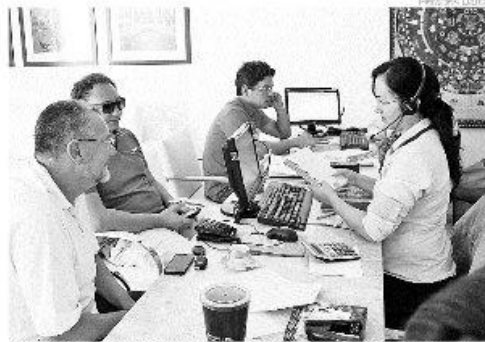
Abav-RN destaca aumento da procura de roteiros por clientes da classe C

Entre os destinos internacionais mais buscados durante o feriado e durante o ano, está a Argentina, especialmente a cidade de Bariloche, o Chile, Orlando e Miami, que de acordo com a presidente da