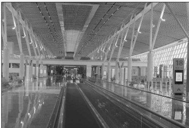
Aeroporto de Brasília: Capacidade vai passar de 16 milhões para 21 milhões de passageiros/ano

« AEROPORTOS » O consórcio Inframérica inaugurou ontem parte de obra prevista para o aeroporto de Brasília. No RN, afirma não ter pendências