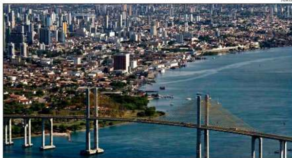
Turistas vão movimentar R$ 6,7 bilhões ao longo dos jogos em Natal

Estima-se que 3,7 milhões de pessoas, entre brasileiras e estrangeiras, estarão em trânsito pelo Brasil, durante o período do evento