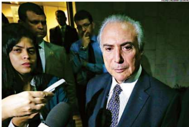
► Michel Temer espera apoio de seu partido em mais estados da federação durante o pleito para a presidência

A grande maioria e a manifestação de vários líderes do PMDB foi de apoio, dizendo que não há outra solução, que nós tínhamos que fazer isso. Que nós temos que apoiar a candidatura do vice-presidente, a pré-candidatura do vice-