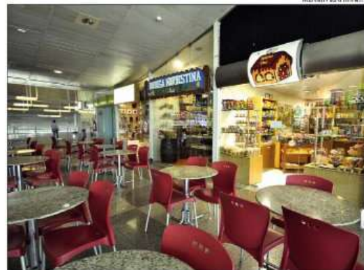
Lojas no Augusto Severo: poucas empresas migrarão para o novo aeroporto

A reportagem da Tribuna do Norte entrou em contato com a Infraero para questionar sobre a audiência e saber sobre como está sendo feita a comunicação aos lojistas. A assessoria de imprensa informou que a mudança do Augusto Severo para o de São Gonçalo do Amarante está sendo tratada pela Secretaria de Aviação Civil (SAC), órgão responsável pela gestão do setor do país. E que a Infraero aceitará as recomendações da SAC.