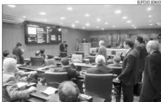
Vereadores rejeitaram parecer que pediu punição do vereador