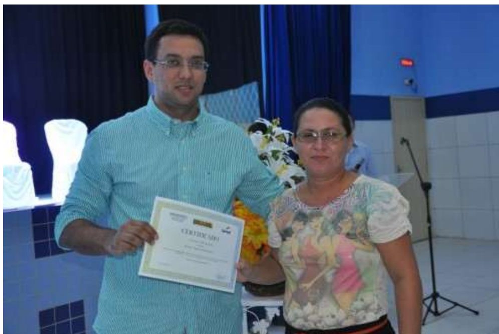
Concluinte recebe certificado das mãos do secretário de educação Rodrigo Aladim