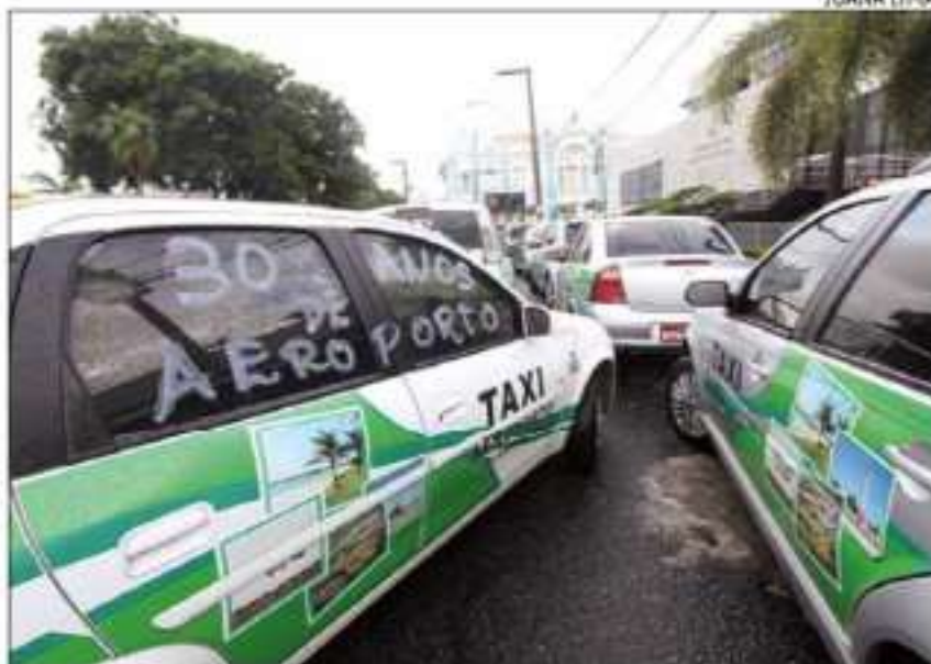
Taxistas do Augusto Severo protestaram em frente à Assembleia