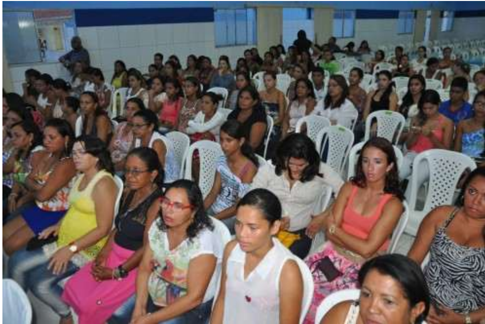
Concluintes do Pronatec prestigiam solenidade