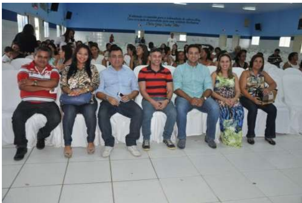
Secretários e assessores prestigiam solenidade