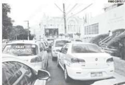
Taxistas do Augusto Severo acompanharam audiência pública

Em consulta feita à Inframérica, a assessoria de imprensa informou que a data para entrada em operação só seria 100% confirmada após a homologação das empresas, processo marcado para o dia 19 próximo. "O dia 22 depende ainda da confirmação que deve acontecer no dia 19 de maio, quando a Anac deve homologar as companhias aéreas. Por isso, o dia 22 só será 100% confirmado após esta etapa cumprida", informou o Inframérica, por e-mail.