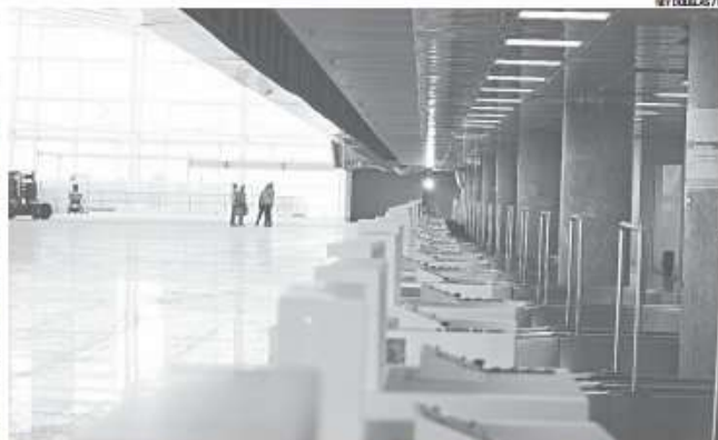
Terminal do Aeroporto Aluízio Alves deve ser inaugurado no início de junho, a tempo para a Copa

Até o fim da tarde, soava estranho o fato de, a sete dias do início das operações, ninguém confirmar a data. A falta de confirmação souu ainda mais estranha diante da ausência de representantes da Empresa Brasileira de Infraestrutura Aeroportuária (Infraero) e do Consórcio Inframérica (responsável pela construção e administração do terminal) em audiência pública na Assembleia Legislativa para tratar do aeroporto Augusto Severo, em Parnamirim, que deve ser desati-