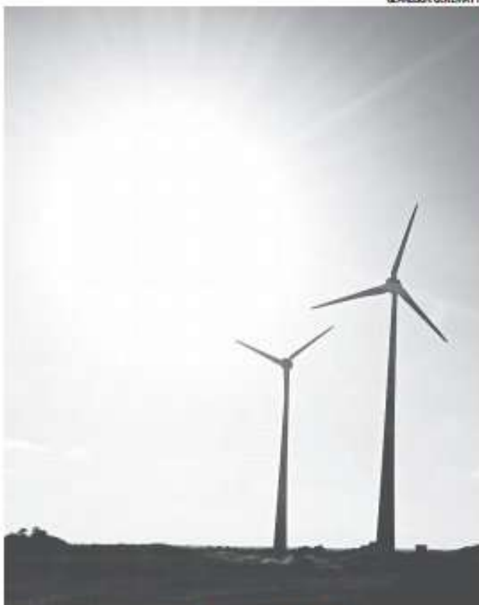
► Eólicas devem chegar à região da Costa Branca do estado