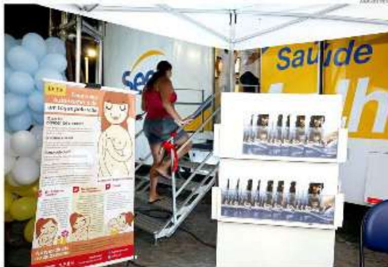
Projeto permanecerá no município durante 60 dias úteis.

O Sesc RN foi o primeiro do país a implantar a Sesc Saúde Mulher. O êxito no Estado serviu como base e incentivo para o departamento nacional do Sesc levar o projeto a outros Estados. A unidade móvel oferece gratuitamente exames preventivos como mamografia, ultrassonografia e papanicolau, além de orientações sobre