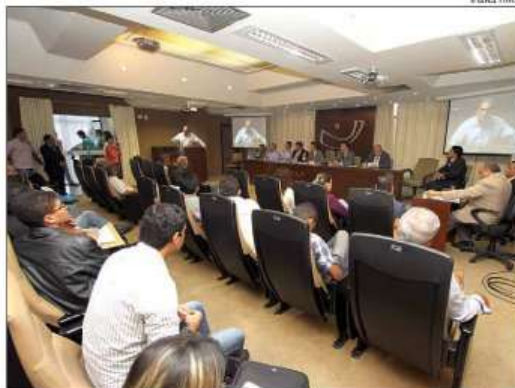
A mudança de aeroporto no Rio Grande do Norte foi tema de audiência pública

Segundo Morquecho, a falta de informações tem prejudicado também os funcionários das lojas. "Eles não podem nem procurar novos empregos porque não sabemos o dia que o aeroporto será fechado. Eu estive pessoalmente na sede da Infraero em Brasília para entregar um