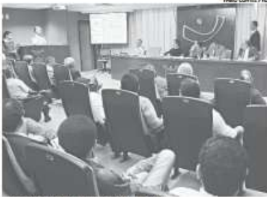
Audiência Pública na Assembleia Legislativa