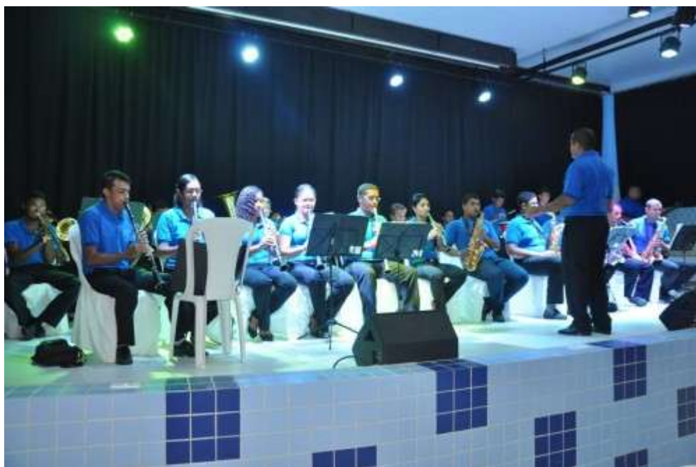
Filarmônica Monsenhor Honório abrilhantando a cerimônia