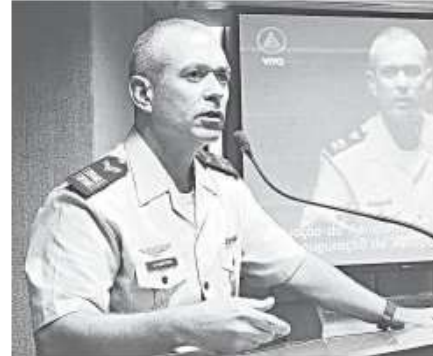
FÁBIO CORTEZ / LU

A ideia é que o CTO atraia para Natal unidades aéreas operacionais a fim de aprimorar as técnicas e táticas no emprego de aeronaves. Vai concentrar ainda cursos de emprego operacional. Estão previstos 16 cursos envolvendo a formação de 500 alunos, cursos de tática aérea com 110 aspirantes a oficial, além da possibilidade de instalar um centro integrado de formação de pilotos de helicópteros envolvendo