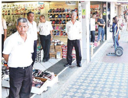
► Sindicato dos Empregados pleiteia que em dias de jogo na Arena, o comércio pague o dobro da atual hora de trabalho

A publicação seguiu uma das regulamentações postuladas pela Lei Geral da Copa (12.663/2012), um conjunto de medidas indicadas Federação Internacional de Futebol (Fifa)