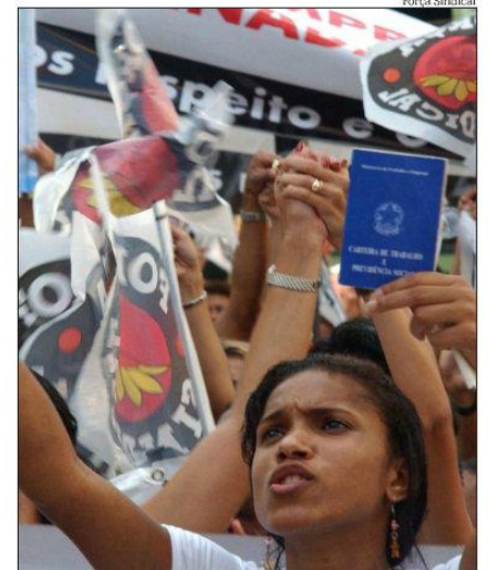
O assunto continua presente na pauta do movimento sindical

O relator apresentou uma proposta alternativa à de Paim. No lugar das 36 horas semanais, Pinheiro estabelece 40 horas, como propõe a Central Única dos Trabalhadores (CUT), também sem redução salarial. A medida, se aprovada, poderá gerar cerca de 2 milhões de novos postos de trabalho, pelas estimativas apresentadas por Pinheiro no seu relatório.