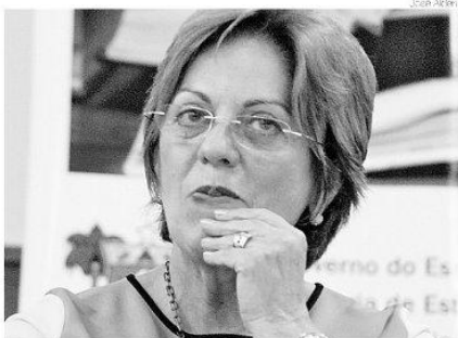
Governadora Rosalba Ciarlini e o PMDB eram aliados até setembro de 2013

Apesar da confirmação do prefeito peemedebista, a cúpula do partido preferiu não se manifestar sobre o assunto. O deputado estadual Walter Alves, o presidente da Câmara Federal, Henrique Eduardo Alves, e o ministro Garibaldi Filho foram procurados, mas preferiram o silêncio. Porém, ressalta-se que em dezembro, Garibaldi afirmou que, por ele, o nome do partido para o Governo do Estado seria Fernando Bezerra.