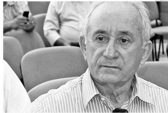
... Segundo afirmou o prefeito Chico Araújo, após conversa com o deputado federal Henrique Alves

ernador, mas decidiram não participar do pleito deste ano por entender que podem prestar melhores serviços ao Rio Grande do Norte onde estão.