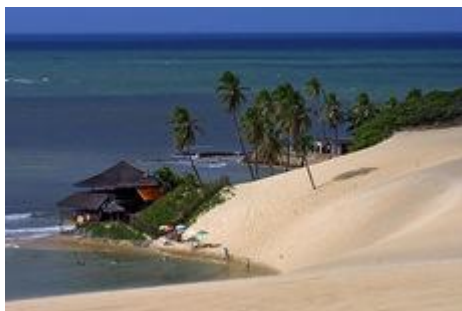
Belezas naturais do estado serão apresentadas em Miami e Cidade do México

Seis destinos consolidados no estado serão apresentados a empresas emissoras de turistas dos dois países, tendo como foco os jogos da Copa 2014 previstos para ocorrer em Natal