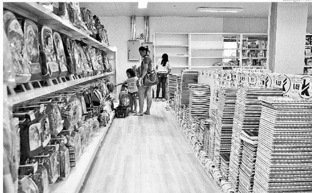
Com antecipação do início do ano letivo, expectativa é que movimento nas livrarias aumente ainda mais até a próxima semana