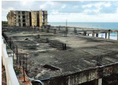
Novo projeto contempla mirante público com vagas de estacionamento

A construção está situada numa Zona Especial Turística (ZET-2), que tem prescrições específicas. Como uma compensação à cidade, o grupo NATHWF construirá ainda um mirante aberto, com vista para a praia, além do acesso ao mar pelos dois lados do empreendimento. O mirante, com acesso gratuito para a população, tem vagas para estacionamento e ficará entre o hotel Natal Praia e Hotel Pestana.