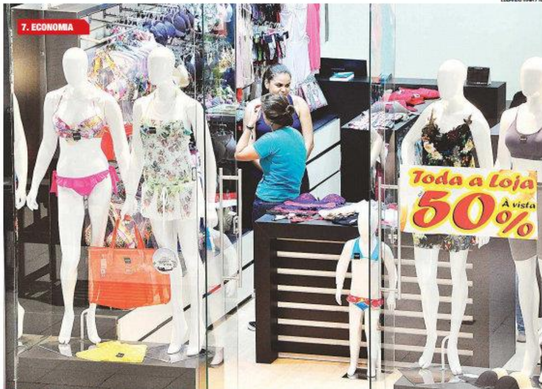
► Sinal dos tempos: comércio potiguar está realizando promoções e mesmo assim volume de vendas não cresce