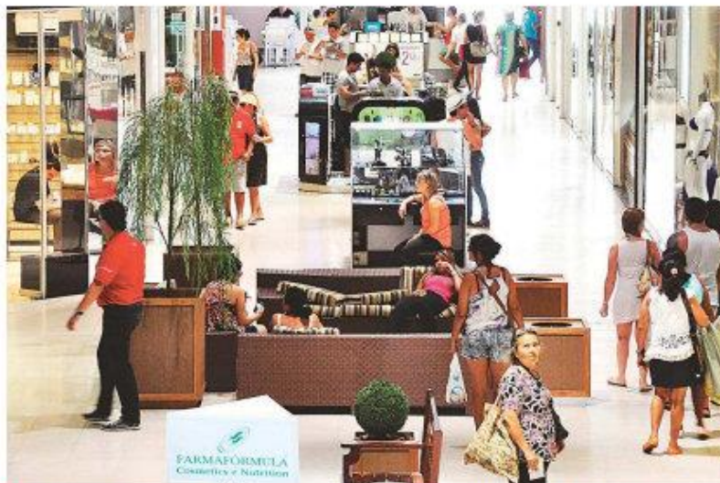
► Apesar dos dados não terem sido divulgados, varejistas dizem que o mês de janeiro foi pior do que a média

Essa queda também será sentida pelo setor de varejo em shoppings. Dados da Associação Brasileira de Lojistas de Shopping (Alshop) mostraram decréscimo no ano passado e projetam crescimento baixo, de 1,5%, em 2015.