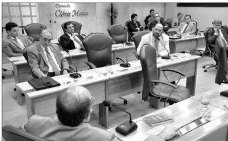
Deputados defendem as opções que fizeram durante a discussão na Assembleia Legislativa