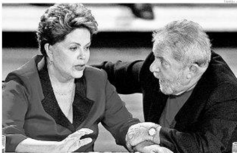
Segundo Dom Jaime, Dilma Rousseff e o ex-presidente Lula foram omissos diante do escândalo de corrupção da Petrobras.

Apesar de criticar a negligência governamental, Dom Jaime Vieira considera que houve conquistas institucionais no combate à corrupção. "Algumas pessoas até se recusam a assumir um cargo público porque dizem que depois não terão verbas suficientes para gastar com advogados em vista das implicações de prestações de contas. Então, a questão da responsabilidade fiscal é algo muito importante, são conquistas importantes. Os mecanismos de controle estão aí. Agora as pessoas são negligentes e tratam da coisa pública como sendo algo particular e isso é muito