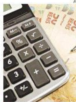
► IR será reajustado em 4,5%

Também é possível a entrega online, para quem tem certificado digital (assinatura para proter transações eletrônicas), ou