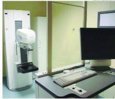
Aparelho de mamografia utilizada para a saúde da mulher