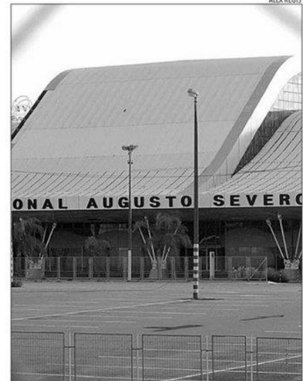
Base transfere setores para o terminal, mas não descarta parcerias

Como a área é militar desde julho de 2014, o acesso é limitado. Um portão restringe a entrada de veículos à estrada que é comum à Base Aérea e ao aeroporto. Geralmente aberto durante o dia, é possível chegar à entrada da Base à esquerda. À direita, militares vedam o acesso. Ainda é livre a passagem pelo caminho que contorna o antigo terminal. Atletas costumam correr por lá.