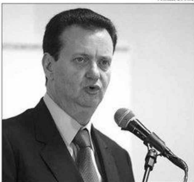
Kassab criou o PSD em 2011 e já articula fusão com o PROS

Nas eleições do ano passado, o PSD conseguiu eleger um governador, Robinson Faria, do Rio Grande do Norte, que aderiu à legenda fundada pelo ex-prefeito de São Paulo. Com isso, viabilizou sua candidatura, coisa que não conseguiu na eleição anterior, quando terminou sendo vice na chapa da então candidata do DEM, Rosalba Ciarlini. Antes do PSD, ele co-