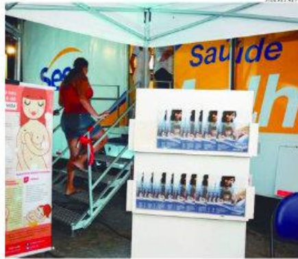
Ponta Negra receberá o unidade do Sesc Saúde Mulher

Para marcar consulta na Sesc Saúde Mulher, é preciso levar a xerox (com originais) da Identidade, CPF, cartão do SUS, comprovante de residência e carteira de associada Sesc RN. Os agendamentos podem ser feitos a partir desta sexta-feira, das 8h às 11h e das 12h às 17h. A carteira do Sesc pode ser feita no local. Para a dire-