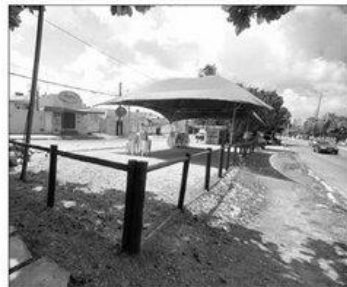
Av. Ayrton Senna: bares funcionam há anos em área pública

Outra situação que também implica nesta ilegalidade, conforme Almeida, é que as instalações só deveriam ter si-