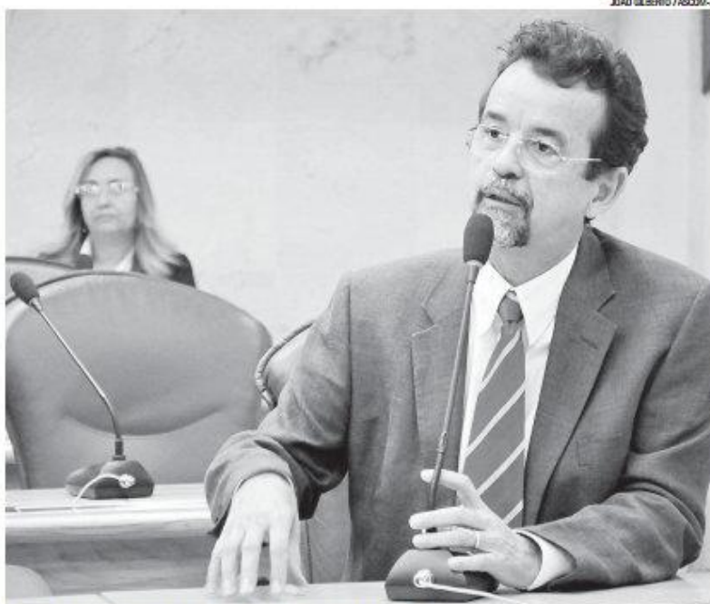
► Segundo deputado, ideia do partido é discutir o futuro de Natal antes das eleições

De acordo com a resolução, o PT quer animar, nos âmbitos das instâncias, especialmente dos núcleos e zonais, o debate de propostas que constituam eixos para a atualização desse proje-