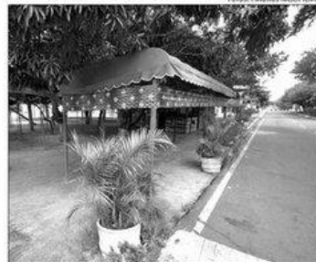
Avenida das Alagoas: estrutura está na mira da prefeitura