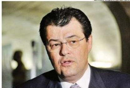
Ministro Braga disse que o leilão não servirá para atender à Petrobras

No encontro com Dilma Rousseff, foi feita uma avaliação da conjuntura do setor elétrico, cenário que, de acordo com o ministro,